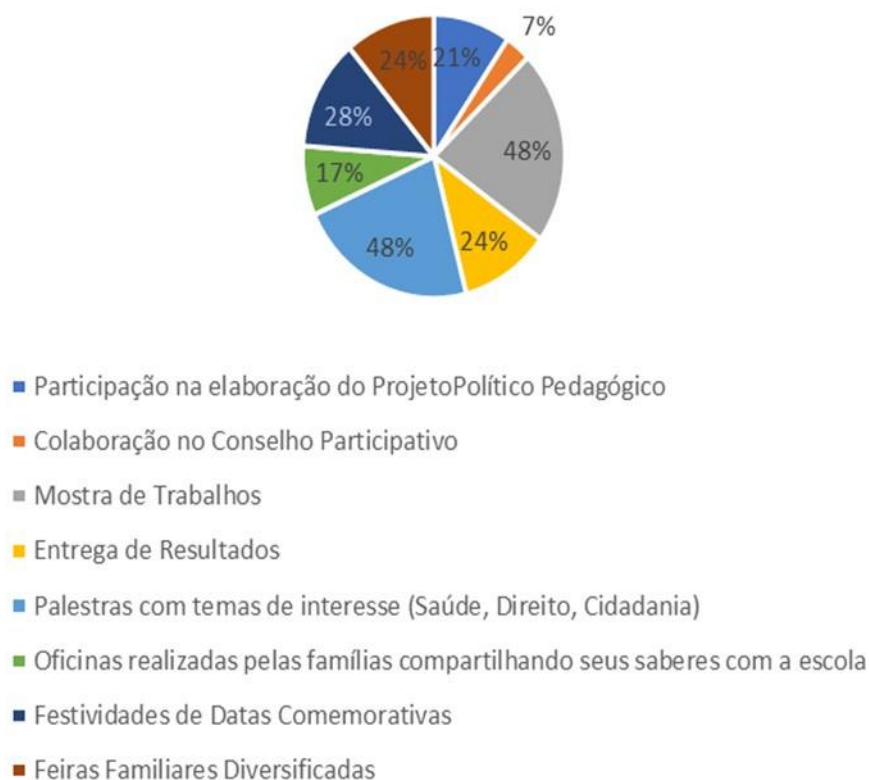
Gráfico 3 - Respostas do questionário e contribuições da equipe

Este gráfico detalha a frequência de participação dos pais e responsáveis em diferentes eventos pedagógicos. As maiores porcentagens (48%) referem-se à participação na elaboração do Projeto Político Pedagógico e na Colaboração no Conselho Participativo, evidenciando um forte envolvimento nas decisões pedagógicas. Outras ações como festividades (24%), oficinas (21%), feiras (17%) e formação com certificação (7%) apresentam uma diversidade de adesão, refletindo o interesse dos responsáveis por temas pedagógicos, mas também sugerindo áreas onde é possível promover uma maior mobilização.