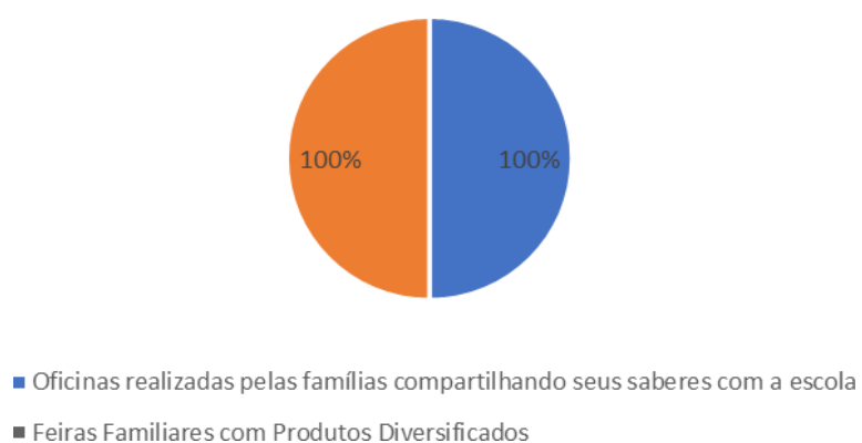
Gráfico 1 - Respostas do questionário da participação familiar

Este gráfico circular apresenta duas ações realizadas no âmbito da participação das famílias na escola: "Oficinas realizadas pelas famílias compartilhando seus saberes com a escola" e "Feiras Familiares com Produtos Diversificados". Ambas as ações apresentam 100% de respostas, indicando que foram amplamente aceitas e valorizadas pelos participantes. A igualdade percentual sugere que tanto a partilha de conhecimentos como a contribuição econômica/comercial têm igual relevância na perspectiva das famílias.