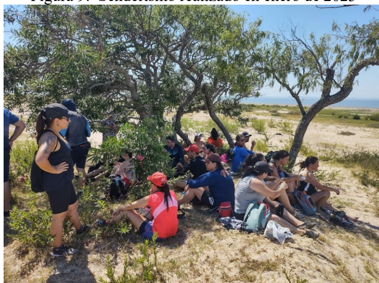
Figura 9: Senderismo realizado en enero de 2023