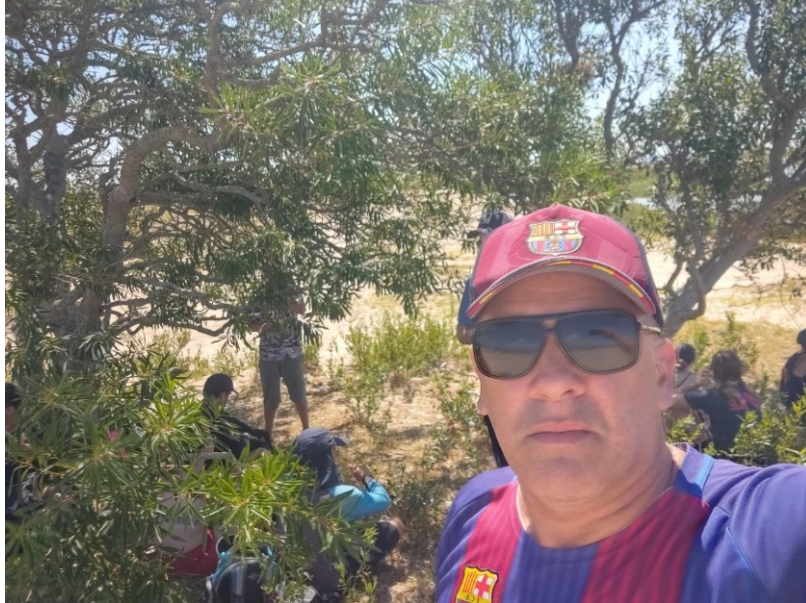
Figura 10: Senderismo realizado en enero de 2023.