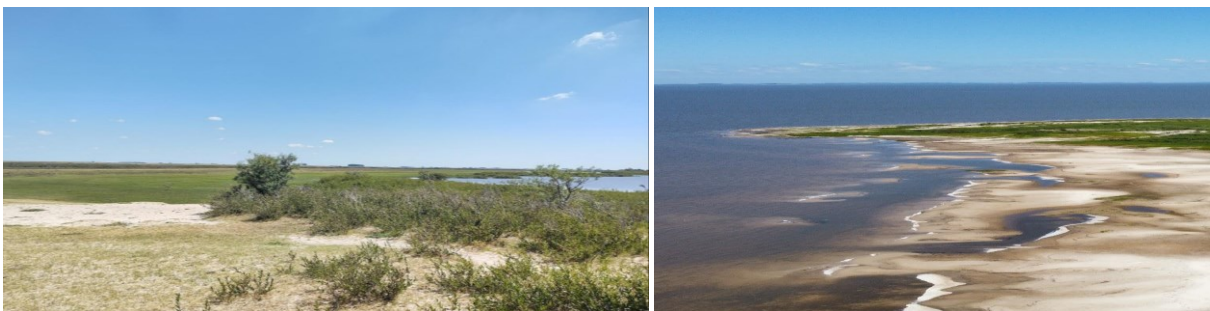
Figura 4 e 5: Flora local