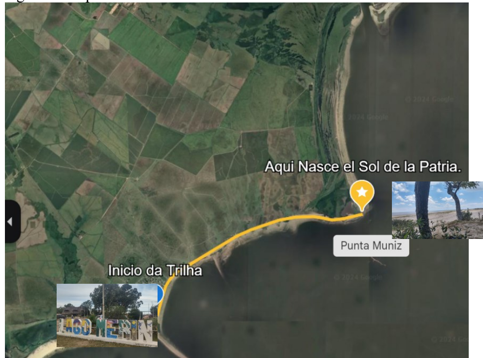
Figura 3: Mapa do Itinerário

es señal de servicio móvil de celular de la operadora ANCEL, y por consecuencia internet móvil.