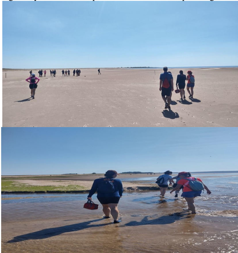
Figura 7 y 8: Caminata por el terreno arenoso o por el agua.

Depto. Cerro Largo - Municipio Laguna Merín.