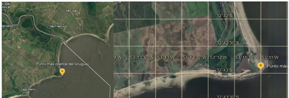
Figura 02: Mapa da Localización de Punta Muniz