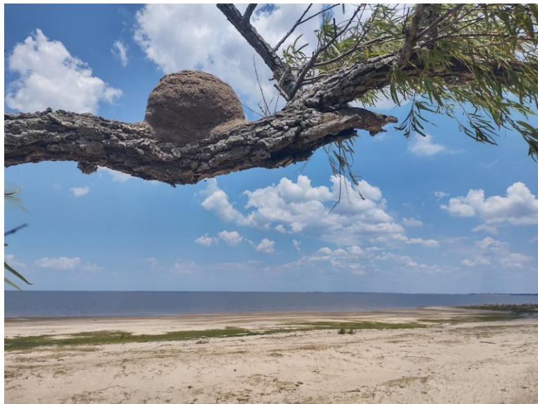
Figura 6: Fauna local