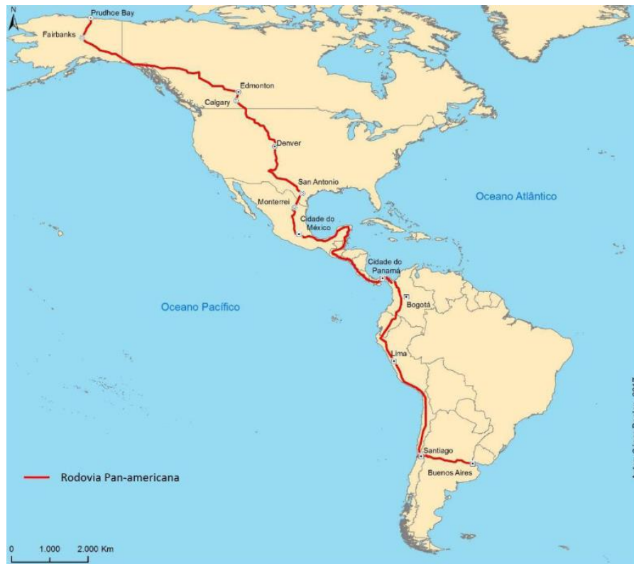
Figura 5 – Rodovia Pan-Americana