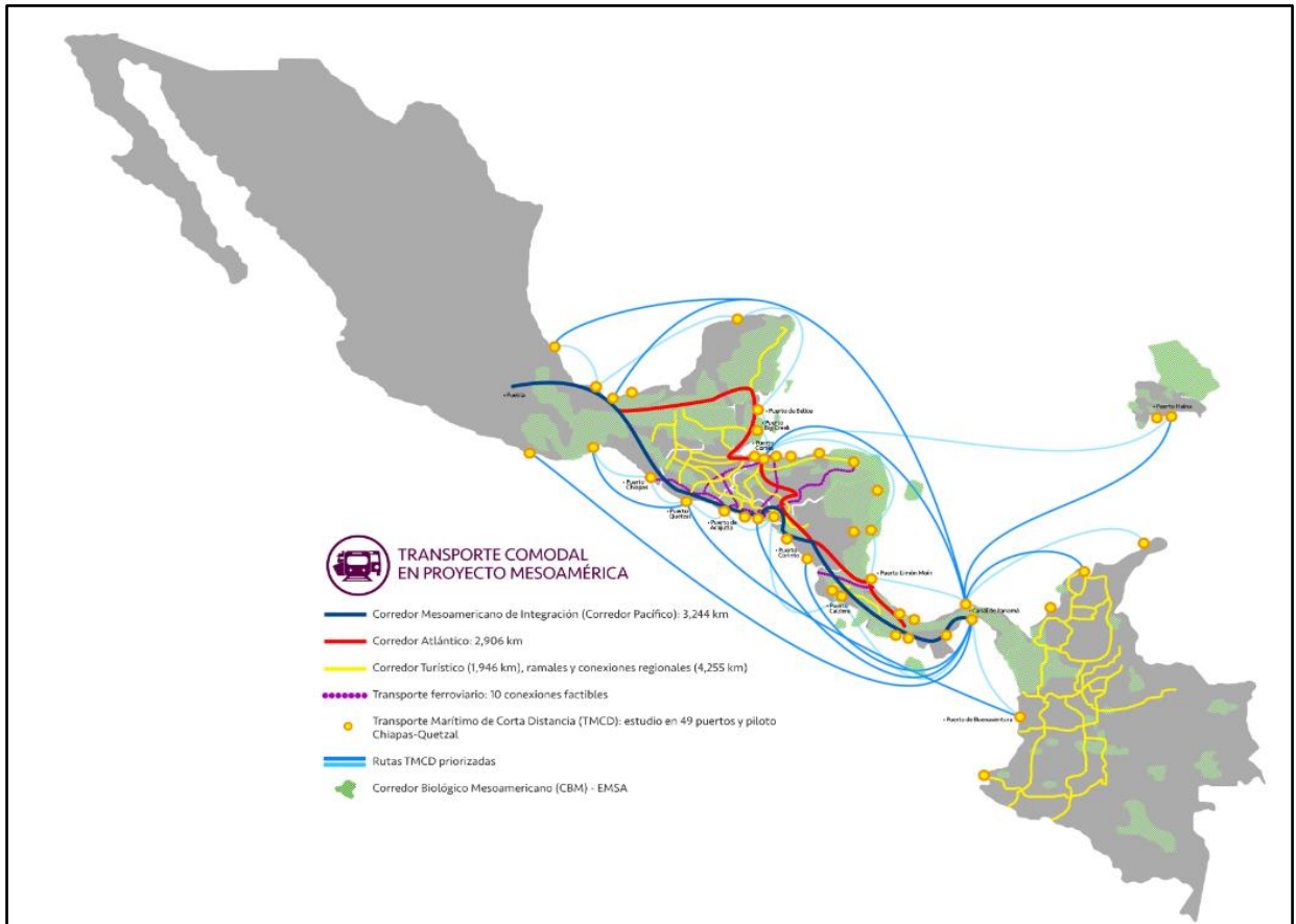
Figura 3 – Rede Internacional de Rodovias Mesoamericanas