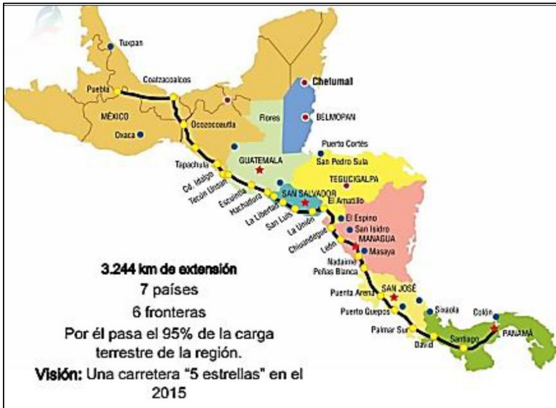
Figura 4 – Corredor Pacífico/Corredor Mesoamericano