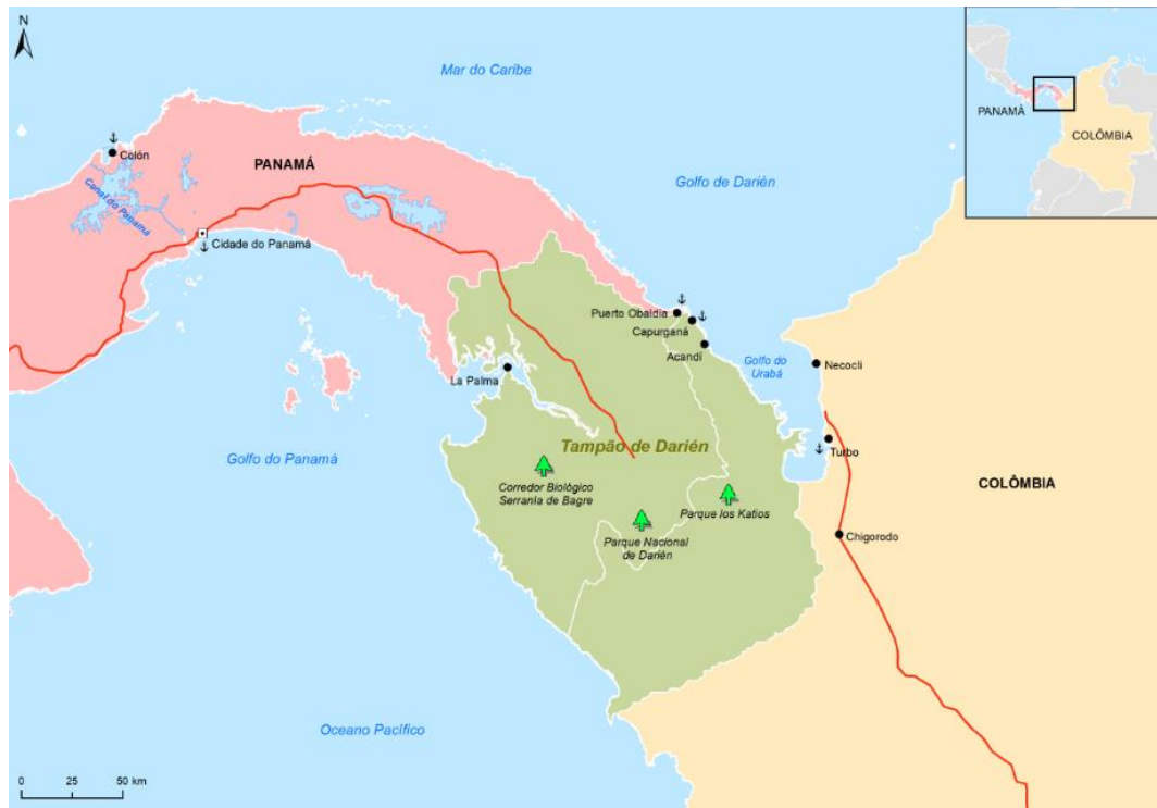
Figura 1 – Tampão de Darién

a expansão de enfermidades, além de conflitos com os EUA, que entende a área como uma barreira natural ao trânsito de migrantes ilegais sul-americanos que almejam chegar aos EUA (CUELLO; GUERRERO; CAMPIS, 2012 apud SOUZA, 2019, p. 161).