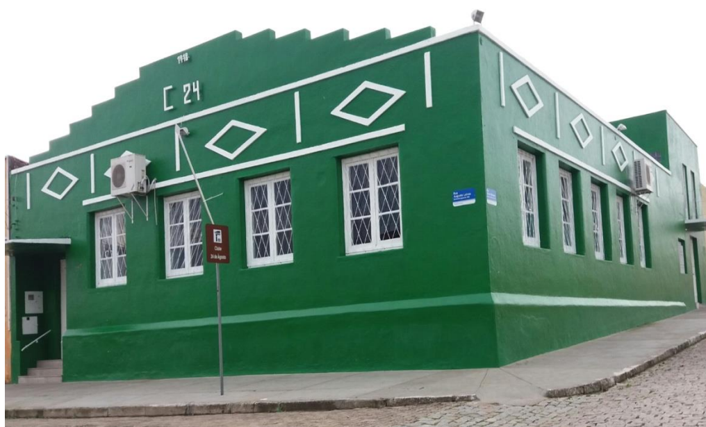
Figura 02: Fachada clube 24 de agosto (2019).

com a publicação de um livro 1 sobre o Clube 24 de Agosto composto por uma série de capítulos ilustrando parte do que foi essa história de luta e união. Os festejos referentes ao centenário do clube despertou meu interesse em conhecer melhor a sua trajetória. Se trata de um clube idealizado para a comunidade negra de Jaguarão, para que pudessem ter um lugar para fazer suas festas, sociabilidade e diversões. O clube tem em seu histórico dificuldades financeiras e outras lutas para permanecer em funcionamento, contando com a mobilização da comunidade jaguareense.