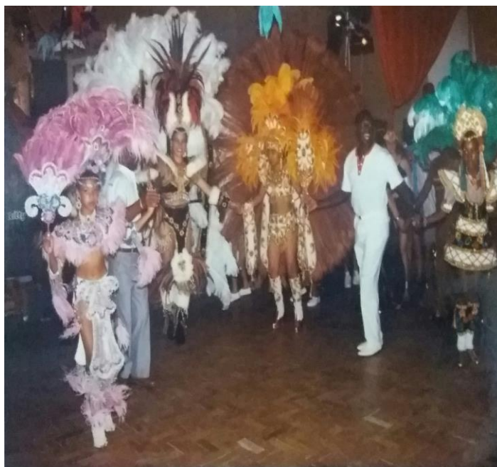
Figura 09: rainhas e princesas do Clube 24 de Agosto no ano de 1997.