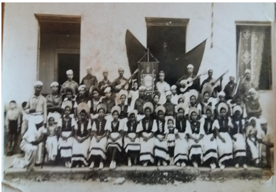
Figura 04: Bloco de carnaval união da classe clube 24 de agosto