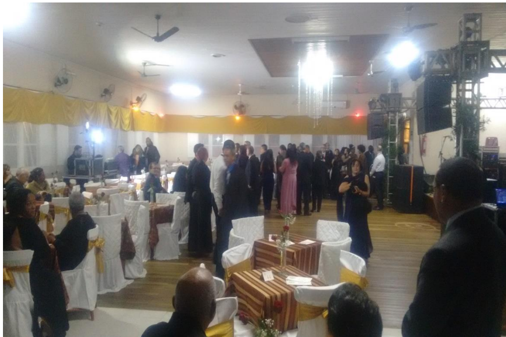
Figura 03: Interior do Clube 24 de Agosto na festa dos 100 anos (2018).