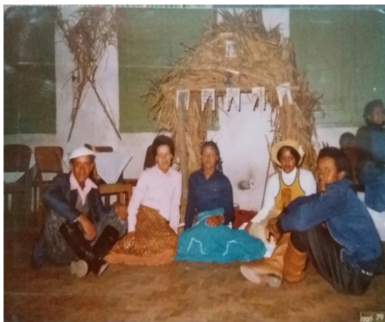
Figura 05: Festa junina do Clube 24 de Agosto 1979.