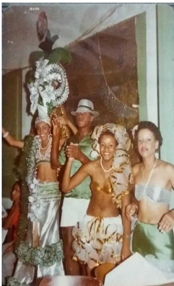
Figura 07: Baile de carnaval clube 24 de agosto 1982