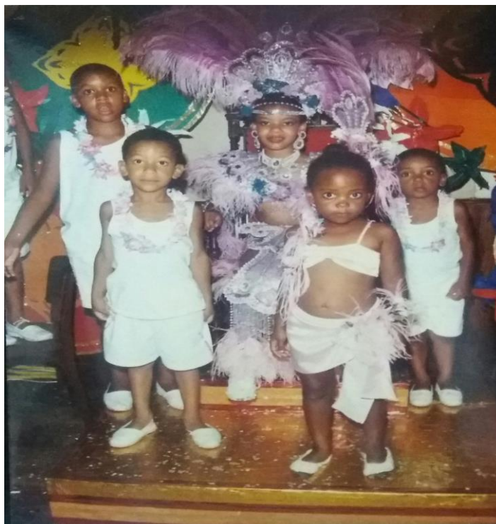
Figura 10: Fotografia da princesa do Clube 24 de Agosto com seus familiares.