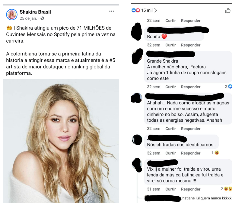
Figura 9 - Publicação no perfil da Shakira Brasil no Facebook Recorte 2