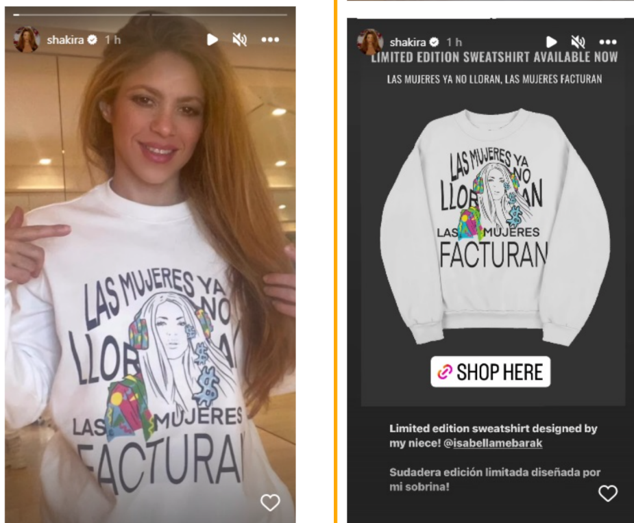
Figura 6