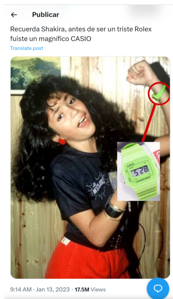
Figura 5 - Post retirado do perfil do Twitter Casio Team