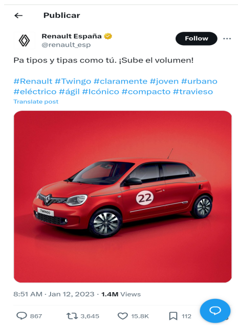
Figura 4- Post retirado do perfil do Twitter da marca Renault na Espanha