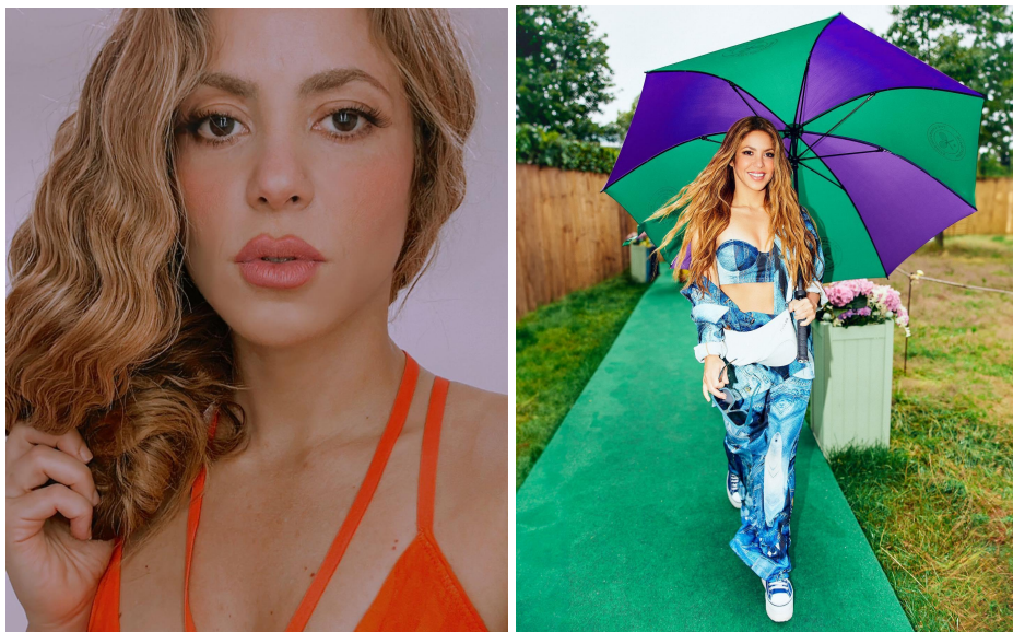
Figura 2 - Foto retirada do perfil da Shakira no Instagram

O site Nsctota diz que ela tem em sua genética pele branca, cabelos pretos e volumosos os quais atualmente são longos e ondulados e os pinta de loiros 14 , o site Portal da Shakira relata que ela tem olhos castanhos escuros, de pequena estatura 1,57m de altura e o seu peso de 53 Kg 15 . Logo abaixo seguem duas fotos, ambas retiradas de sua página oficial do instagram.