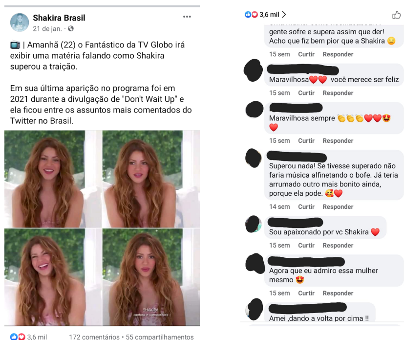
Figura 10 - Publicação no perfil da Shakira Brasil no Facebook Recorte 3