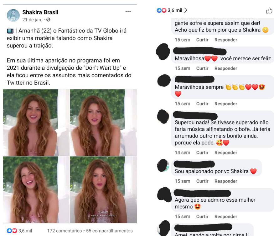
Figura 12 - Publicação no perfil da Shakira Brasil no Facebook Recorte 5