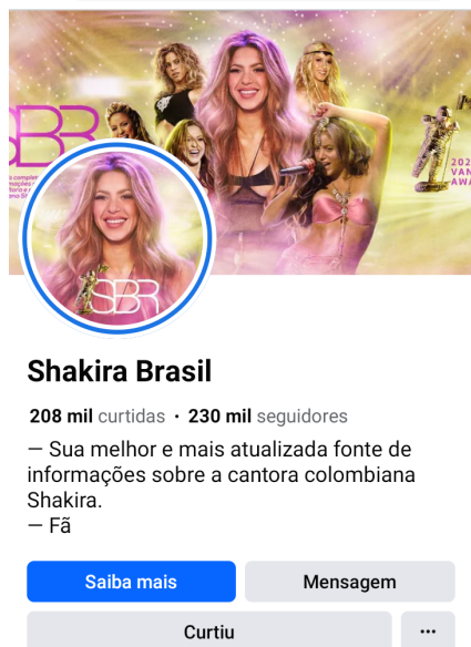
Figura 7 - Perfil do fã-clube brasileiro no Facebook.