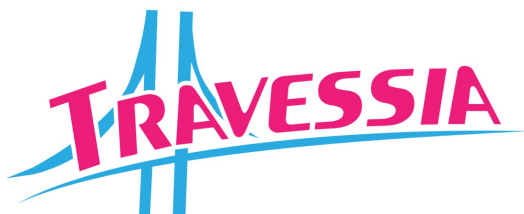
Figura 6 - Sugestão I

Aqui estão presentes as cores da bandeira do movimento trans e a ponte. Portanto, a arte foi descartada por conta da fonte usada no título.