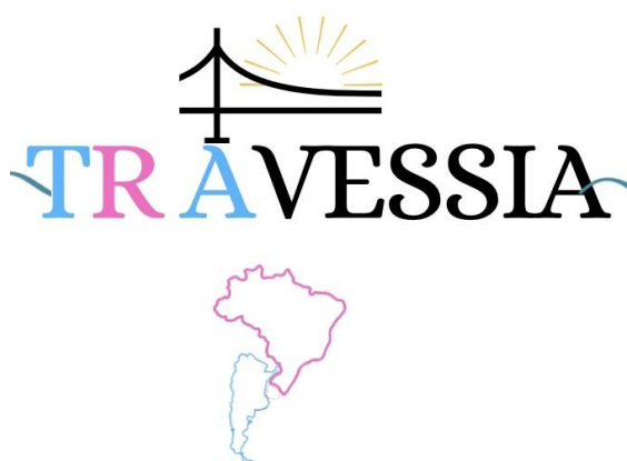
Figura 1 - Esboço I da identidade visual

Ideias para identidade visual - a partir dos meus primeiros esboços: