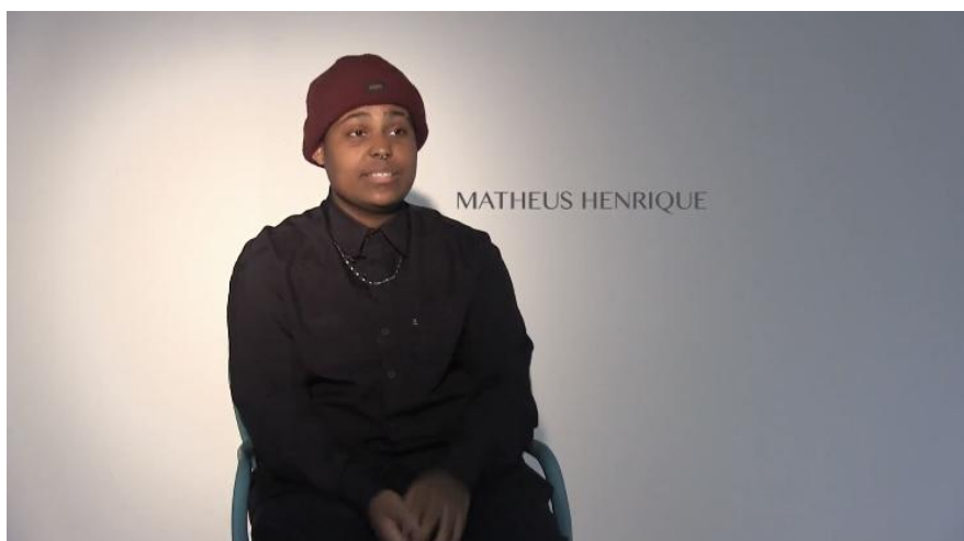
Figura 10: GC presente no documentário

Para a divulgação, primeiramente eu crio o perfil na rede social e testo as identidades visuais para ter uma ideia de como ficaria apresentada. Posteriormente selecionei os vídeos making off , alguns trechos do documentário e imagens dos ensaios fotográficos para produzir vídeos de 1 minuto que ficarão disponíveis no perfil. E para o teaser seleciono trechos do documentário que tragam uma narrativa de forma a instigar o espectador a assistir o produto. Procuro fazer um teaser com pouco mais de 1 minuto, para também poder utilizar no perfil da rede social.