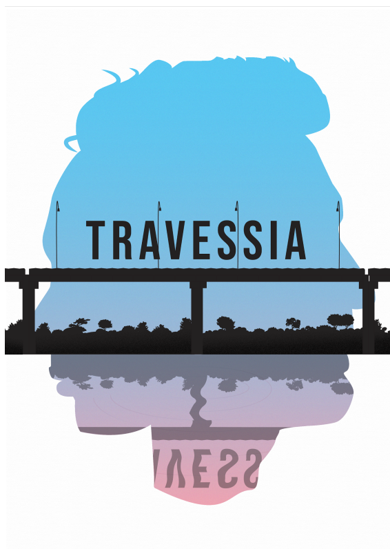
Figura 9: Capa do documentário

Aqui trabalhamos com alguns dos elementos apresentados na ideia inicial. A ponte faz referência à ponte da integração, que liga São Borja a Santo Tomé, com a ideia de atravessar de um lado ao outro. As cores ao fundo, representam as cores da bandeira do movimento trans (azul claro, rosa claro e branco). E o diferencial das artes anteriores vem em dois rostos, que representam duas feições agênero 9 , dando a ideia de que a travessia da ponte faz alusão a travessia do reconhecimento de gênero. E o espelhado, na parte inferior, representa a dualidade do ser.