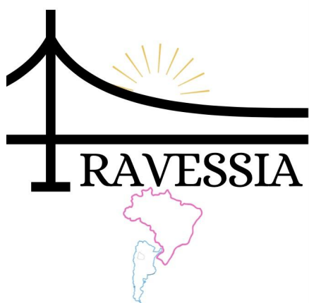
Figura 2 - Esboço II da identidade visual