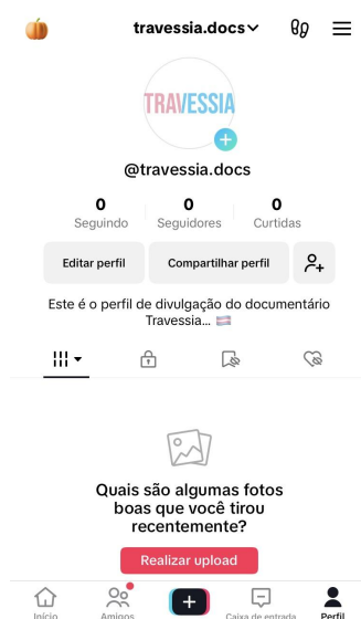
Figura 12: Perfil do TikTok

https://youtube.com/@Travessia.docs_?si=nY-8R2Gqc5eXHsWr