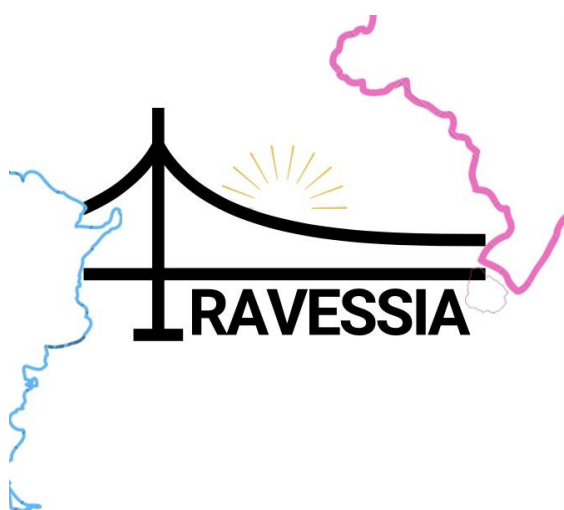
Figura 3 - Esboço III da identidade visual

Aqui uso basicamente os mesmos elementos. Mas a diferença está na ponte fazendo o papel do T no título. Por problemas na legibilidade no título, o mesmo foi descartado.