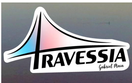
Figura 7 - Sugestão II

Aqui contém os mesmos elementos da arte acima postos de maneira diferente, a ponte fazendo o trabalho do T no título. Portanto, foi descartada pela ilegibilidade do título e por ser a mesma fonte.