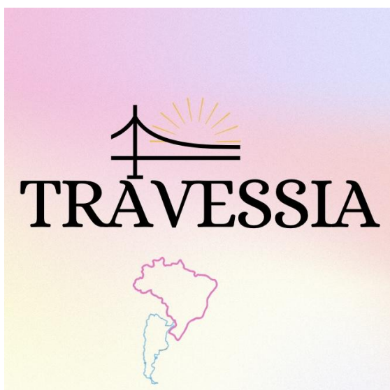
Figura 5 - Esboço V da identidade visual

Aqui chego em algo mais próximo de um sentido e de uma identidade mais original. Mas mesmo assim a ideia foi descartada por conter alguns elementos literais demais, como a ponte e o pôr do sol.