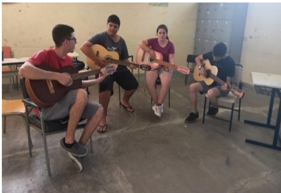
Figura 8: Oficina de violão