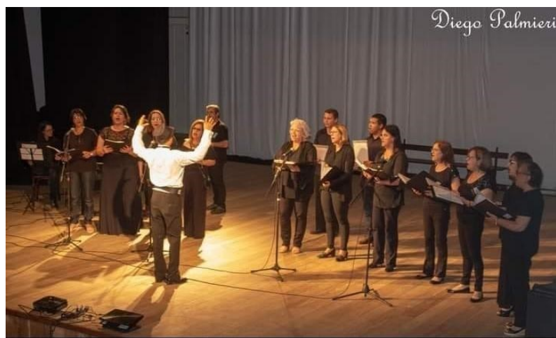
Figura 5: Jaguar in Chorus

Jaguar in Chorus : Tive a oportunidade de conhecer pessoas de corais de diversas cidades, podendo assim ter conhecimento de pessoas de locais diferentes.