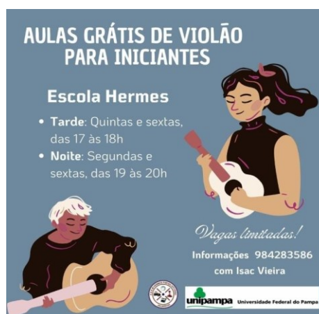
Figura 9 - Card de Divulgação

Após o trabalho realizado, no ano de 2022, com as oficinas na Escola Estadual de Ensino Médio Hermes Pinto Afonso, no qual foi significativo o avanço no desenvolvimento dos alunos com o violão, pretendo dar continuidade com a previsão de realização de mais doze (12) oficinas aos estudantes em 2023, objetivando capacitar o grupo para realizar apresentações em um evento cultural no município de Jaguarão. O evento escolhido é a Feira do Livro, que ocorre no mês de Novembro. A Feira do Livro é um evento cultural onde tem a participação da comunidade jaguarense e a participação de turistas de diversas localidades.