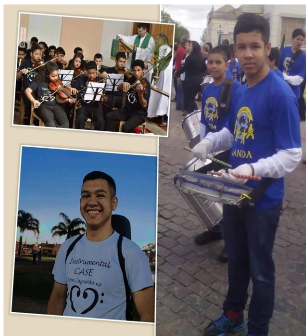
Figura 2: Instrumental Case