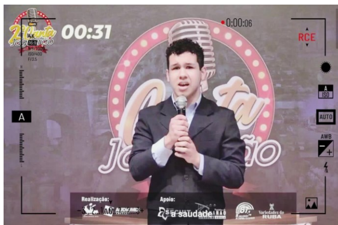
Figura 6: Canta Jaguarão