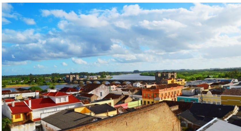
Figura 1: Cidade de Jaguarão

Grande do Sul. Percebe-se o destaque, neste cenário, para os refinados casarões elaborados nos últimos decênios do século XIX e princípios do século XX, período que demarca a fase áurea da construção civil local 1 .