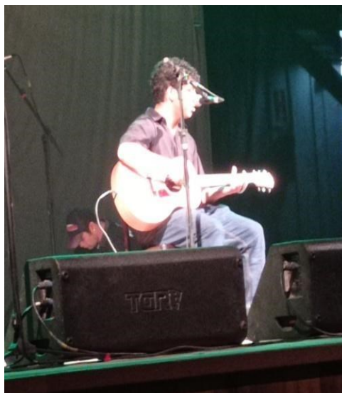
Figura 4: Jaguar Arte