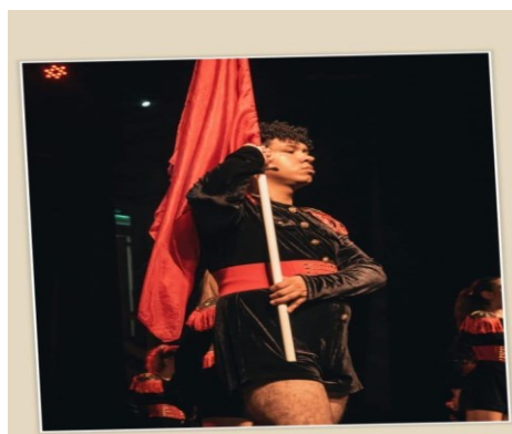
Figura 7: Quebra Nozes

Evento de Natal Quebra Nozes: Este evento de dança foi recriado pelo espaço da dança, evento que aconteceu no mês de dezembro, essa foi minha primeira experiência dançando em público na modalidade Jazz no qual foi um grande prazer fazer.