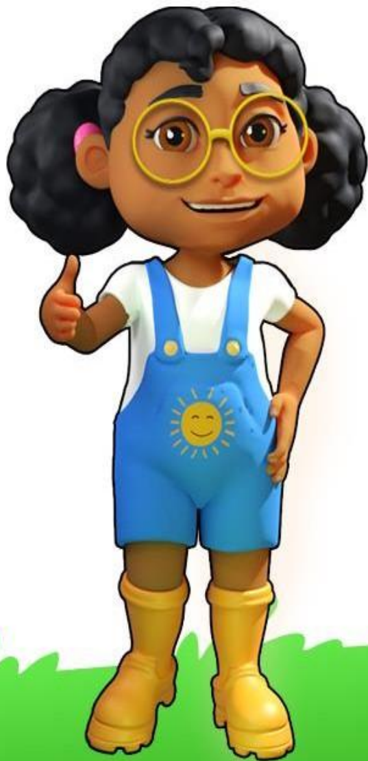
Ilustração: Daniel Castilho Aragão