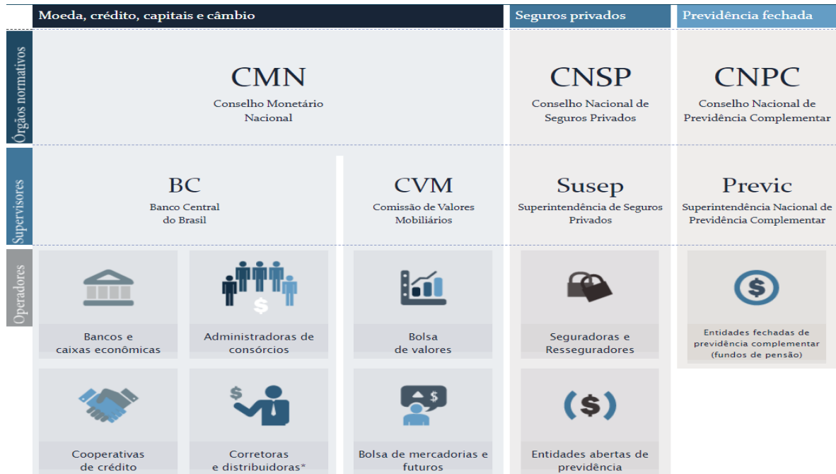
Figura 1: Estrutura do sistema financeiro nacional.

Abaixo, segue imagem explicativa sobre a estrutura do sistema financeiro nacional: