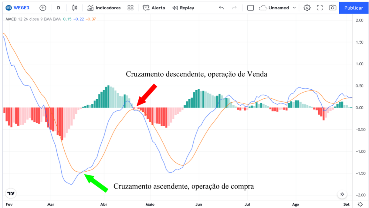
Figura 5: Indicador gráfico MACD