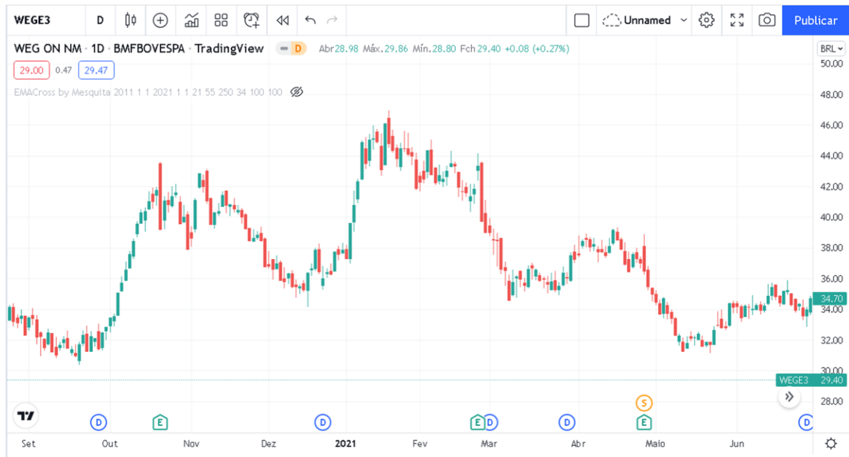
Figura 3: Exemplificação do padrão candlestick com a empresa Weg