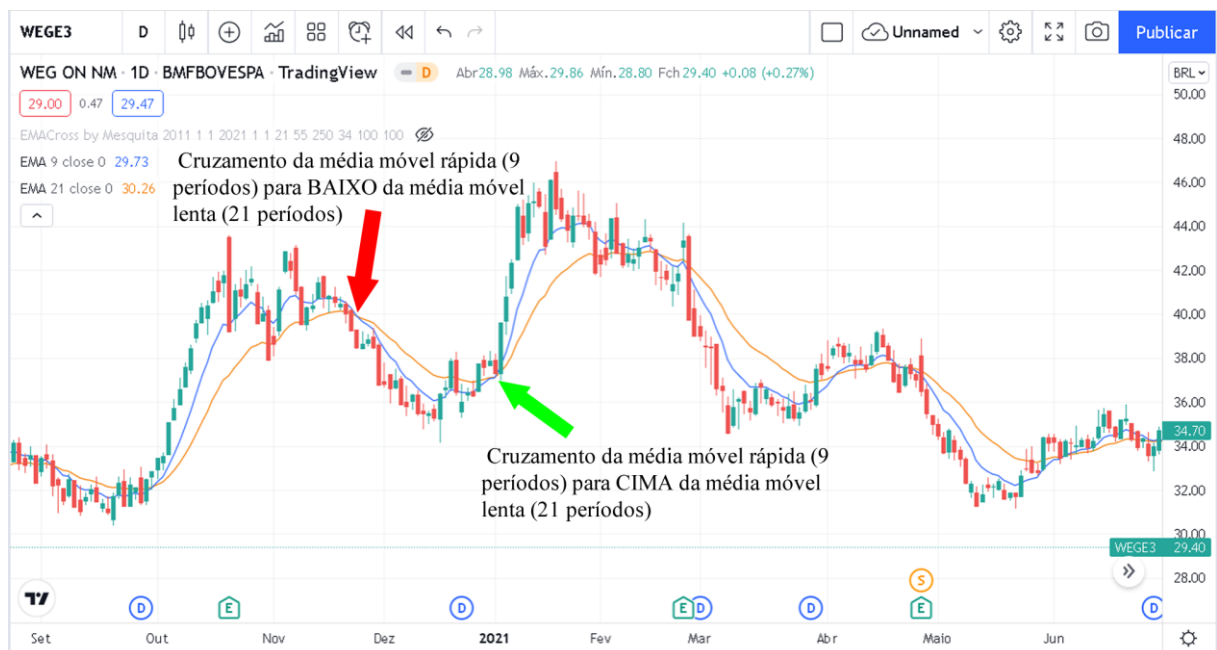
Figura 4: Gráfico de preços da Empresa Weg

A Figura 4 é representativa dos movimentos de uma ação, no caso da empresa WEG (WEGE3) listada em bolsa brasileira, com candles diários e médias de 9 (rápida, azul) e 21 (lenta, laranja) períodos, entre os dias 25/08/2020 e 29/06/2021: