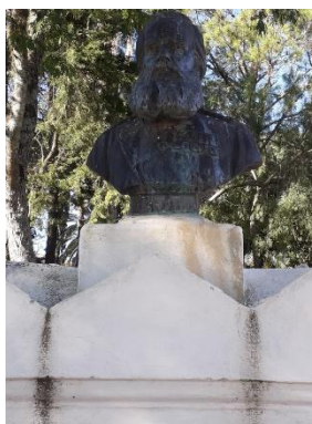
Figura 3 – Busto do imperador Dom Pedro II atualmente

Conforme a pesquisa do professor Lisandro Araújo 4 , em 1892, alguns cidadãos pediram para que fosse feito um monumento à memória do imperador Dom Pedro II na região central da praça. O busto do imperador permaneceu no local até 1940, depois foi “guardado” na prefeitura e na década de 1950 foi depositado em um pedestal menor em uma das extremidades da praça, entre as atuais ruas D. Pedro II e Dr. Dionísio de Magalhães: