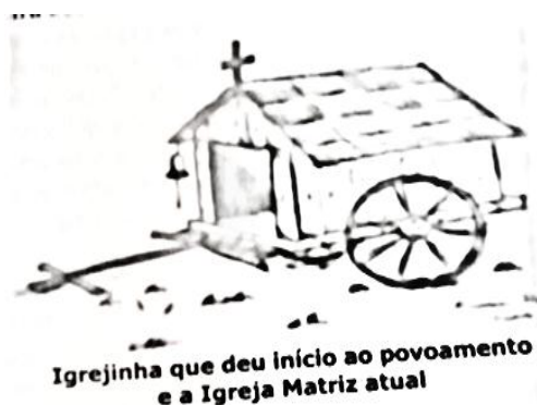
Figura 7 – Primeira Igreja construída com madeira