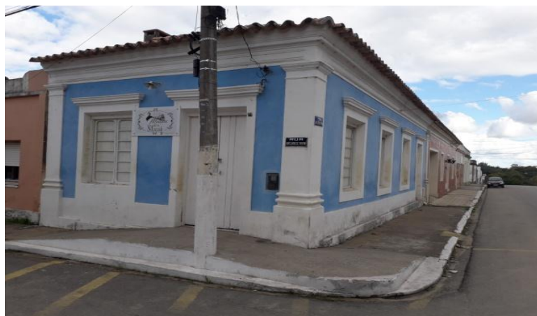
Figura 15 – Museu Barão de Mauá