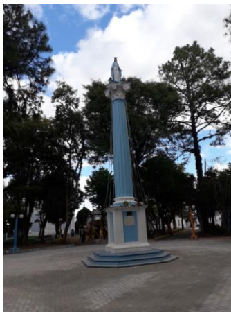
Figura 4 – Monumento à Nossa Senhora das Graças

Em 1958, foi colocado o monumento à Nossa Senhora das Graças, onde permanece até os dias de hoje: