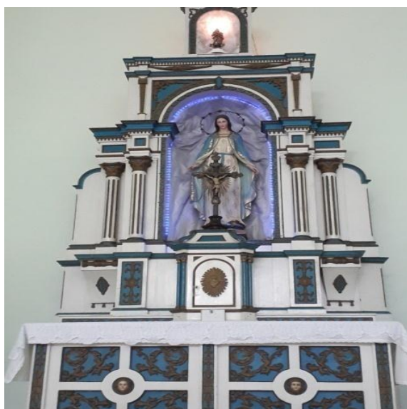
Figura 11 – Imagem de Nossa Senhora das Graças