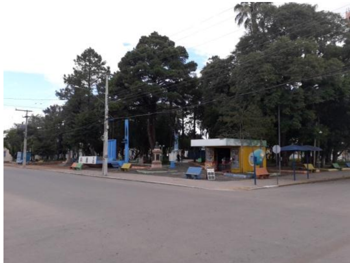
Figura 6 – Praça Maneca Maciel 2019