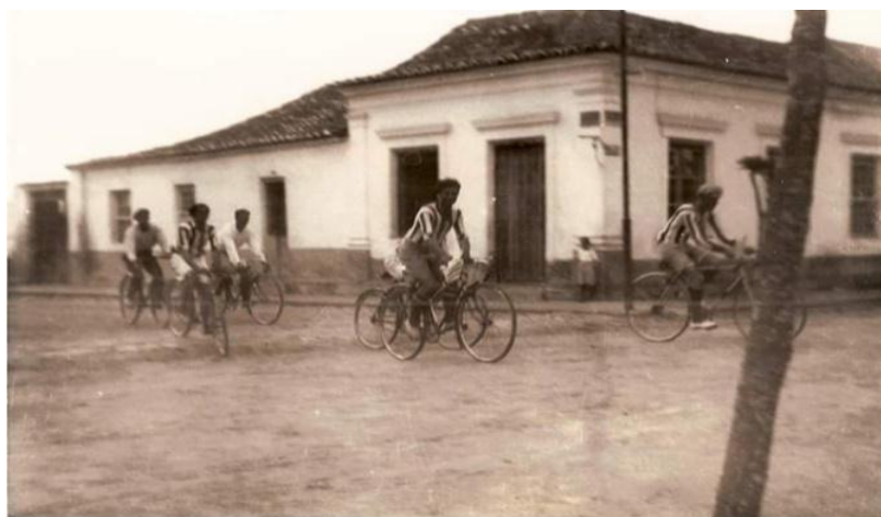
Figura 14 – Primeira Câmara Municipal de Arroio Grande, na década de 30