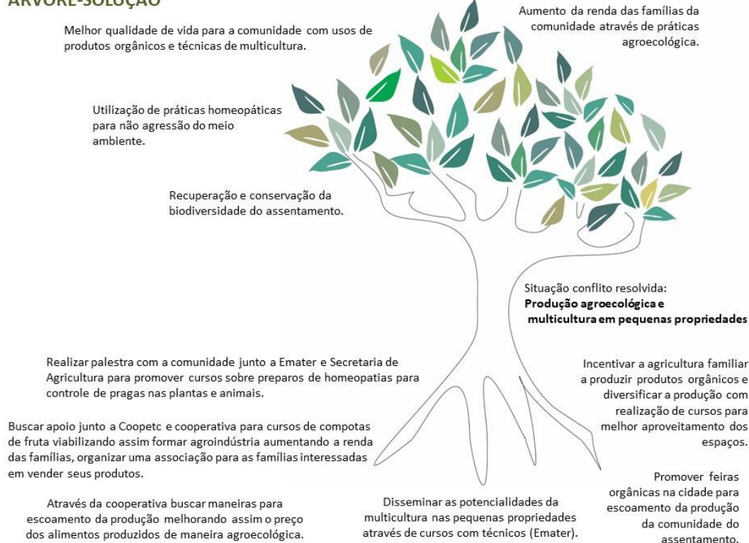
Figura 3 - Árvore- solução.

Conforme ilustrado nas figuras, a Metodologia das Árvores pode ser um caminho para o estudo de uma comunidade, feito pela própria comunidade, e para o dar-se-conta desse coletivo sobre determinado conflito e suas possíveis soluções, uma vez que essa Metodologia possibilita que se estudem os problemas de forma crítica para propor soluções que sejam pertinentes e possíveis de realizar.