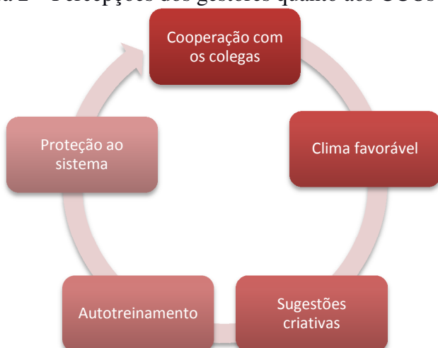
Figura 2 – Percepções dos gestores quanto aos CCOs predominantes