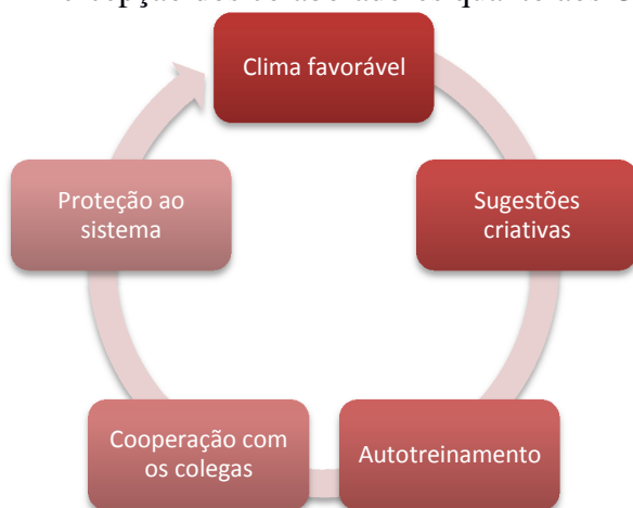
Figura 3 – Percepção dos colaboradores quanto aos CCOs predominantes

Por sua vez, na percepção geral dos colaboradores, os principais fatores predominantes que se destacaram foram o clima favorável e as sugestões criativas , conforme pode-se verificar na Figura 3.