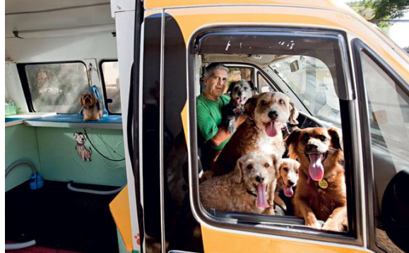
Figura 5 - Cachorros a Bordo

Cachorros a Bordo –Petshop Móvel, fundada em 1998 com um investimento inicial de R$ 100.000,00 e faturamento de R$ 15.000,00 por mês, oferece serviços de banho e tosa para cães a domicilio na cidade de São Paulo (TEIXEIRA, 2011).