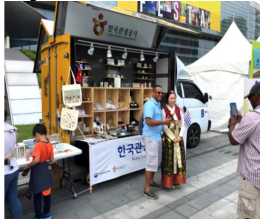
Figura2 - Truck Souvenir Seul

O veículo da figura 2 se encontra em Seul na Coréia do Sul, e foi uma ideia do governo em conjunto com o ministério da cultura, deram o nome de truck souvenir , o veículo pára nos pontos turísticos da cidade, e já deu ótimos resultados, pois é bem requisitado pelos turistas, segundo(JANG,2015).