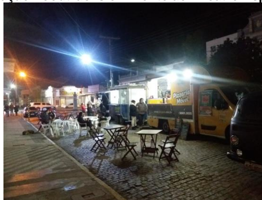
Figura 7- Praça de Alimentação Foodtrucks em frente ao Theatro Esperança de Jaguarão