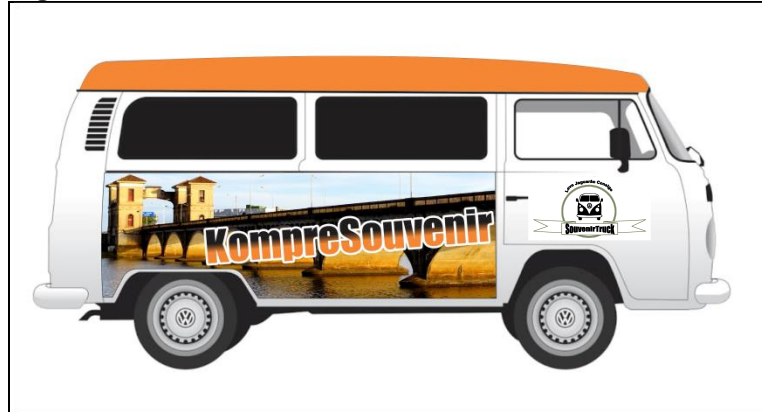
Figura 9 - Kombi Customizada SouvenirTruck

utilizar-se das imagens dos dois principais pontos turísticos da cidade de Jaguarão, a fim de que desta maneira também desperte o desejo dos turistas em conhecer tais lugares.