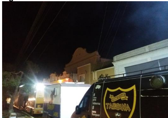
Figura 6- Foodtrucks No Theatro

Nas figuras a seguir, mostramos foodtrucks aproveitando o fluxo de turistas e autóctones devido a uma festividade que estava acontecendo no Theatro em Jaguarão, um exemplo do alcance pretendido pelo SouvenirTruck que estará visitando este local, que assim como os outros citados acima também apresentam um fluxo de turistas com potencial de compra.