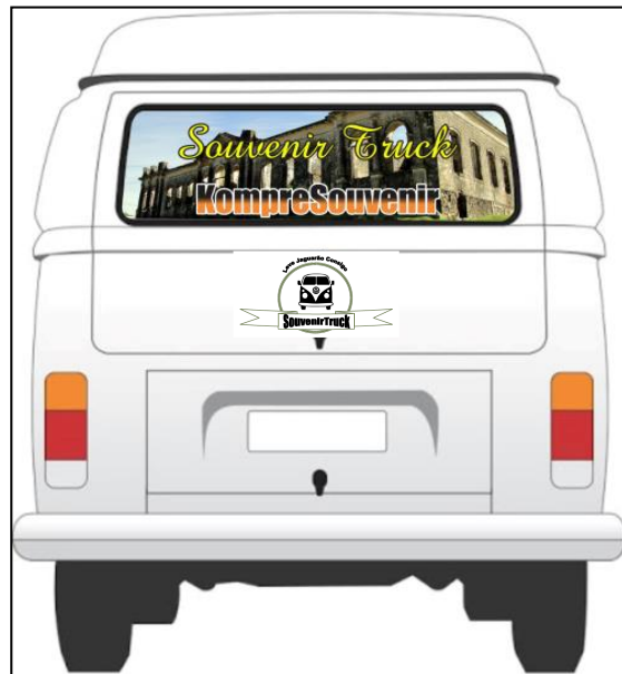
Figura 10 - Parte de traz da Kombi SouvenirTruck