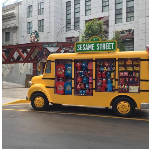
Figura 1 - Yellow Truck Universal Studio Cingapore