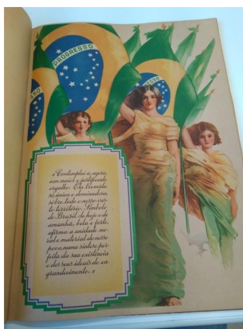
Figura 7 - página 6 da cartilha

A última categoria abrange todas as páginas da cartilha que trazem a presença de elementos relacionados à pátria e à civilidade. Pertencem a essa categoria as páginas de número 5, 6, 16 e 20. Destas, serão analisadas as páginas de número 6 e 16.