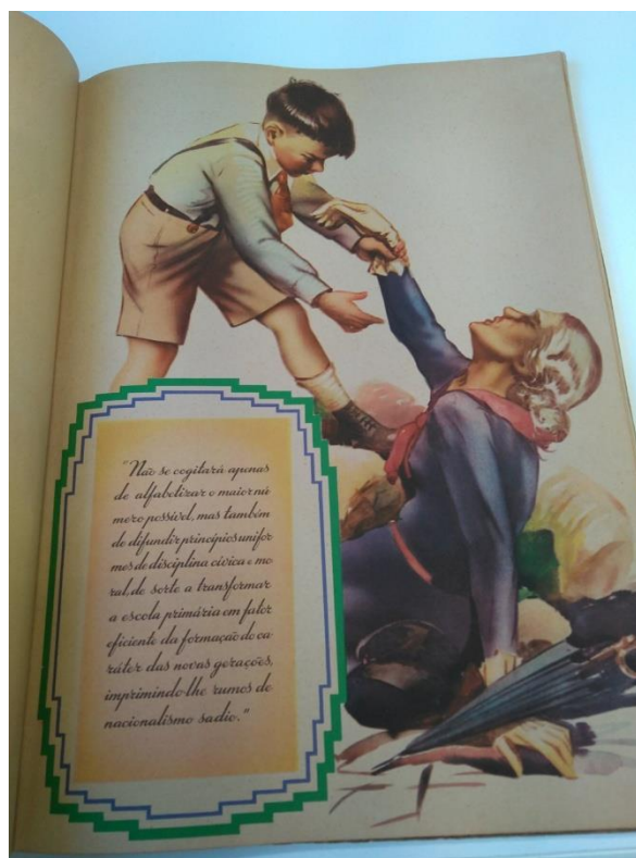
Figura 6 - página 8 da cartilha