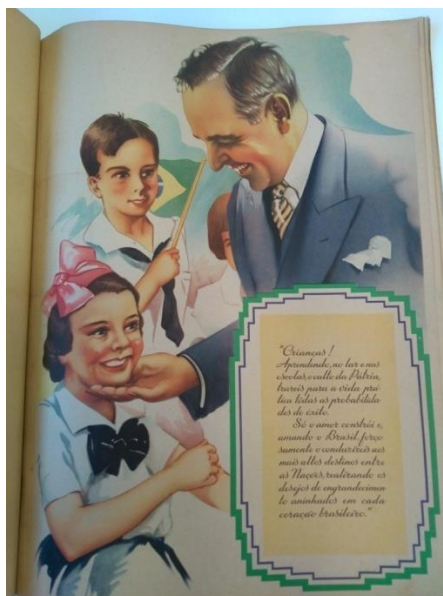
Figura 3 - página 11 da cartilha