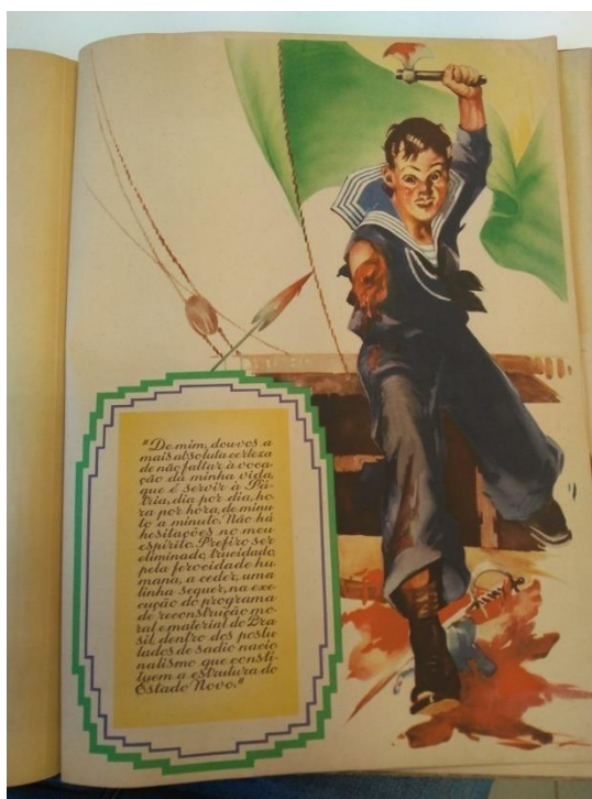
Figura 8 - página 16 da cartilha