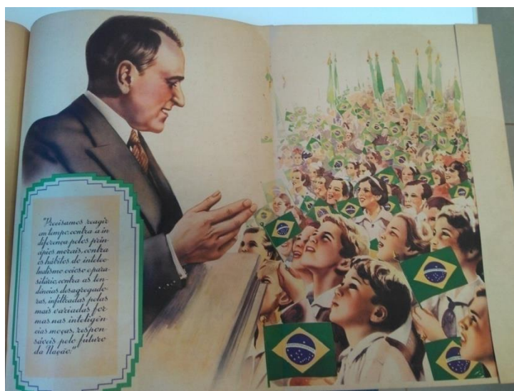
Figura 4 - página 12 da cartilha

Prosseguindo na categoria, a segunda página a ser analisada é a de número 12.