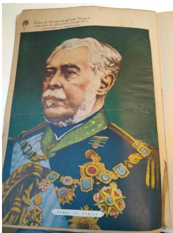
Figura 1 - imagem constitutiva das páginas 1 e 21 da cartilha

Esta categoria corresponde às páginas da cartilha que trazem, de algum modo, a representação de personagens históricos que podem ser considerados heróis da pátria. Engloba as páginas 3, 14, 15, 18 e 19; e as páginas 1 e 21 (que abrem e encerram o conteúdo da cartilha). Serão analisadas as páginas de número 1 e 21 e a página 3.