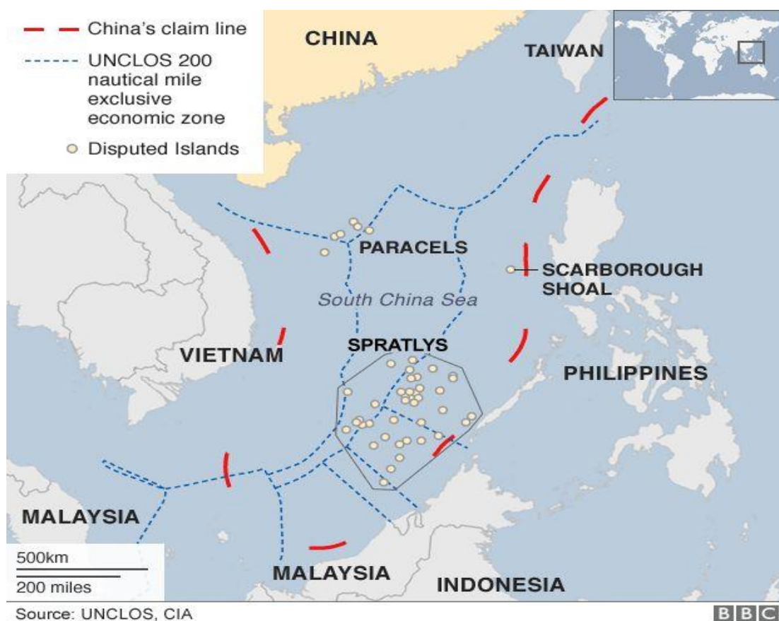
Figura 1 – Mapa das disputas do Mar do Sul da China

No mapa abaixo, podemos ver que os traços vermelhos representam a linha de “nove-traços”, e os traços azuis representam as duzentas milhas náuticas definidas pela UNCLOS em 1982. Ainda é possível identificar também nos pontos, as ilhas disputadas.