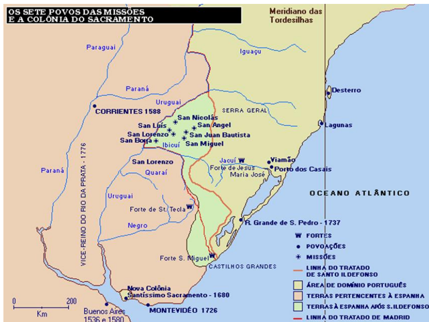
Figura 1 – Demarcações das fronteiras Brasil/Uruguai

O mapa abaixo ilustra esses diversos acordos e tratados entre as colônias espanhola e portuguesa, com as demarcações que foram mudando ao longo do tempo.