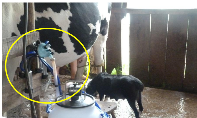
Figura 2- Acondicionamento dos equipamentos de ordenha

Quanto aos itens que referem-se à higiene de ordenha, observou-se que as propriedades atenderam a maioria dos itens, como frequência adequada de higienização, produtos utilizados para limpeza dos equipamentos, produtos utilizados seguidos do atendimento às normas dos fabricantes, porém quanto ao acondicionamento dos equipamentos e utensílios as propriedades não atenderam ao esperado (Figura 2).