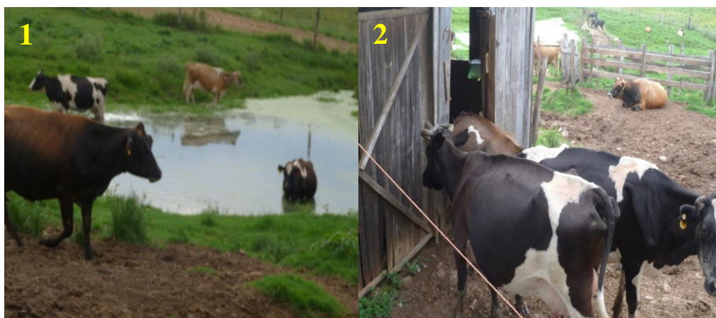
Figura 3 - Curral de espera dos animais antes da ordenha.

Outro fator que favorece a infecção dos animais e subsequente a queda de produtividade é o curral de espera dos animais antes da ordenha. Um ambiente limpo (1) e acomodação ideal para os animais (2) servem como alternativa de controle para a prevalência de mastite em rebanhos leiteiros (ANDREWS et al., 2008), sendo esses fatores observados nas propriedades e encontram-se desconformes, podendo servir de veículo para a infecção dos animais (Figura 3).