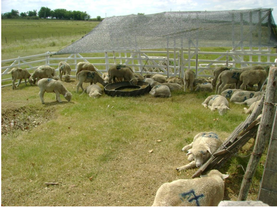
FIGURA 1 – Cordeiros Corriedale na fase de adaptação ao confinamento.