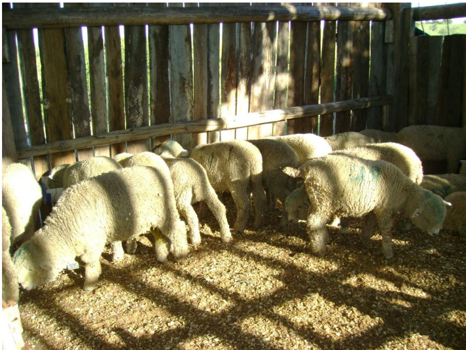
FIGURA 2 – Cordeiros Corriedale em confinamento.