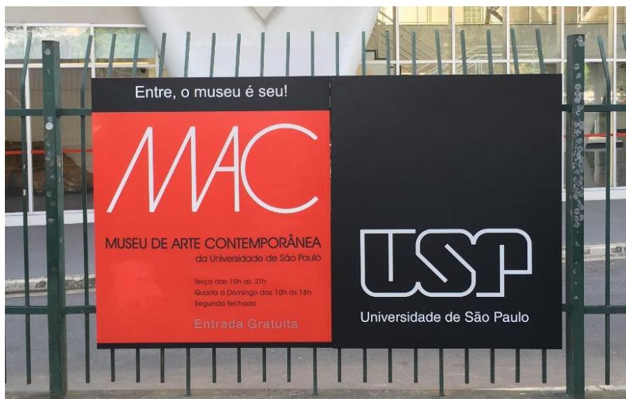
FIGURA 07 – Área de entrada do MAC USP.

Essas questões devem ser revistas, visando o acolhimento de um grande público. A mediadora 3 relata que, mesmo o museu sendo formal, tendo regras de não poder correr e se aproximar muito das obras, ele deve ser igualmente acolhedor. O mobiliário, conforme a mediadora também é uma grande carência do setor educativo. A mediadora descreveu que, os museus de ciências trabalham muito com modelos, réplicas e materiais de apoio, assim como alguns museus de história. Eles possuem um nível de discussão, o qual não se tem muitas vezes em um museu de arte. Por isso, não só o setor educativo mais também o de curadoria poderiam pensar novos recursos de contextualizar e discutir sobre uma obra.