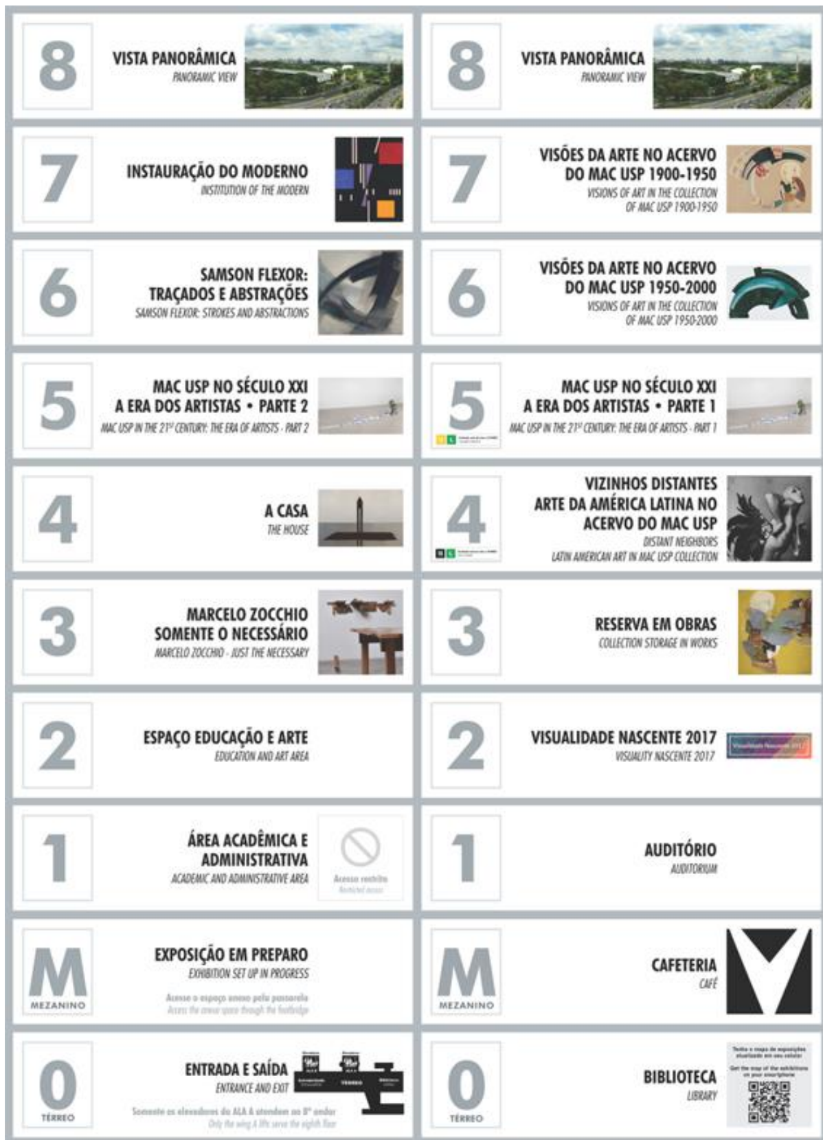
FIGURA 08 – Mapa das exposições