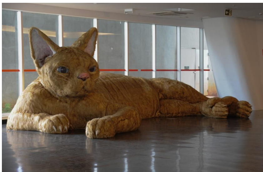
FIGURA 04 - Obra da artista contemporânea Nina Pandolfo.

Conforme o mediador 2, o MAC por ser um museu universitário, tem um grande potencial de contribuir no processo de formação escolar, seja da educação formal ou não. No campo de investigação de questões estéticas, de filosofia da arte e de outras disciplinas, o museu possui relevância fundamental no sistema educativo.