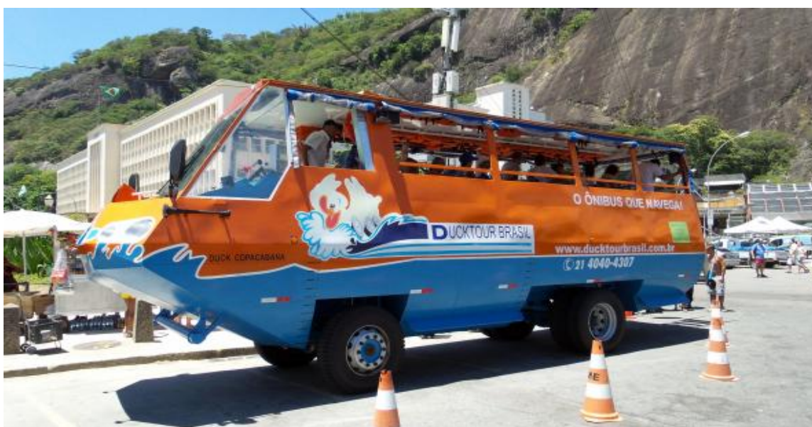
Figura 1 - Ônibus anfíbio em terra

Fonte: < https://inbustransportonibus.wordpress.com/tag/onibus-anfibio/ >. Acesso em 24 de abril de 2016