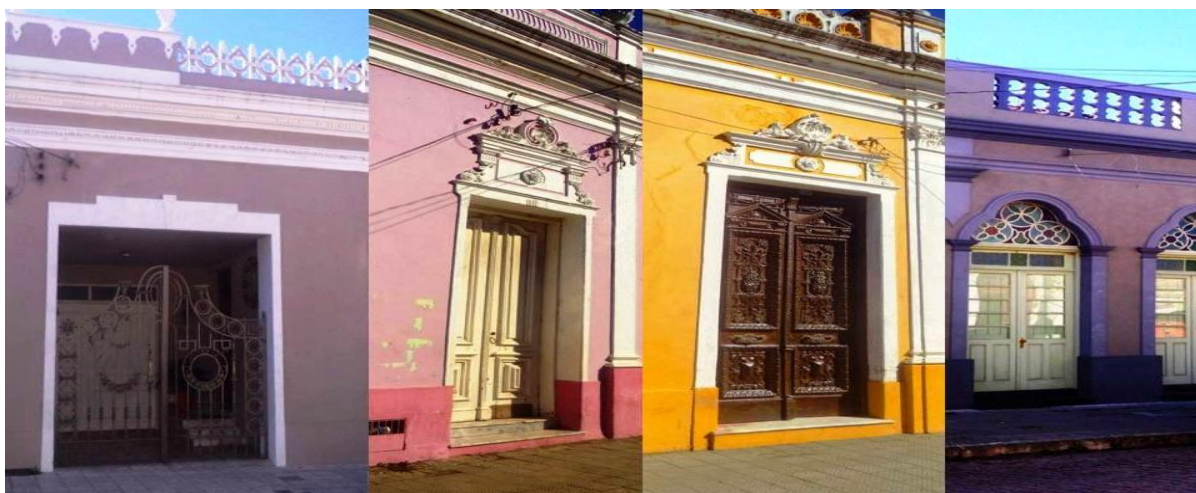
Figura 5 - Rua das Portas

Fonte: < http://guriestradeiro.blogspot.com.br/2014/07/jaguarao-rs-editando-textos.html >. Acesso 28 de maio de 2016