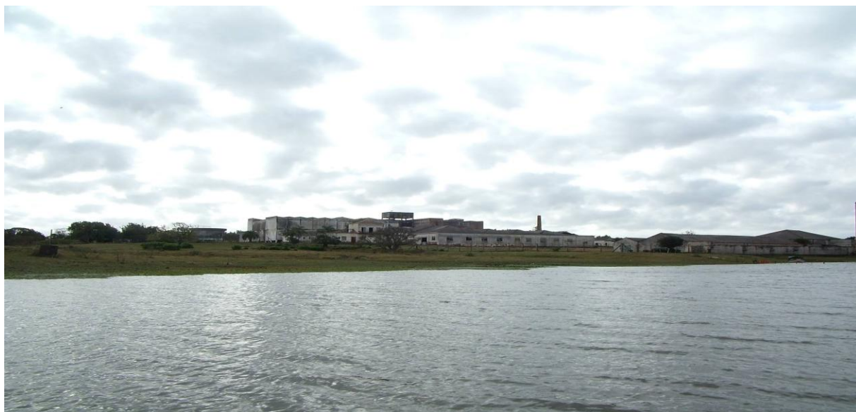
Figura 8 - Charqueadas