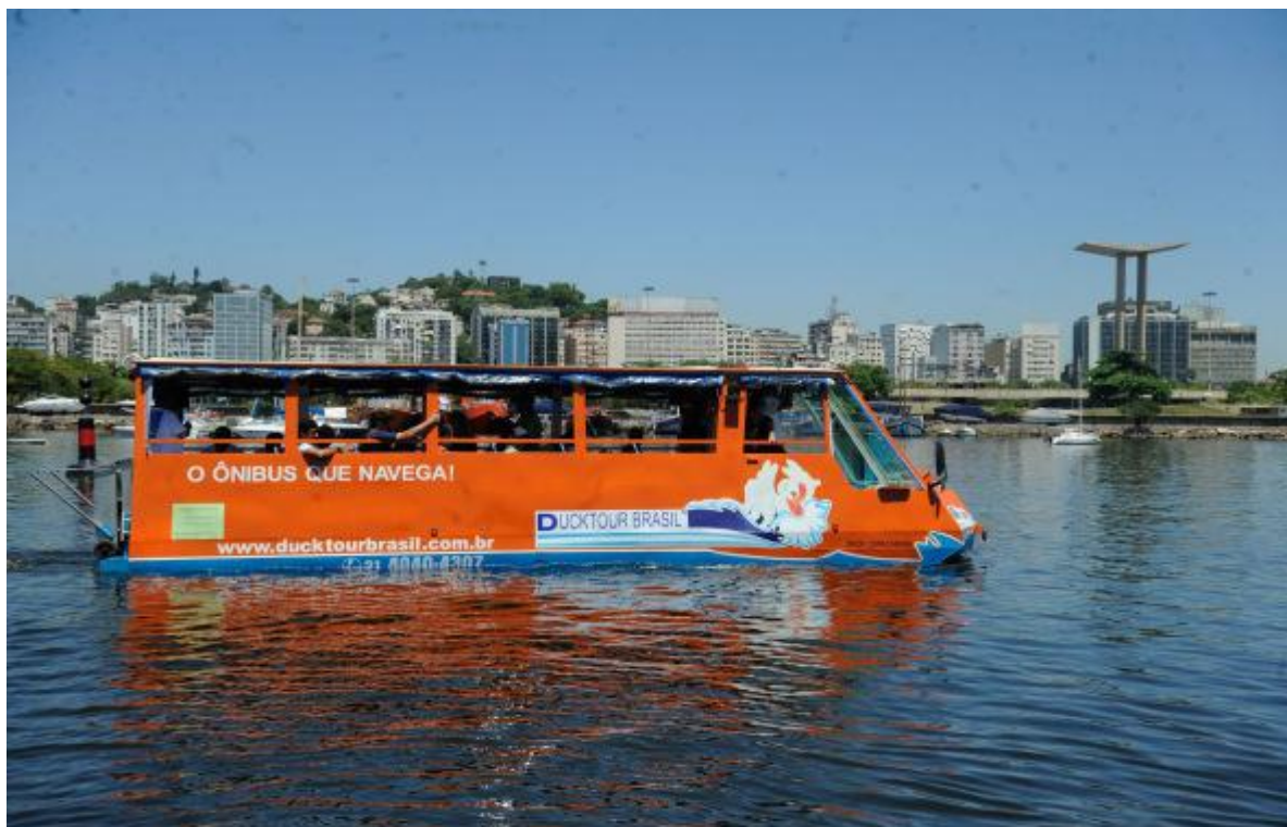
Figura 2 - Ônibus anfíbio na água