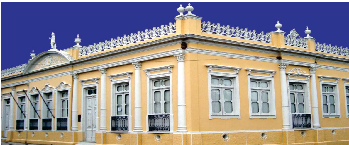
Figura 6 - Museu Dr. Carlos Barbosa

Fonte: < http://mcarlosbarbosa.blogspot.com.br >. Acesso em 28 de maio de 2016.