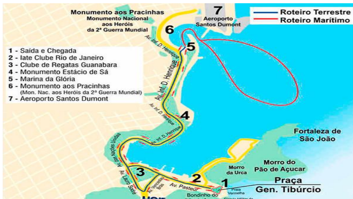
Figura 3 - Roteiro do passeio com ônibus anfíbio no Rio de Janeiro