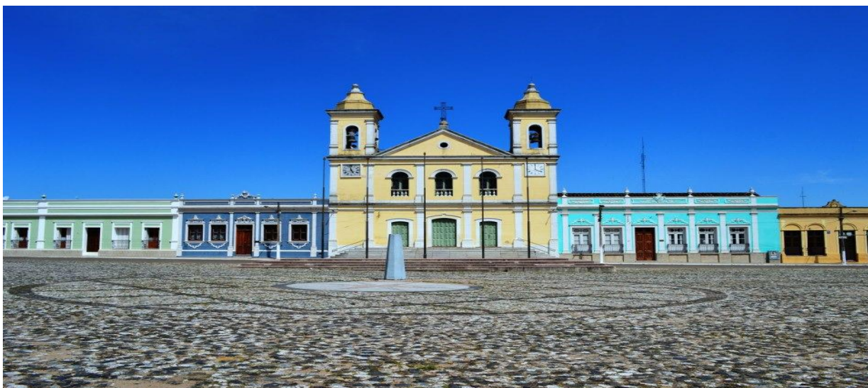
Figura 7 - Igreja Matriz do Divino Espírito Santo