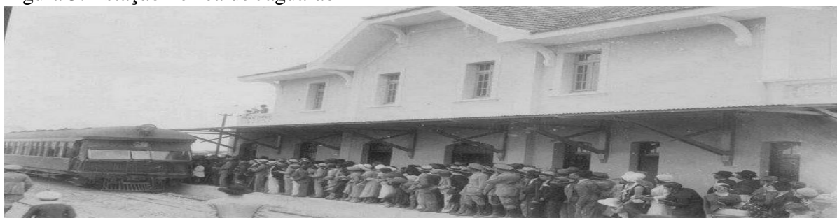
Figura 3: Estação Férrea de Jaguarão