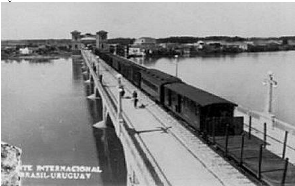
Figura 4: Ponte Internacional Barão de Mauá