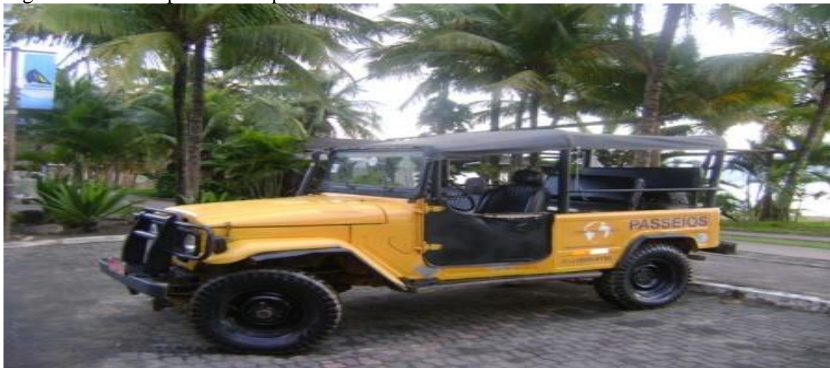
Figura 1: Veículo para o transporte