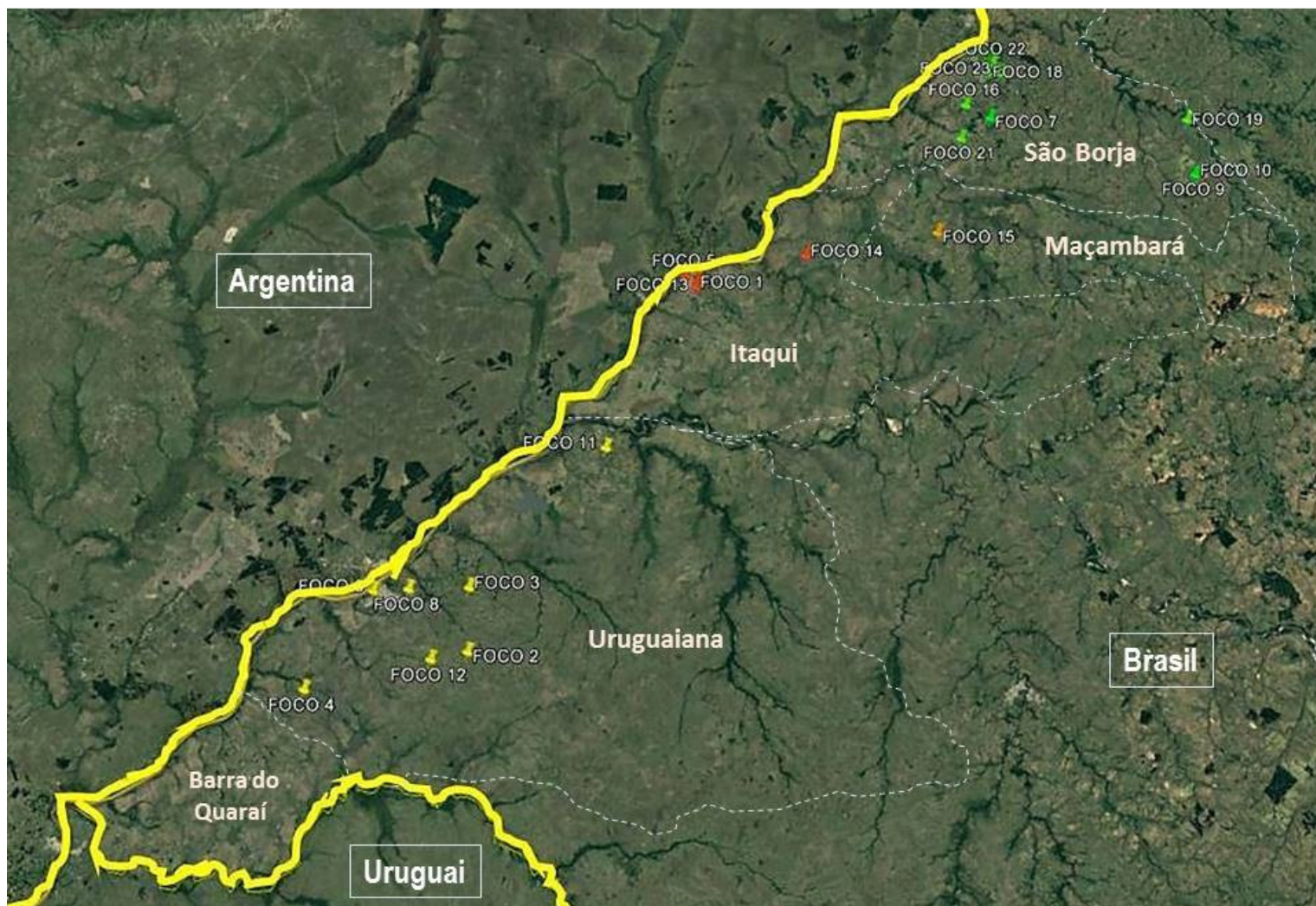
Figura 1 – Localização dos focos de anemia infecciosa equina diagnosticada nos municípios de Uruguaiana (amarelo), Itaqui (vermelho), Maçambará (laranja) e São Borja (verde) entre os anos de 2009 e 2015, fronteira Oeste do Rio Grande do Sul, Brasil.