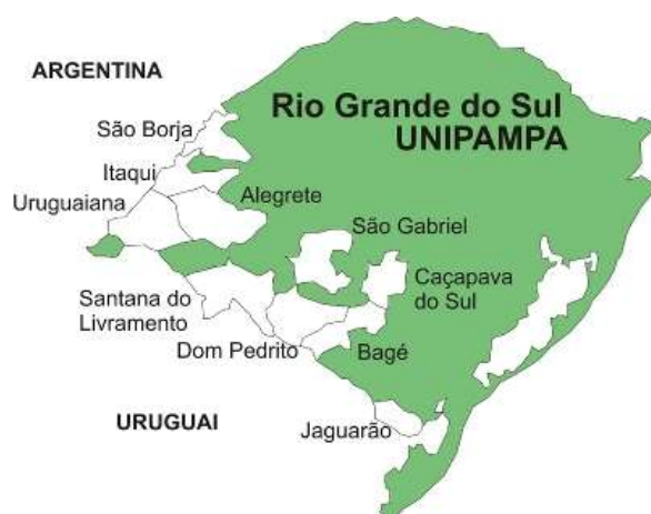
Figura 1: Distribuição dos Campi da UNIPAMPA pelo Rio Grande do Sul

Na figura 1 apresenta-se o mapa do Rio Grande do Sul com a localização dos 10 campi da UNIPAMPA.