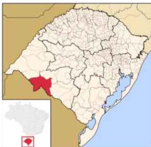
Figura 2: Localização Geográfica de Santana do Livramento

situa-se na fronteira Brasil/Uruguai (Figura 2). O município tem como limites geográficos, as cidades de Rosário do Sul, ao norte; Bagé e Dom Pedrito, a leste; Quaraí, a oeste; e ao sul, em divisa seca (uma rua urbana) a cidade de Rivera, capital do Departamento de Rivera, da República Oriental do Uruguai.