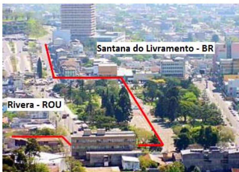
Figura 3: Foto panorâmica das cidades de Rivera e Santana do Livramento

Segundo dados do Instituto Nacional de Estadística del Uruguay – INE (2011), Rivera possui uma população de 103.447 habitantes, enquanto que Santana do Livramento, segundo dados do IBGE (2010), possui 82.464 habitantes, totalizando um grupamento populacional de 185.911 habitantes, podendo ser considerado uma das 12 maiores cidades do estado do Rio Grande do Sul e entre as 3 maiores do Uruguai. As figura 3 e 4 demonstram este agrupamento.