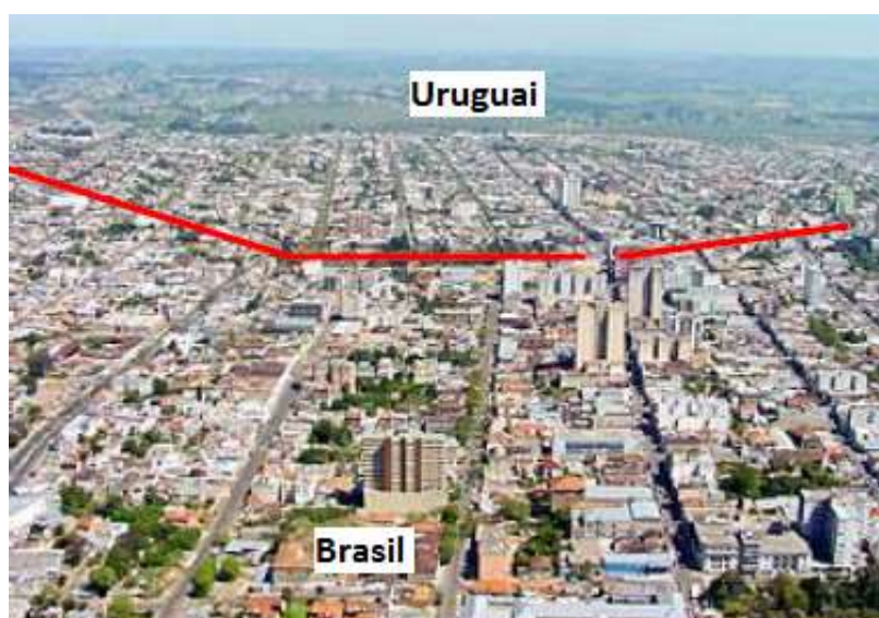
Figura 4: Foto aérea das cidades de Rivera-ROU e Santana do Livramento-BR Fonte: Badra apud Meirelles (2006, p. 5)

A UNIPAMPA, em Santana do Livramento, está sediada em um prédio próprio, situado à Rua Barão do Triunfo, nº 1048, com uma área construída de 5.497,00 m 2 , em um terreno de superfície de 5.529,17 m 2 . O prédio conta com 15 salas de aula, 01 auditório com capacidade para 320 pessoas, 02 laboratórios de informática, 19 salas de professores, 01 biblioteca e espaços para os setores administrativos e de convivência. Conta ainda, com um ginásio de esportes com área construída de 1.283,40m 2 . Atualmente o Campus Livramento está em expansão, tendo para o primeiro semestre letivo de 2014 o espaço chamado “Maristinha” reformado e com disponibilidade para alocar laboratório e salas de aula. Também está sendo construído um novo prédio anexo que irá oferecer espaço para salas de aula, biblioteca, anfiteatro e cantina.