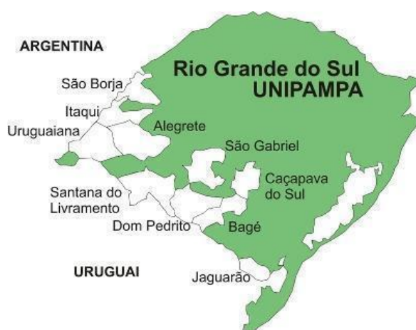
Figura 1: Distribuição dos Campi da UNIPAMPA pelo Rio Grande do Sul

Na figura 1 apresenta-se o mapa do Rio Grande do Sul com a localização dos 10 campi da UNIPAMPA.