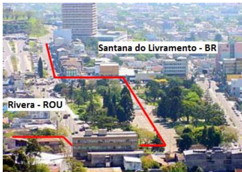
Figura 3: Foto panorâmica das cidades de Rivera e Santana do Livramento

Segundo dados do Instituto Nacional de Estadística del Uruguay – INE (2011), Rivera possui uma população de 103.447 habitantes, enquanto que Santana do Livramento, segundo dados estimados do IBGE (2020), possui 76.321 habitantes, totalizando um grupamento populacional de 185.911 habitantes, podendo ser considerado uma das 12 maiores cidades do estado do Rio Grande do Sul e entre as 3 maiores do Uruguai. As figuras 3 e 4 demonstram este agrupamento.