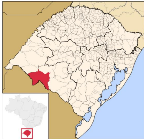
Figura 2: Localização Geográfica de Santana do Livramento

rua urbana) a cidade de Rivera, capital do Departamento de Rivera, da República Oriental do Uruguai.