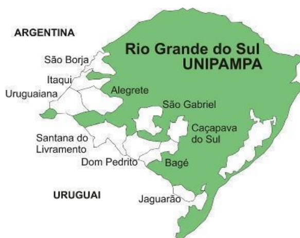
Figura 1: Distribuição dos Campi da UNIPAMPA pelo Rio Grande do Sul