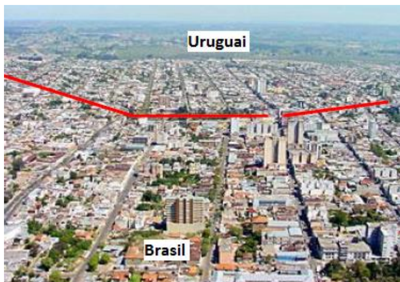
Figura 4: Foto aérea das cidades de Rivera-ROU e Santana do Livramento-BR