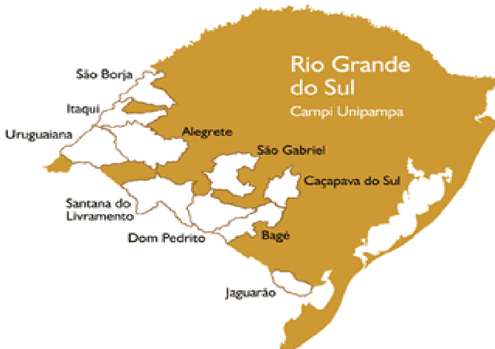
Figura 1: Localização dos municípios sedes dos campi da universidade.

Foram criados grupos de trabalho, grupos assessores, comitês ou comissões para tratar de temas relevantes para a constituição da nova universidade. Entre eles estão as políticas de ensino, de pesquisa, de extensão, de assistência estudantil, de planejamento e avaliação, o plano de desenvolvimento institucional, o desenvolvimento de pessoal, as obras, as normas acadêmicas, a matriz para a distribuição de recursos, as matrizes de alocação de vagas de pessoal docente e técnico-administrativo em educação, os concursos públicos e os programas de bolsas. Em todos esses grupos foi contemplada a participação de representantes dos dez campi.