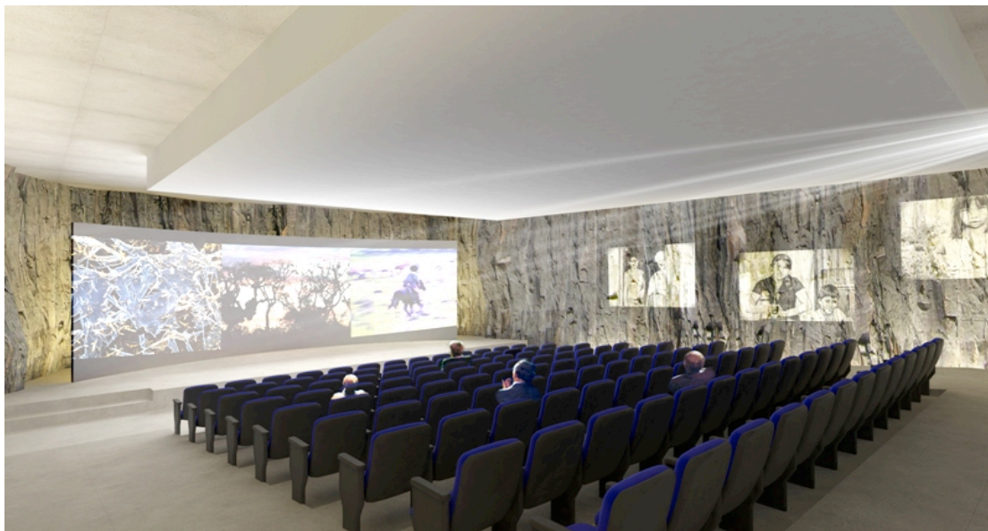
Figura 9: Representação ilustrativa do projeto do Centro de Interpretação do Pampa.