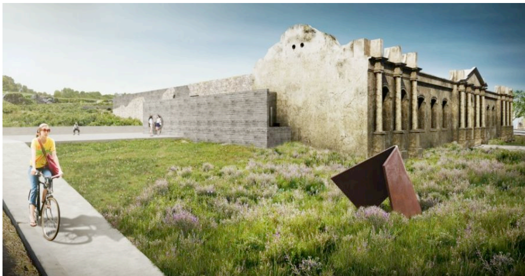
Figura 6: Representação ilustrativa do projeto do CIP.