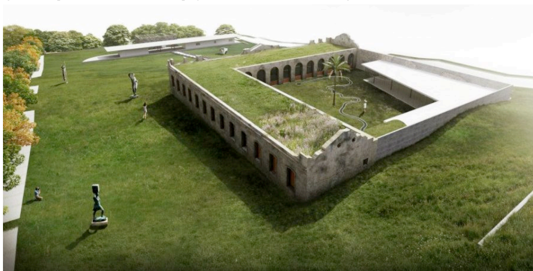
Figura 8: Representação ilustrativa do projeto do CIP.