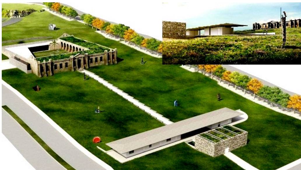
Figura 4: Representação ilustrativa do projeto do Centro de Interpretação do Pampa.