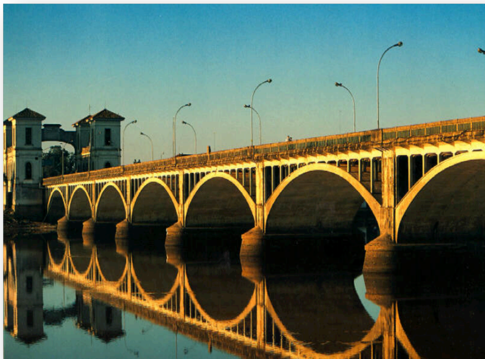
Figura 3: Ponte Internacional Mauá. O limite entre a cidade uruguaia de Rio Branco se dá pela Ponte Internacional Mauá – Patrimônio Binacional.

O caráter de proximidade com o Uruguai fomenta intercâmbios com a cultura latino-americana para o Brasil de forma única e próxima, potencializando atividades que ocorrem em formato de “corredor cultural”, entre o eixo Montevideu – Porto Alegre. Por estar situado na fronteira, o município tem estreita integração cultural com o país vizinho, através de acordos na área da cultura e práticas de intercâmbio como a Feira do Livro Binacional, Mostra de Documentários Uruguaios, grande participação de Uruguaios no carnaval brasileiro. Circulam outras manifestações culturais como a Murga Uruguaia, o Candombe, a literatura, diversos gêneros musicais incluindo o Tango, Patrimônio Imaterial do Uruguai, reconhecido pela Unesco de forma compartilhada com a Argentina. Uma mostra de como a fronteira é um espaço rico em trocas, de caráter aberto ao outro que extrapola o fazer artístico que se encerra na cultura local, ou no culto às tradições.