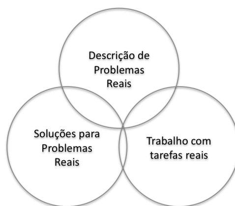
Figura 4 – Relação de ABP com problemas reais.

Uma das considerações mais interessantes ao se trabalhar o ensino de engenharia de software usando a metodologia de ABP é a proximidade com as situações vivenciadas no mercado de trabalho (Figura 4). O desenvolvimento de sistemas de informação reais é uma tarefa complexa, na qual as atividades de construção de software e levantamento de requisitos estão entremeadas: como os requisitos mudam ao longo do ciclo de desenvolvimento, não existe uma divisão clara entre as atividades de construção e levantamento de requisitos. Desta forma, o conhecimento técnico e as habilidades relacionadas a seres humanos devem ser vivenciadas em conjunto, permitindo que problemas observados em um aspecto ampliem o efeito do outro, exigindo a tomada de decisão com informação incompleta e a cuidadosa avaliação das premissas a partir das quais o desenvolvimento será conduzido (OLIVEIRA BARROS; ARAUJO, 2008; CUNHA et al., 2008).