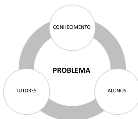
Figura 3 – Elementos envolvidos em ABP.

A Figura 3 mostra os principais elementos envolvidos no ABP. O problema a ser definido é o gatilho para o processo de aprendizado. O conhecimento representa o que é necessário saber para encontrar uma solução viável para o problema. O tutor orienta os alunos a buscar o conhecimento necessário para propor a solução.