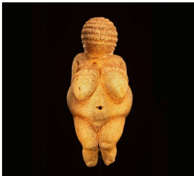
Figura 2 - Vênus de Willendorf

A compreensão do uso da arte como instrumento pedagógico e simbólico pelos jesuítas no Brasil colonial pode ser enriquecida quando observada à luz da função da arte nas primeiras sociedades humanas. Um exemplo marcante é a Vênus de Willendorf, estatueta esculpida há aproximadamente 30 mil anos, descoberta na Áustria, que representa uma figura feminina com traços exagerados associados à fertilidade e à proteção da vida (Figura 2). Essa peça pré-histórica ilustra como a arte, desde os primórdios, era usada não apenas como ornamento, mas como representação simbólica de crenças, valores e espiritualidade. De forma semelhante, os jesuítas compreenderam o poder da imagem como linguagem universal e lançaram mão de representações visuais e performáticas para comunicar os preceitos do cristianismo aos povos indígenas.