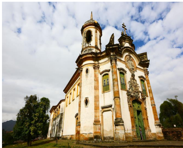
Figura 3 - Igreja de São Francisco de Assis em Ouro Preto

O trabalho de Aleijadinho é um testemunho do projeto pedagógico dos colonizadores, que por meio da arte buscavam educar visualmente a população — especialmente os fiéis analfabetos — transmitindo os valores do catolicismo e moldando condutas sociais. Assim, a arte sacra do período colonial, materializada em obras como essa, integrava os espaços escolares e religiosos como uma linguagem visual complementar ao ensino formal, promovendo uma formação integral que unia fé, estética e moral.