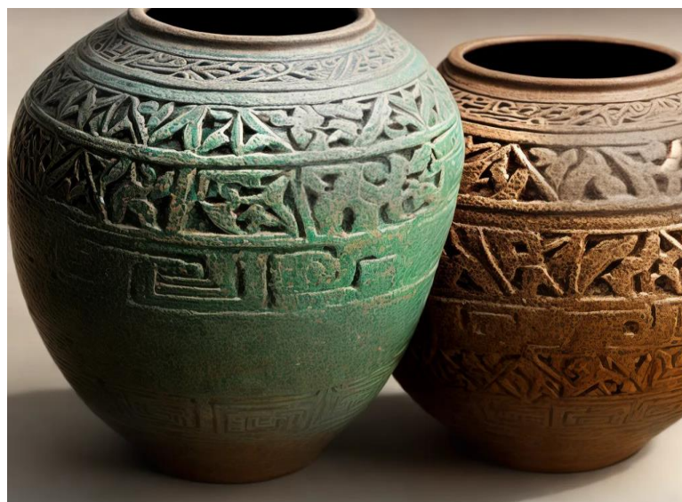
Figura 1 - Cerâmica marajoara

As artes em cerâmica desenvolvidas pelos povos originários do Brasil, como os marajoaras, representam não apenas um refinamento técnico e estético, mas também um importante meio de expressão simbólica, espiritual e social. A cerâmica indígena era muito mais do que utilitária: era profundamente carregada de significados e contextos ritualísticos. A imagem apresentada — de vasos com formas globulares, adornados com grafismos geométricos e entalhes em relevo — remete visualmente ao legado das tradições ceramistas ameríndias, especialmente à arte marajoara, que se destaca pela complexidade das composições e pelo domínio técnico do modelado e da pintura.