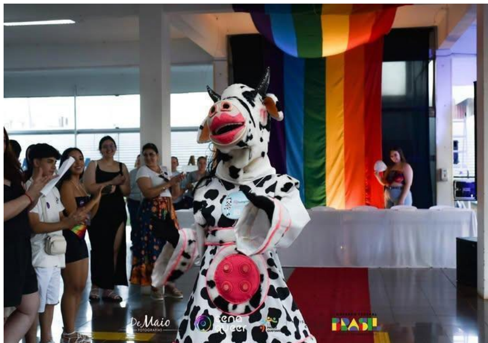
Mascote do projeto, no evento “Cena Queer”. Imagem por: Página Cena Queer e Jonathan de Maio. Instagram, 2024.

Algumas divulgações no Instagram do Tina Cultural: