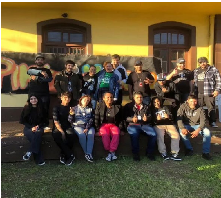
Arte produzida pela professora de artes Carolina Pinheiro e seus alunos. Foto por: Carolina Pinheiro (2023).

A arte e a cultura popular ocupam um espaço central na vida de Carolina Pinheiro, tanto como professora quanto como participante ativa das manifestações culturais de