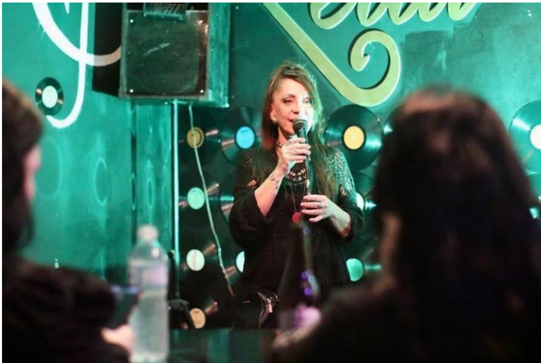
Imagem por: Silvana Pinheiro. Instagram, 2024.

Eu não consigo imaginar a vida sem a arte. Mesmo que você não seja um artista, em algum momento você precisa da música, da dança, do entretenimento. Mas como estão essas pessoas que nos trazem essa alegria? Como estão vivendo? O que estamos oferecendo em troca? A arte nos torna humanos (Silvana Pinheiro, 2024).