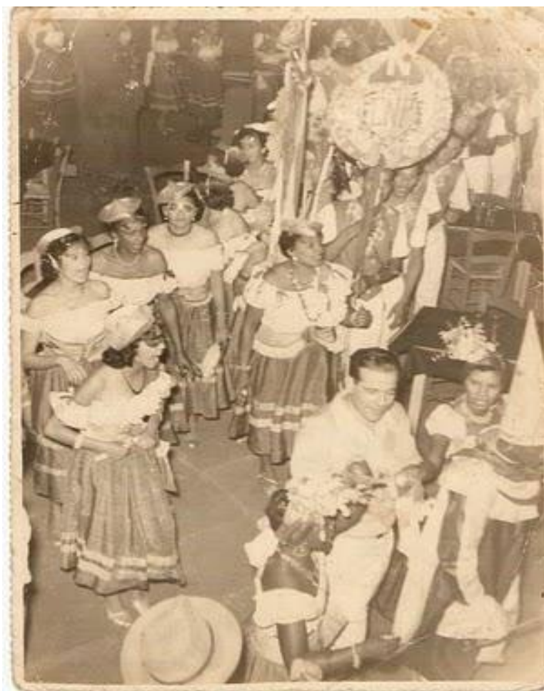
Presidente João Goulart (1961-1964) em um baile do Bloco Comigo Ninguém Pode na década de 1950