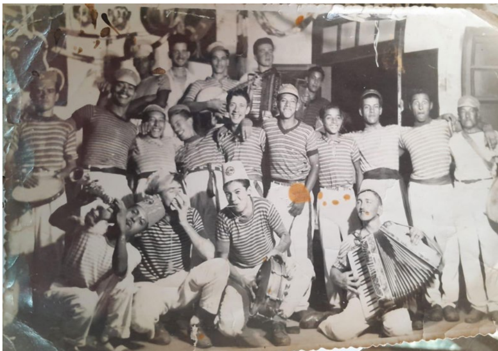
Músicos do “Comigo Ninguém Pode”.