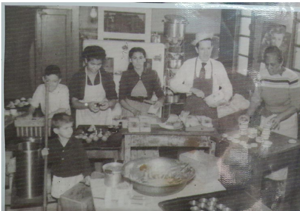
Cozinha do bar.