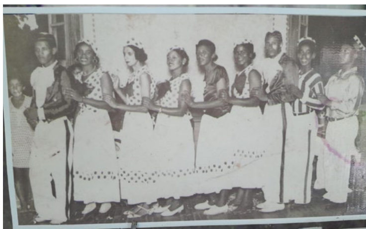
Bloco “Comigo ninguém pode”.

Suas trajetórias, marcadas por desafios e superações, refletem não apenas a luta contra a discriminação racial, mas também a força e a resiliência das mulheres negras em um contexto histórico adverso.