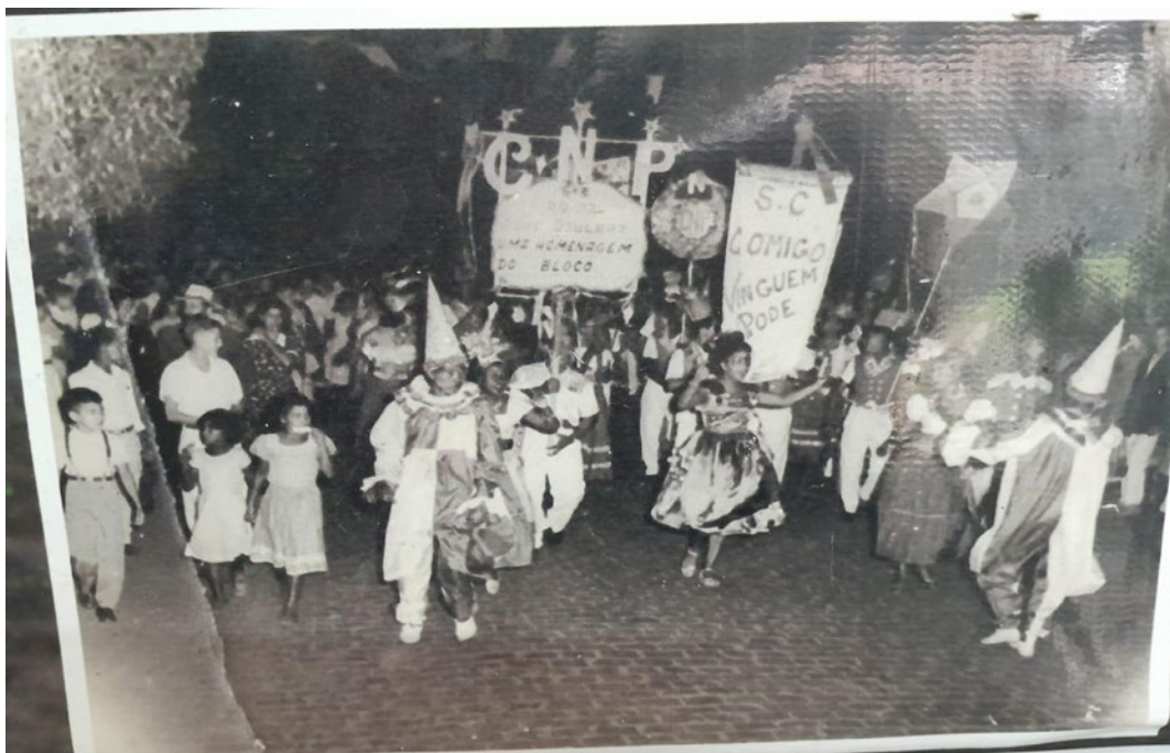
Bloco “Comigo Ninguém Pode” em noite de carnaval.