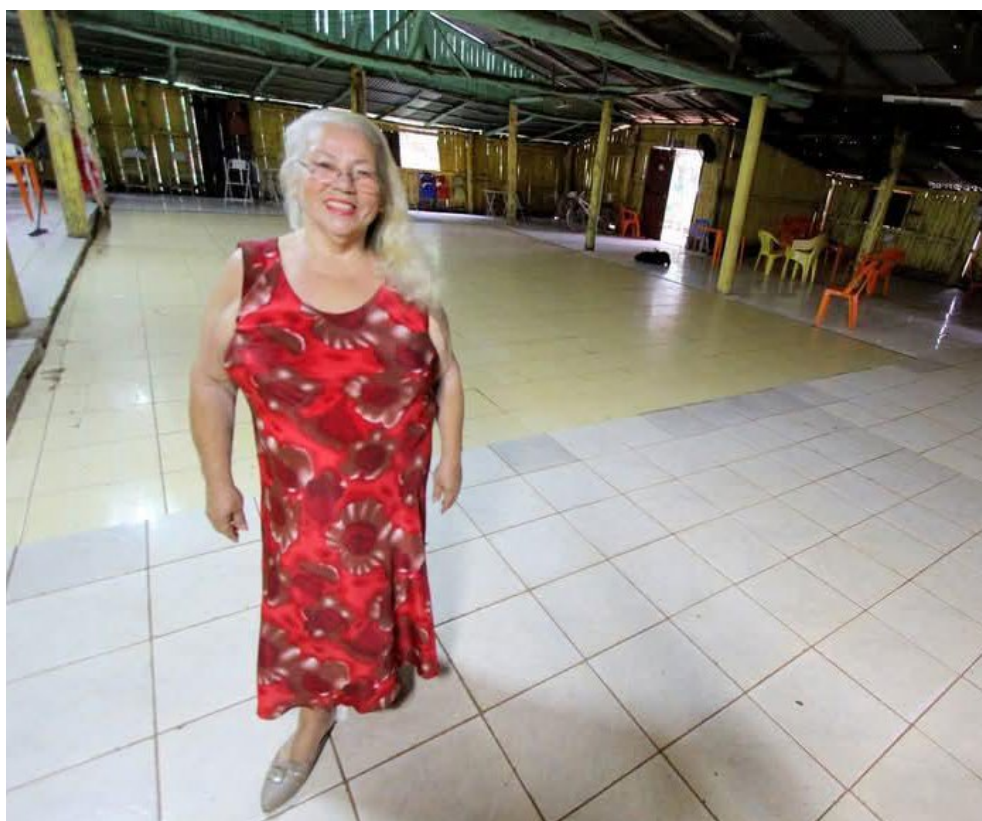
Uma personagem histórica em São Borja: TIA RAMONA.