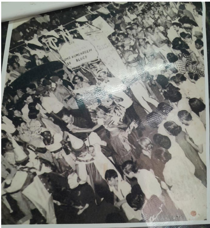
Presidente João Goulart (1961-1964) no Carnaval do Bloco “Comigo ninguém pode”.