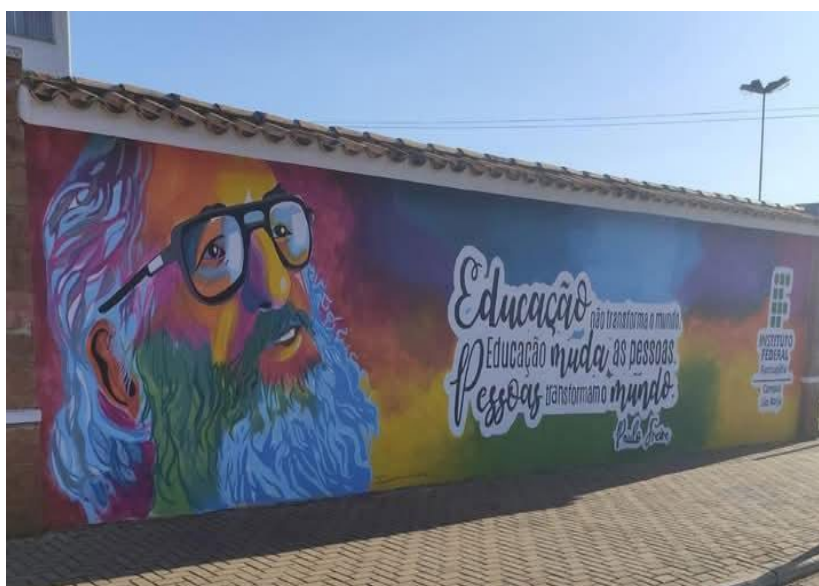
Atividade (Pinta Muro), realizada pelos alunos de artes.