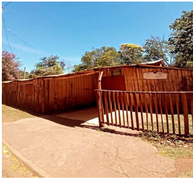
BAILÃO DA TIA RAMONA / PIQUETE DO SALSO.

Fotos pela página: São Borja de outros tempos