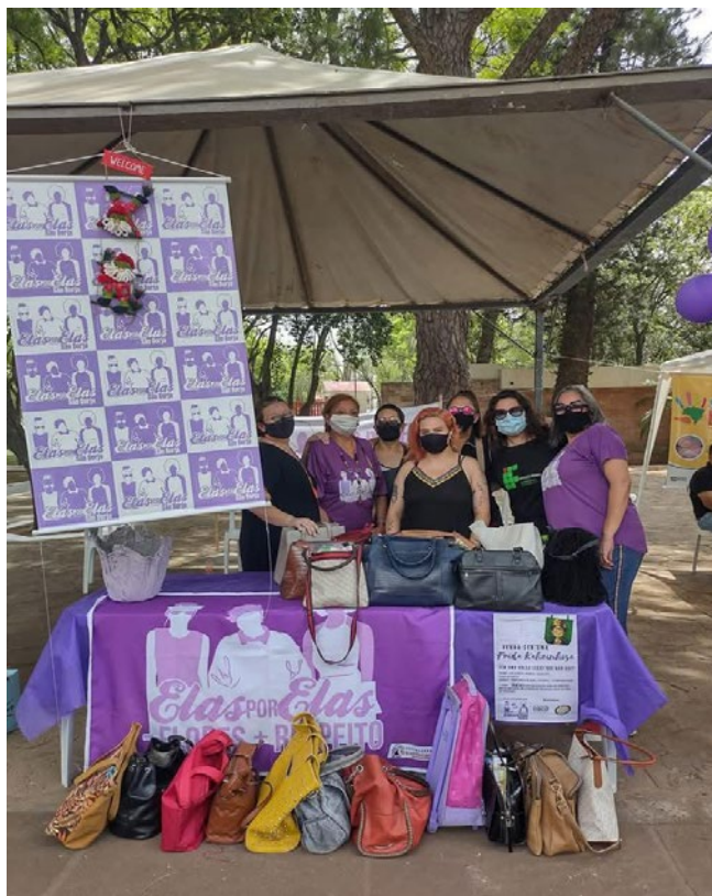
Projeto Mulheres Mil em Ação.