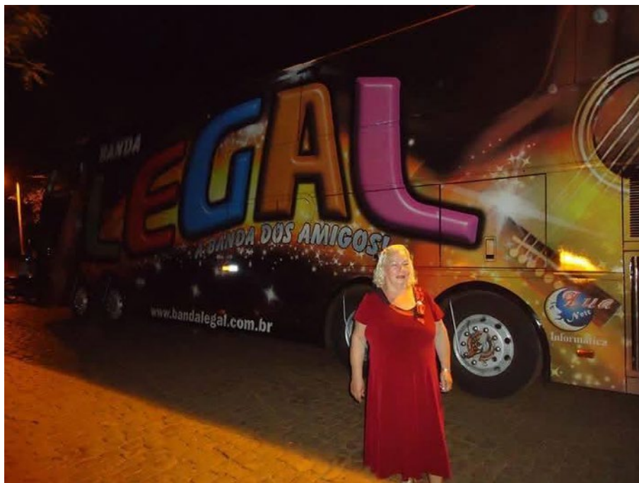
Atração do Baile da Tia Ramona, (2018).

Os frequentadores do Bailão não eram apenas turistas ou dançarinos ocasionais; eram vizinhos, conhecidos, e, em muitos casos, amigos de longa data. O ambiente que Tia Ramona cultivava era impregnado de calor humano. Ao cruzar a porta do Bailão, as preocupações do dia a dia eram deixadas de lado, e todos se engajavam em um ritual de celebração, no qual a simplicidade da vida se tornava a verdadeira protagonista.