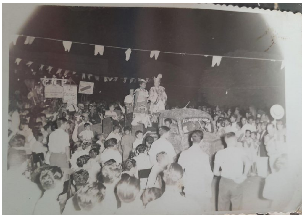
Bloco “Comigo Ninguém Pode” em uma noite de Folia.

E então tocaram talvez um ‘Abre-Alas’, de Chiquinha Gonzaga, ‘Ô Abre-Alas que eu quero passar’ (Clemar Dias, 2024).