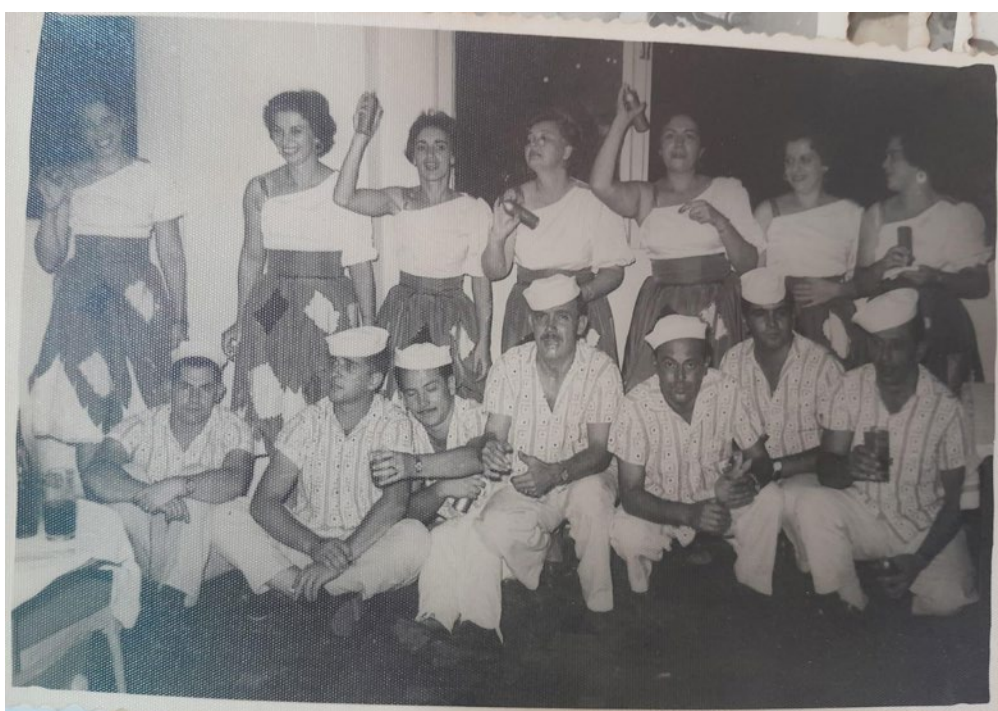
Músicos do “Comigo Ninguém Pode” em uma noite carnavalesca.