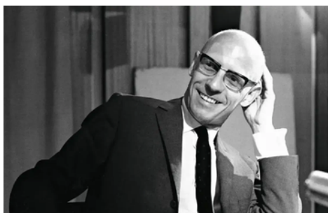
Figura X - Michel Foucault.

O filósofo e historiador Michel Foucault contribuiu para a compreensão desse cenário ao analisar como o poder atua sobre os corpos e as subjetividades. Ao discutir o conceito de “corpos dóceis”, Foucault explica como os indivíduos são moldados para serem úteis, produtivos e obedientes, tendo sua energia canalizada para o trabalho.