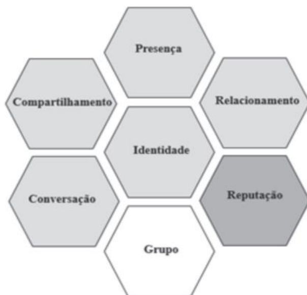
Figura 1 – Modelo Honeycomb proposto para o Instagram.