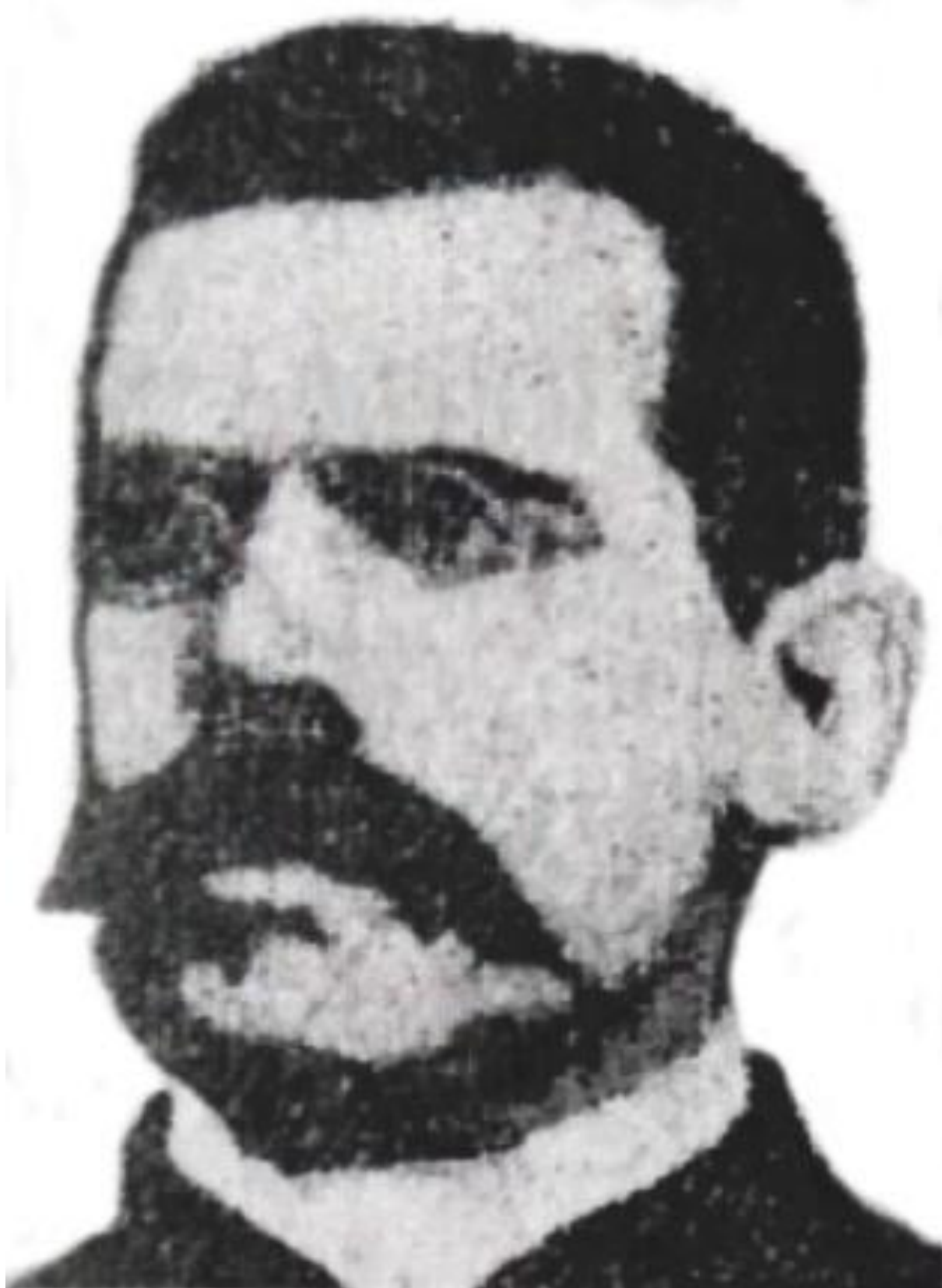
Figura 4 - General Laurentino Pinto Filho

GUERRA, Armando. Coluna feita por Armando Guerra. Family Search. Disponível em: Clique aqui Acesso em: 2 dez. 2024