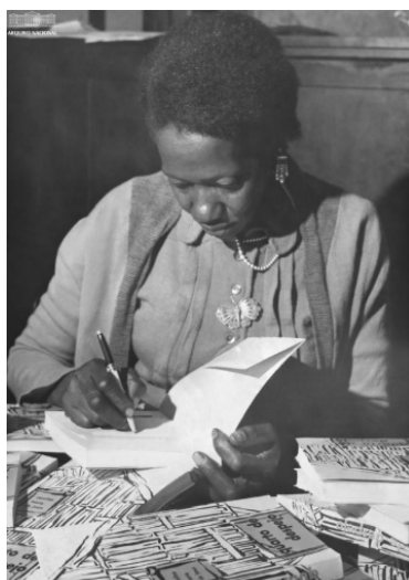
Figura 1- Carolina Maria de Jesus

Carolina Maria de Jesus (Figura 1) nasceu em 1914, em Sacramento, no estado de Minas Gerais, região que, à época, recebia famílias escravizadas oriundas do Nordeste, deslocadas em razão do declínio da cultura da cana-de-açúcar e da migração compulsória dos trabalhadores (FLORES, 2010, p. 8). Frequentou até o segundo ano primário no Colégio Allan Kardec, em sua cidade natal (FERNANDEZ, 2015, p. 102). Posteriormente, migrou para a cidade de São Paulo, onde tentou a profissão de empregada doméstica, mas, diante das adversidades, passou a sobreviver do recolhimento de papel, ferro, estopa e outros materiais reaproveitáveis encontrados no lixo (MACHADO, 2006, p. 106; FLORES, 2010, p. 8).