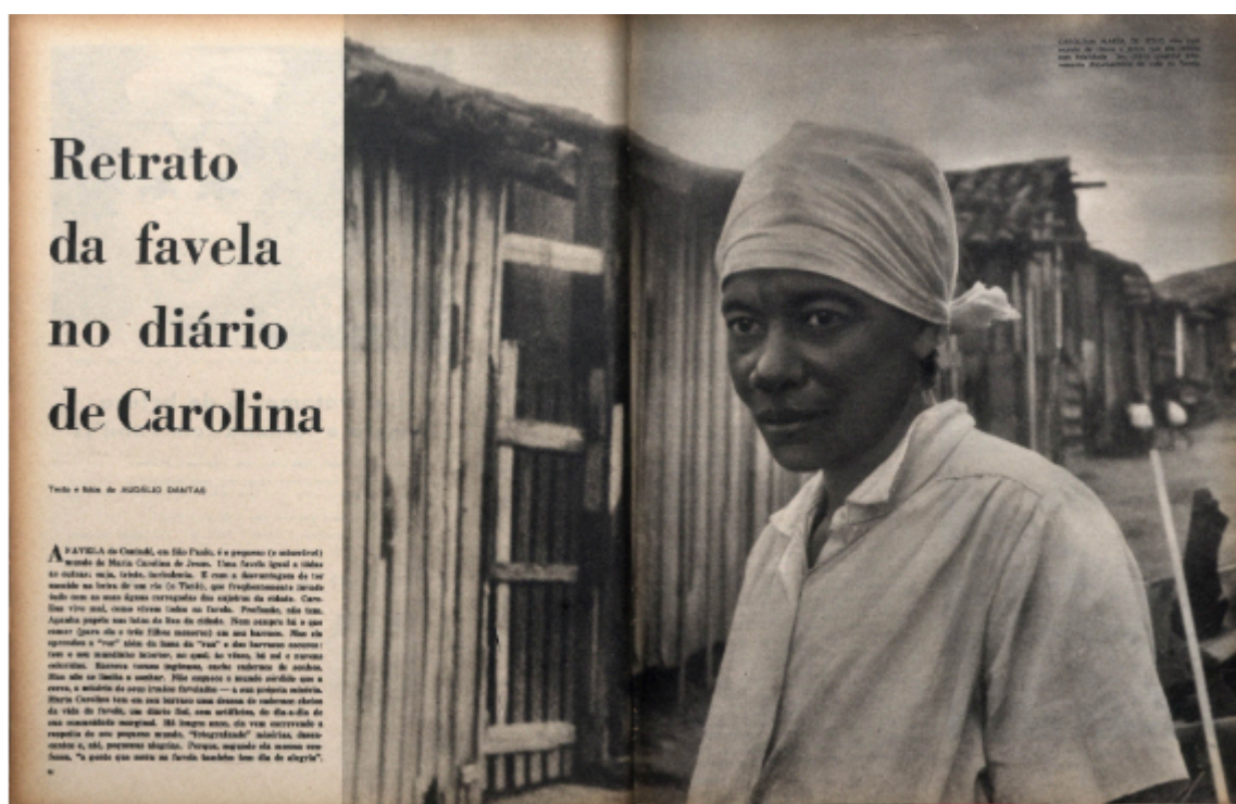
Figura 2 - Revista O Cruzeiro de 20 de junho de 1959 - Carolina Maria de Jesus