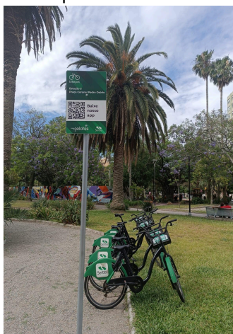
Figura 27 - Exemplo de Bicicleta Pública Pelotas

A cidade também poderia desenvolver um projeto de bicicleta pública compartilhada, conforme existe na cidade de Pelotas (Figura 27) e em outros municípios, que fique dentro de espaços públicos selecionados, a qual seria acessada por um aplicativo.