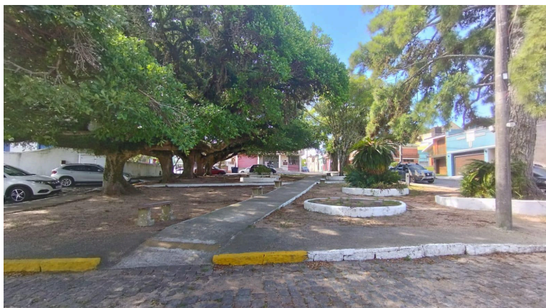
Figura 20 - Jardim Almiro Piúma

De acordo com a Lei Ordinária N° 2.203/1991, a área contínua ao Jardim Almiro Piúma, compreendendo os fundos do mercado, travessa nos fundos da CEEE, antigo estacionamento da Delegacia de Polícia, posto de serviços “São Paulo”. Representação do local na figura 20.