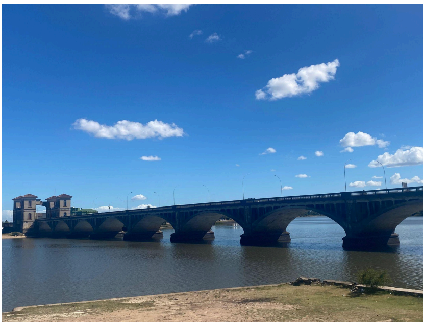
Figura 4 - Ponte Internacional Barão de Mauá

No Início do roteiro o destaque é a paisagem, em especial a Ponte Internacional Barão de Mauá (Figura 4), construída entre 1927 e 1930, a qual liga Brasil e Uruguai. Esta construção é o primeiro bem Binacional tombado pelo Instituto do Patrimônio Histórico e Artístico Nacional (IPHAN) e reconhecido como primeiro patrimônio cultural do Mercosul.