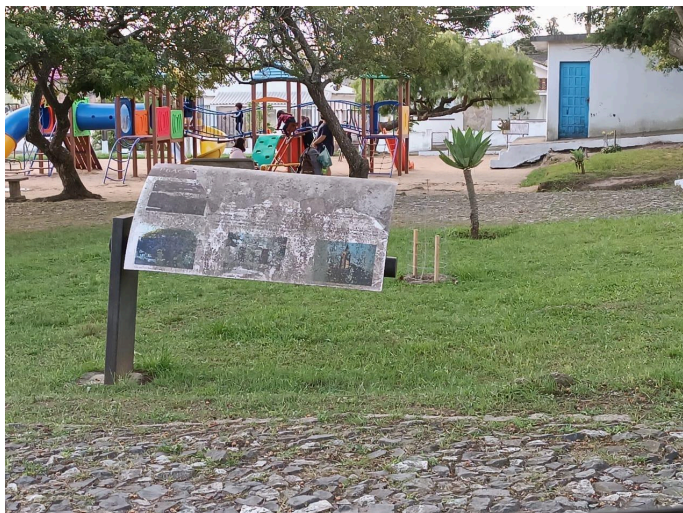
Figura 24 - Placa de Interpretação da Praça