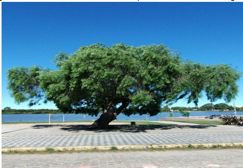
Figura 5 - Anacaita Localizada no Parque Linear Orla Do Rio Jaguarão