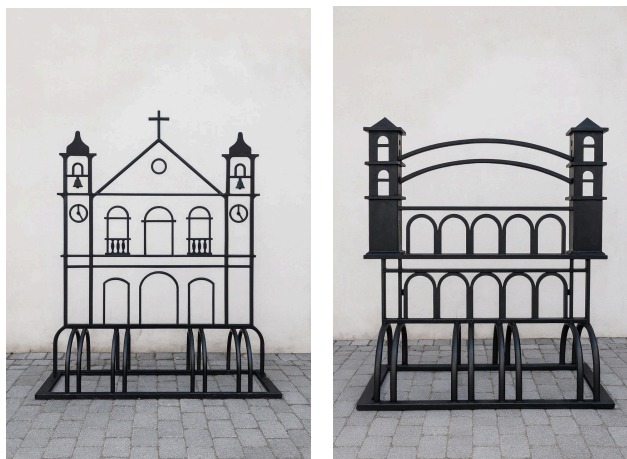
Figuras 25 e 26 - Protótipos de Bicicletários