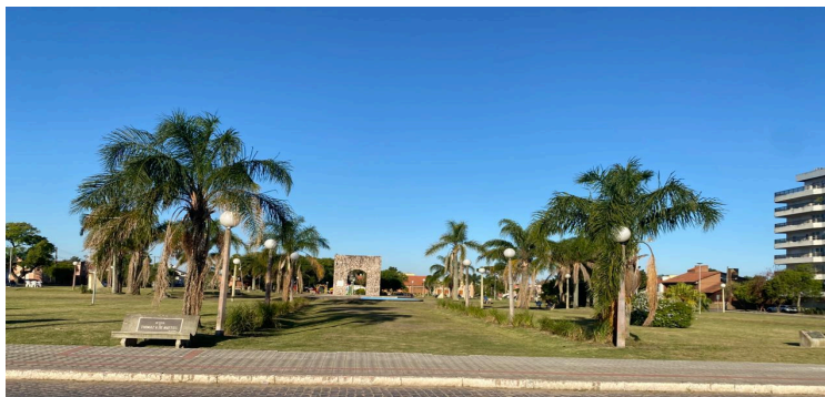
Figura 8 - Praça Comendador José Maria de Azevedo