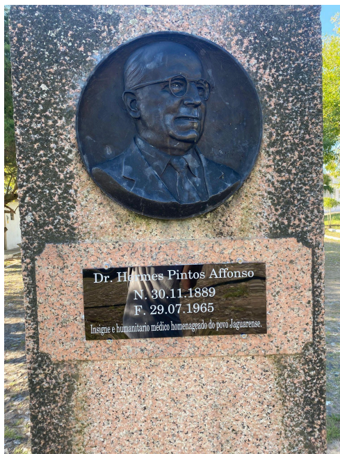
Figura 7 - Busto Dr Hermes Pintos Affonso