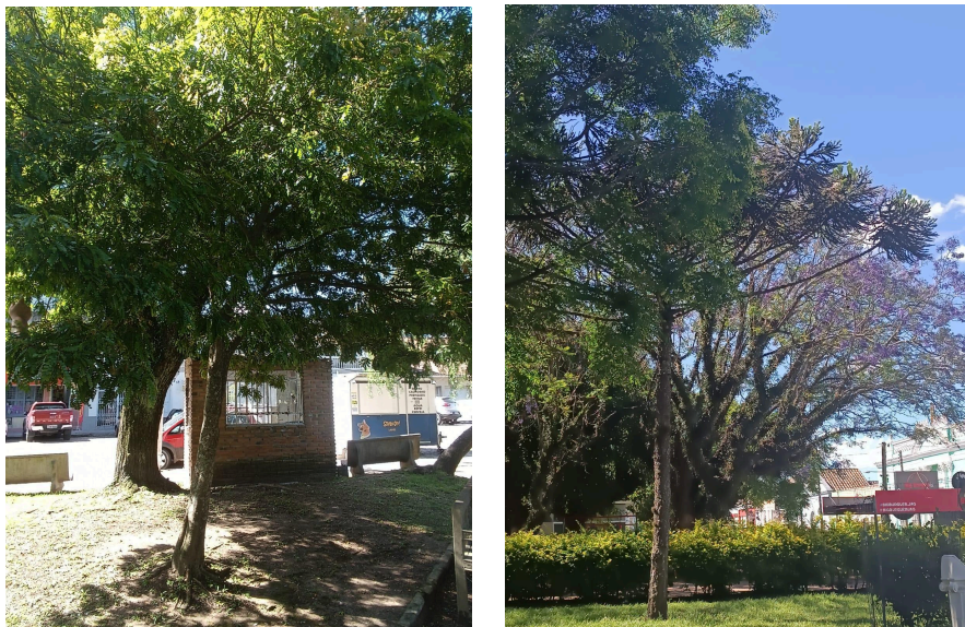
Figuras 17 e 18 - Pau Brasil e Pinheiro Brasileiro