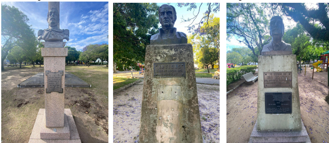
Figuras 13, 14 e 15 - Bustos de Estilac Leal, General Artigas, Barão de Rio Branco