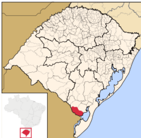
Figura 1 - Localização