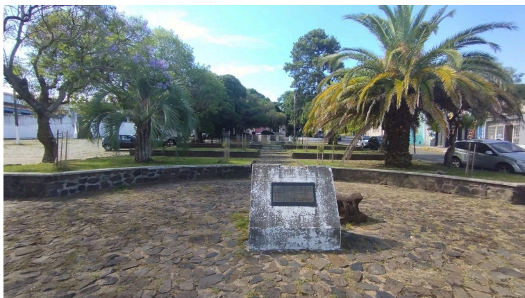
Figura 21 - Praça do Desembarque