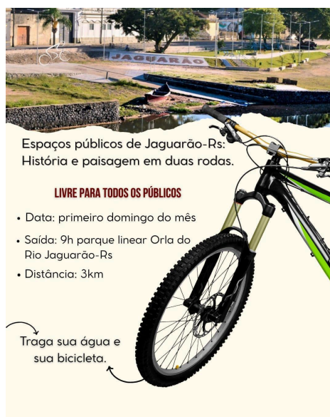
Figura 2 - Protótipo Card de Divulgação