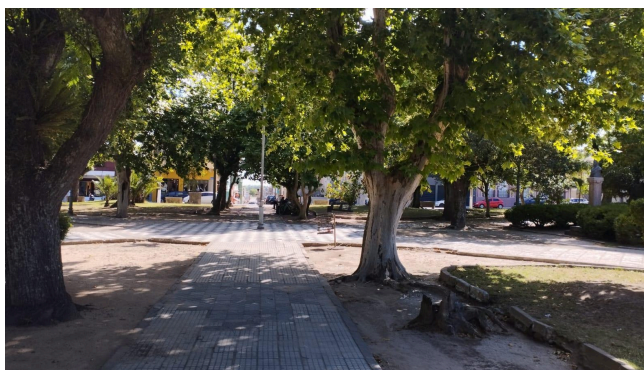
Figura 11 - Praça Dr Alcides Marques

Este local já abrigou um depósito de armas e munições do exército, até o ano de 1815, onde após a demolição das instalações militares em 1845 foi denominada Praça. Desde sua criação a praça já teve quatro nomes oficiais Praça da Matriz (em razão de estar localizada em frente à Igreja Matriz do Divino Espírito Santo), Praça Independência (em alusão à independência do Brasil), Praça 13 de Maio (em homenagem a data em que foi assinada, pela Princesa Isabel a Lei Áurea) e por fim no ano de 1954 foi nomeada de Praça Dr. Alcides Marques (em homenagem a um jaguareense que lutou tanto por sua cidade). Esta praça é mais arborizada em comparação às outras pois é considerada a praça de verão da cidade trazendo uma distinção com a outra praça do centro que é considerada a praça de inverno (Figura 11).