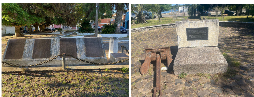
Figuras 22 e 23 - Monumento da Criação da Cidade e Monumento de Homenagem

Como monumento temos o marco que conta um pouco a história da criação da cidade (Figura 22) e um em homenagem ao 27 de Janeiro e renomeação da Praça do Desembarque (Figura 23), sendo estes últimos ambos o mesmo monumento.