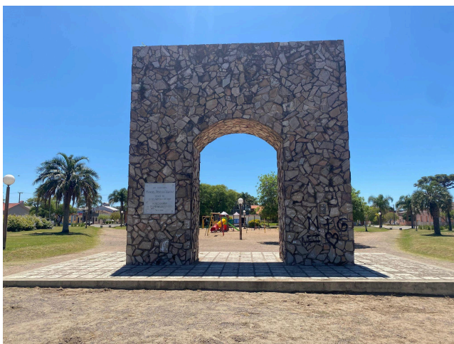
Figura 10 - Arco do Triunfo

Além disso, no centro da praça está localizado o Arco do Triunfo (Figura 10) em homenagem ao Coronel Manoel Pereira Vargas, grande herói da Batalha do 27 de Janeiro de 1865.