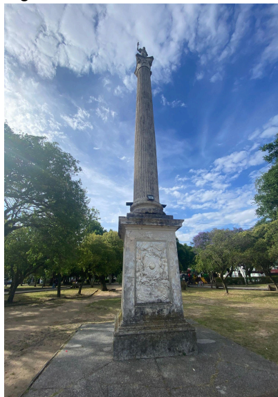
Figura 12 - Obelisco da Liberdade

Assim como os bustos de Estilac Leal Ministro da Guerra (Figura 13) no governo de Getúlio Vargas, os bustos do General Artigas (Figura 14) e do Barão de Rio Branco (Figura 15) que foram um presente do município de Rio Branco a Jaguarão e o busto do Dr Alcides Pinto (Figura 16) importante médico da cidade de Jaguarão.