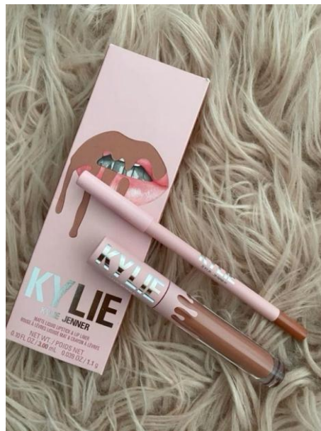
Figura 3 - Marca de batom e contorno labial da Kylie Jenner