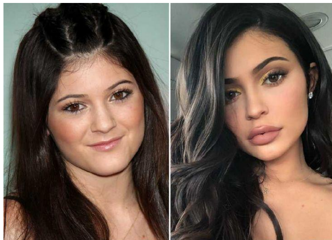
Figura 2 – Antes e depois da Kylie Jenner após o preenchimento labial

É inegável a influência que a família têm sobre as massas. Em 2015, Kylie Jenner, uma das irmãs mais conhecidas da família Kardashian-Jenner, popularizou ao fazer um preenchimento labial. Esse fato fez com que houvesse um aumento significativo na procura desse tipo de procedimento estético.