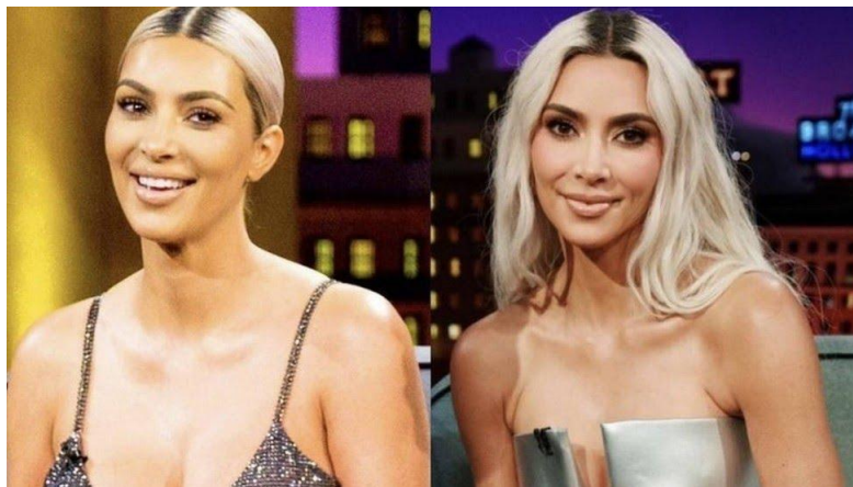
Figura 4 – Antes e depois da Kim Kardashian

mais natural. Essa mudança ficou ainda mais evidente em Kim Kardashian, um dos membros da família com maior notoriedade, visto que ela era conhecida especialmente pelo seu quadril avantajado e cintura fina, característica marcante de sua figura pública. Tudo isso foi feito não para ir contra a realização de cirurgias plásticas, mas para moldar um novo padrão corporal, a fim de se manterem nos holofotes e em evidência nos veículos de comunicação.