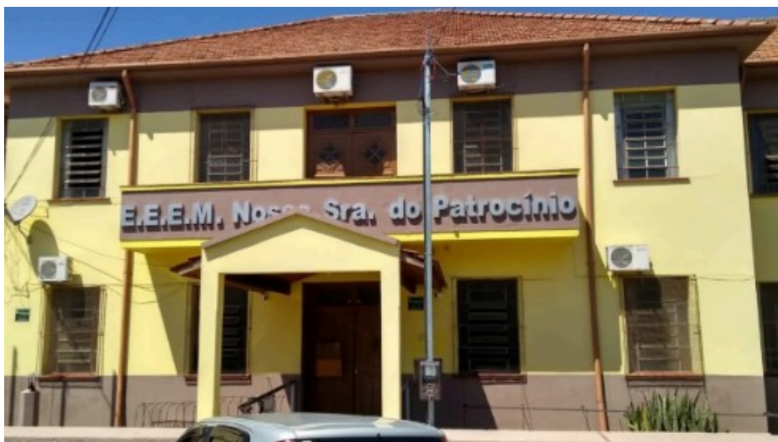
Figura 25 - Fachada atual da Instituição

A fachada do Ginásio Municipal Nossa Senhora do Patrocínio permanece praticamente inalterada ao longo dos anos, preservando suas características arquitetônicas originais. Mesmo com o passar do tempo e as transformações ocorridas no ambiente escolar, a estrutura externa da instituição mantém sua identidade visual, representando um elo entre o passado e o presente. Essa permanência reflete não apenas a solidez da construção, mas também a importância histórica e simbólica da escola para a comunidade, sendo um marco visível da tradição educacional que atravessa gerações.