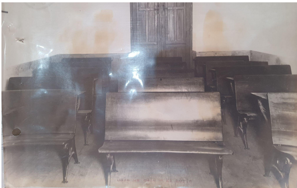
Figura 14 - Cadeiras do antigo auditório