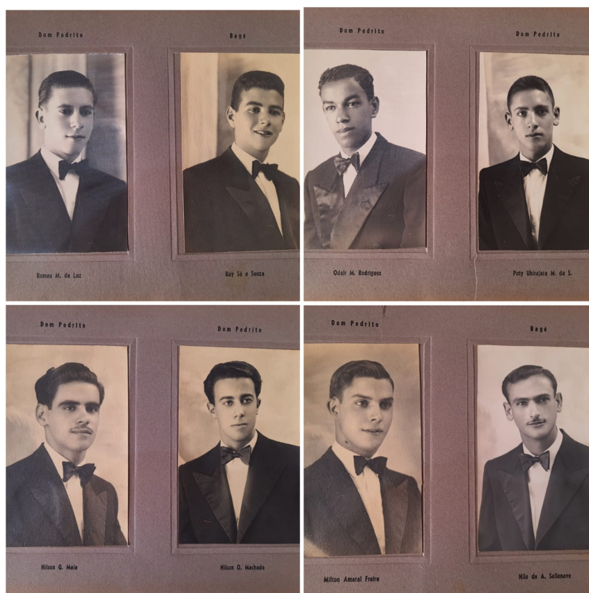
Figura 24 - Formandos e Homenageados da segunda turma (continua)

aspectos fundamentais para a análise da cultura escolar (Falsarella, 2018). Abaixo apresentamos a estrutura e imagens do álbum.