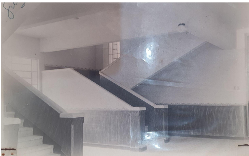
Figura 17 - Escadaria feita para separação de meninos e meninas