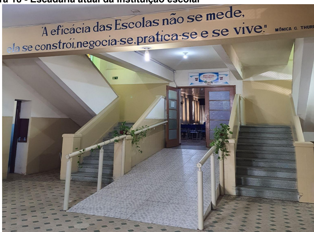
Figura 18 - Escadaria atual da instituição escolar

A arquitetura do Ginásio Municipal Nossa Senhora do Patrocínio permanece com a mesma estrutura que marcava a separação de gênero nas instalações, como as escadas distintas para meninos e meninas. No entanto, hoje, essa separação não existe mais, e a escola evoluiu para um ambiente verdadeiramente misto, permitindo uma maior interação entre os alunos. Essa mudança reflete o processo de transformação da cultura escolar, onde a segregação de gênero foi superada, acompanhando os movimentos sociais e culturais mais amplos da sociedade.