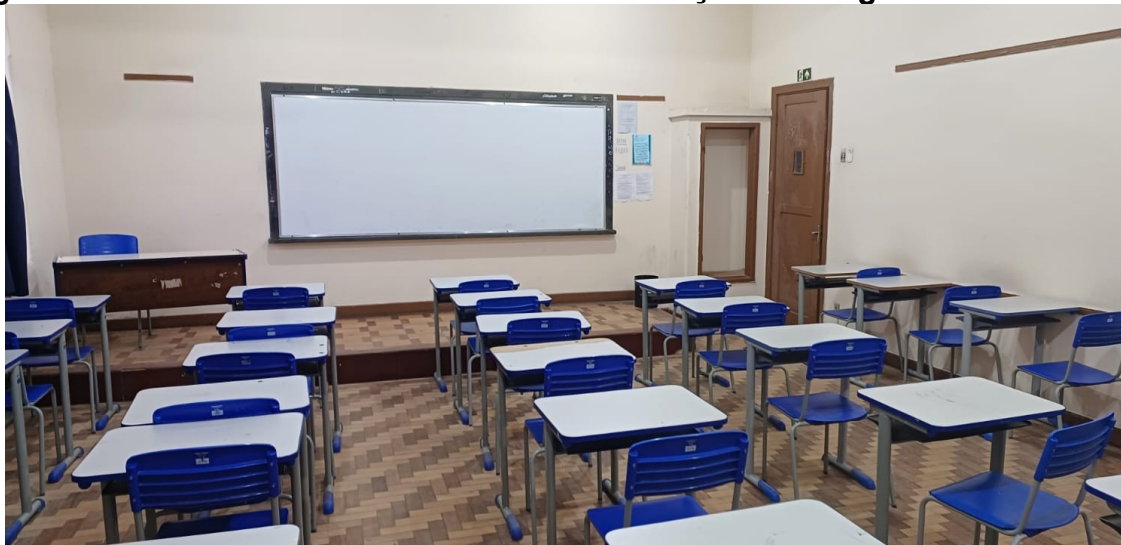
Figura 12 - Sala de aula da atualidade na instituição investigada