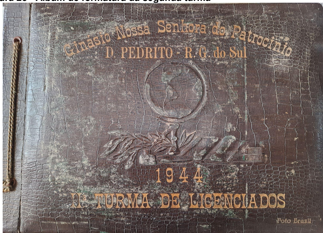
Figura 23 - Álbum de formatura da segunda turma