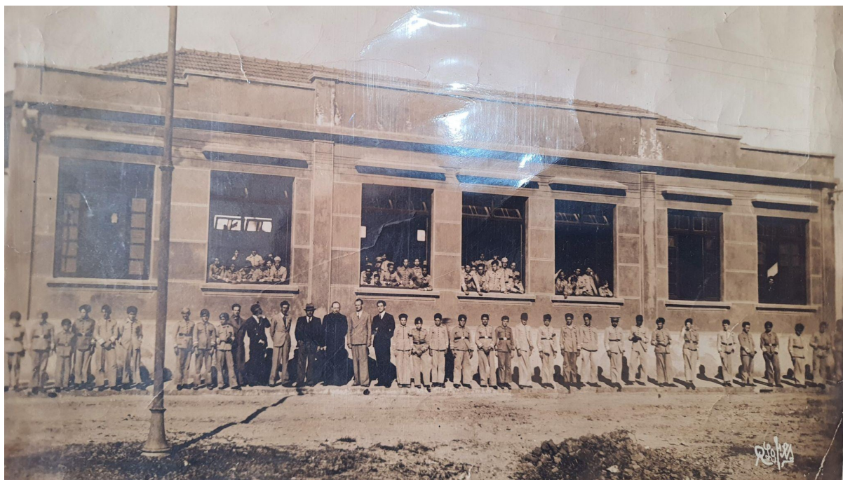
Figura 16 - Passeio de alunos no ano de 1940