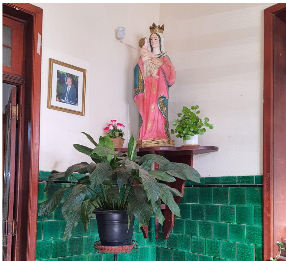
Figura 26 - Santa Nossa Senhora do Patrocínio no atual Hall de entrada

persiste até os dias atuais. Essa permanência de símbolos religiosos convida à revisão da afirmação feita anteriormente sobre a retirada do crucifixo como evidência de um ensino completamente laico, uma vez que a presença de elementos confessionais ainda integra o cotidiano escolar de forma simbólica. A presença da Santa, que carrega o nome da escola, é um símbolo do papel central da Igreja na educação daquela época, mas também levanta uma questão importante: será que a ligação com a Igreja Católica ainda está presente na escola além deste símbolo? Essa dúvida nos convida a refletir sobre a continuidade ou transformação da influência religiosa na vida escolar, especialmente em um contexto de secularização crescente na sociedade.