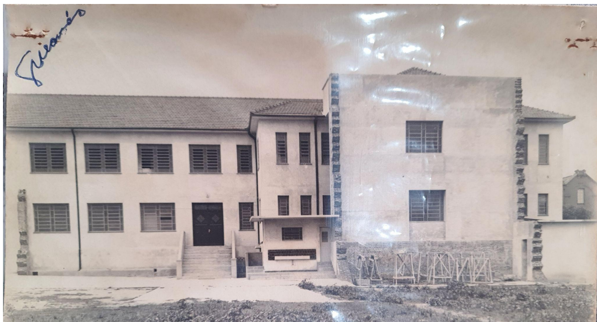
Figura 7 - Pátio do Ginásio Municipal Nossa Senhora do Patrocínio