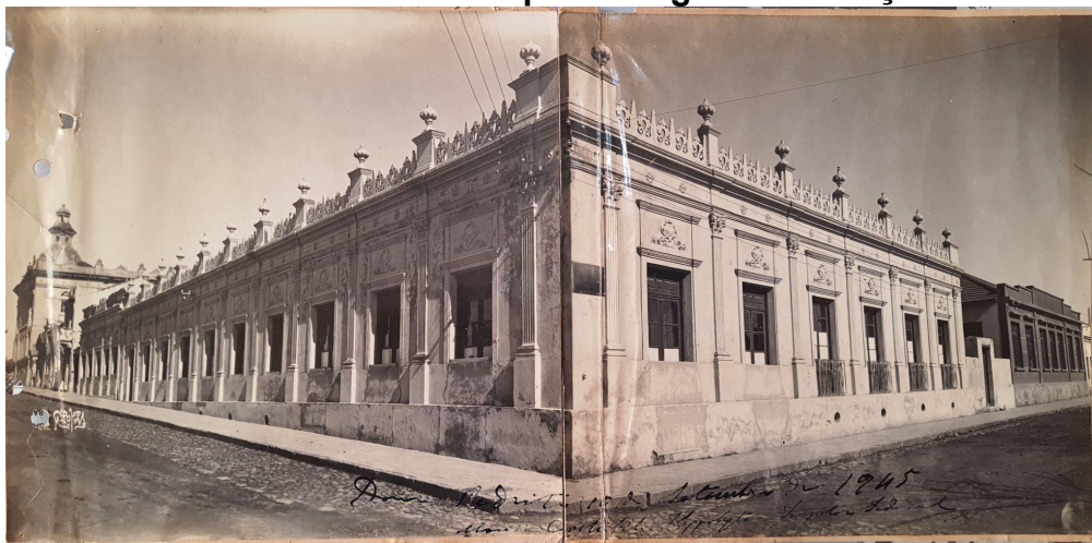
Figura 5 - Imóvel no centro da cidade para abrigar a instituição