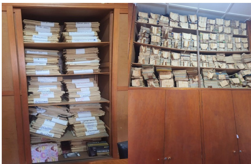
Figura 2 - Arquivo da EEEM Nossa Senhora do Patrocínio - Dom Pedrito

Embora a existência desse acervo tenha sido identificada, até o momento não foi possível ter acesso completo ao grande volume de documentos armazenados. A seguir, são apresentadas imagens do arquivo escolar, ilustrando o desafio que envolve a exploração e o manuseio desses registros na busca por dados empíricos para esta pesquisa.