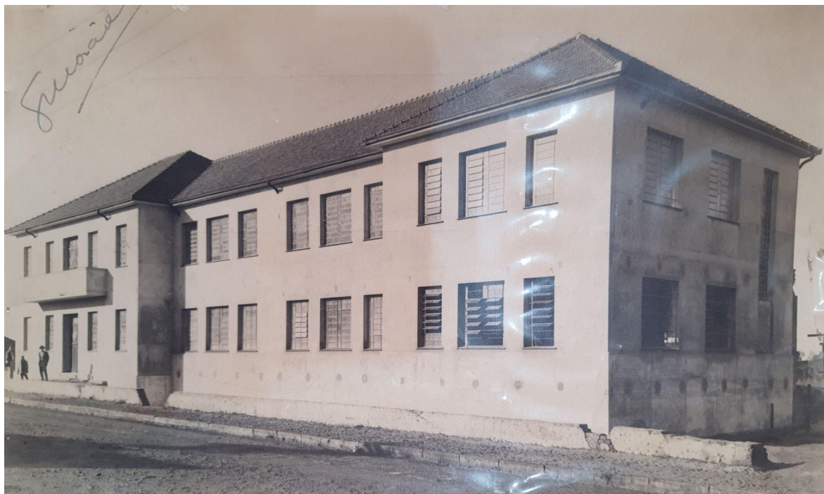
Figura 6 - Frente do Ginásio Municipal Nossa Senhora do Patrocínio