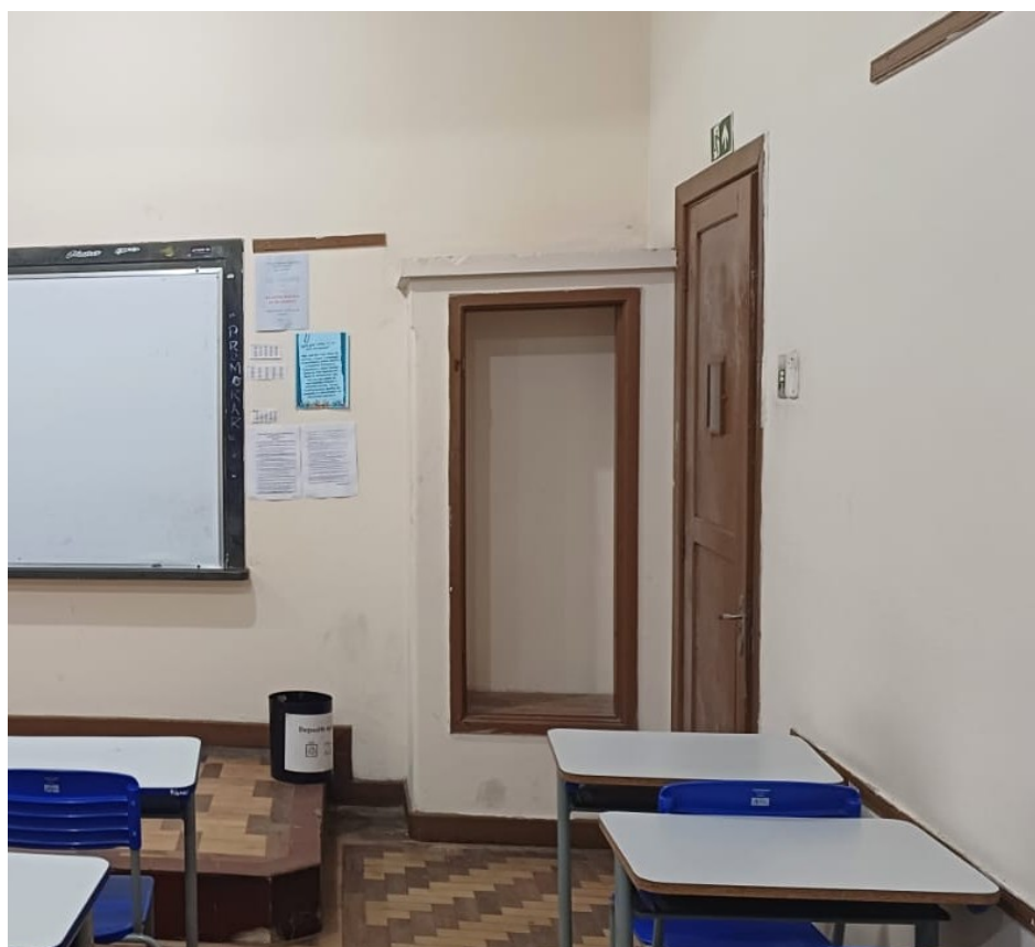
Figura 11 - “Canto do castigo” na arquitetura atual

disciplina rígida e a normatização dos comportamentos eram essenciais para a cultura escolar do Ginásio Municipal Nossa Senhora do Patrocínio. Esse mecanismo de controle social, associado à transmissão de saberes, revela a conexão intrínseca entre a educação formal e as práticas de socialização, que moldavam os jovens conforme as normas da época, especialmente em um contexto onde a autoridade religiosa e a manutenção da disciplina eram valorizadas. Assim, a cultura escolar dessa instituição não era apenas um reflexo do ensino formal, mas também de uma estrutura social que buscava garantir a conformidade com os valores vigentes