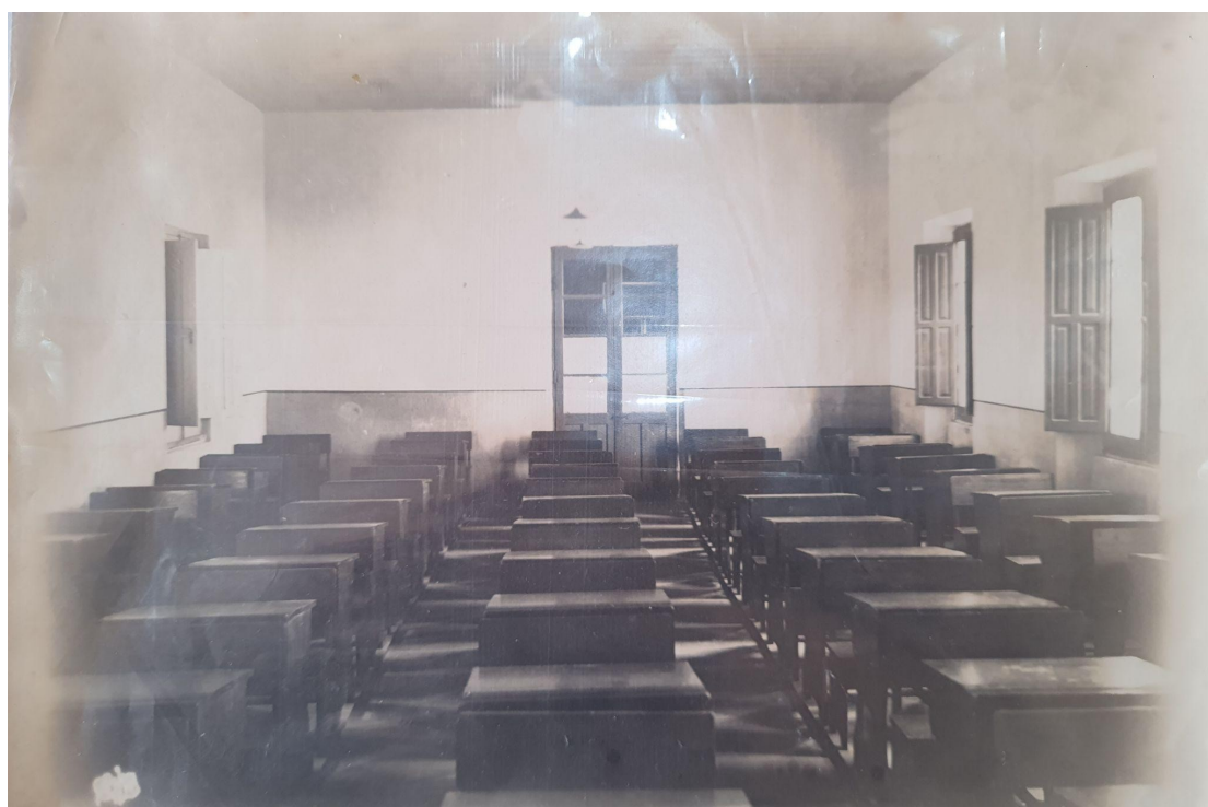
Figura 10 - A sala de aula visualizada pelo professor no início da instituição