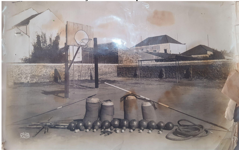
Figura 21 - Materiais de educação física no pátio do Ginásio