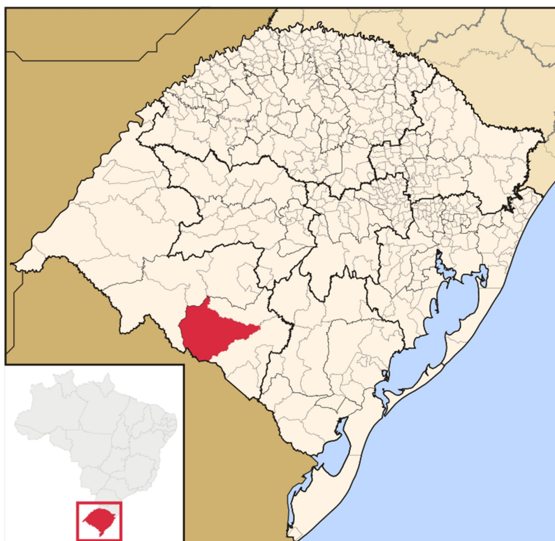
Figura 3 - Mapa de localização de Dom Pedrito no estado do Rio Grande do Sul

O município de Dom Pedrito, que está localizado na região da Campanha Gaúcha, faz divisa com diversos municípios do Rio Grande do Sul, além de ter fronteira internacional com o Uruguai, ao Norte temos Rosário do Sul e São Gabriel, a Nordeste Lavras do Sul, a Leste há a cidade de Bagé, a Oeste fica localizada Santana do Livramento e ao sul há a República Oriental do Uruguai, conforme apresentamos na figura abaixo: