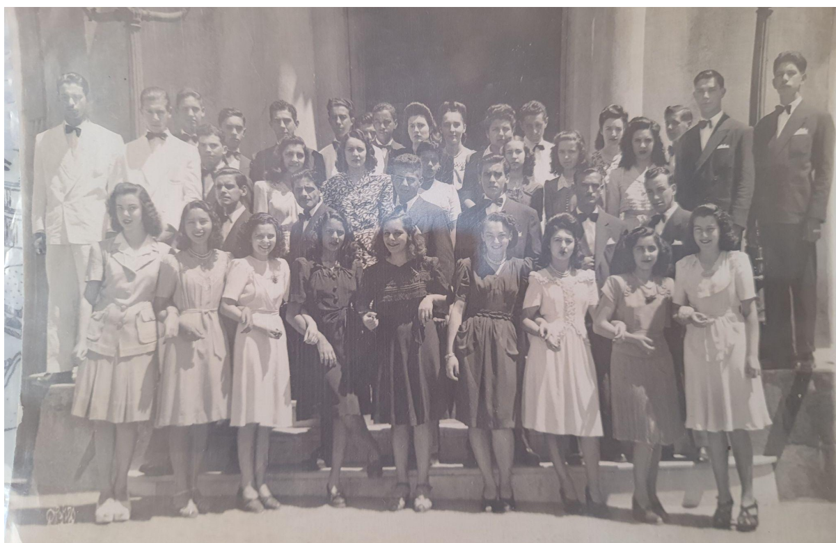
Figura 8 - Foto da primeira turma mista da instituição