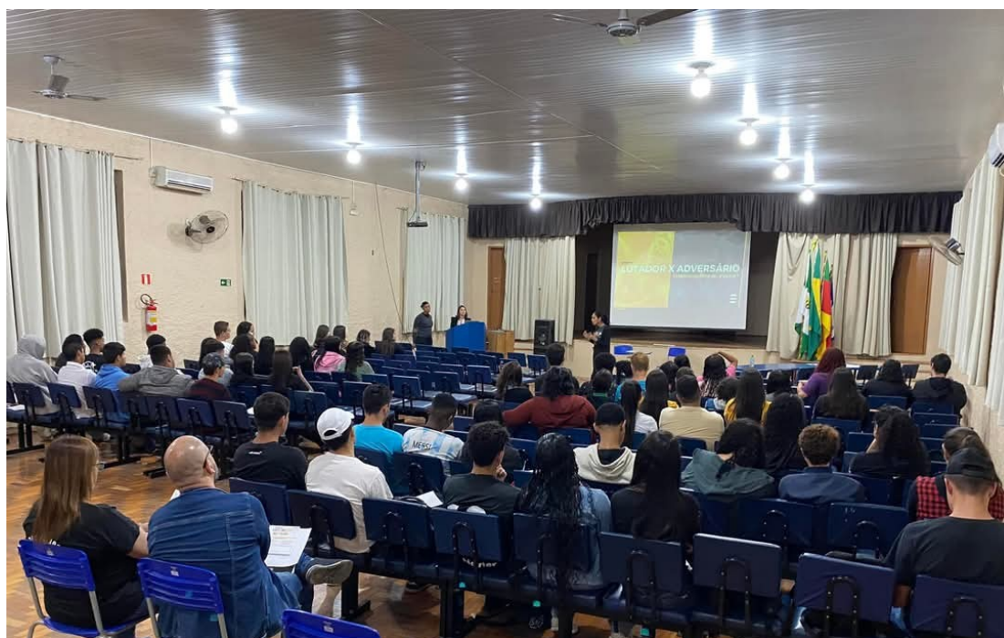
Figura 15 - Auditório atual