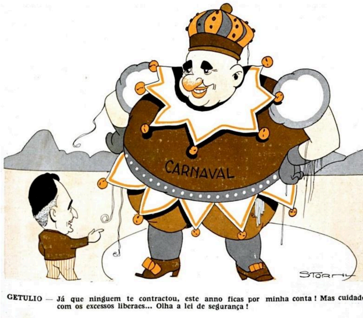
Figura 1: Charge sobre Vargas e a Lei de Segurança Nacional