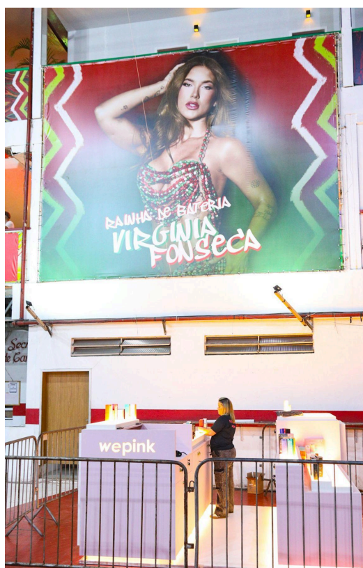
Figura 13: Quiosque da wepink na quadra da Grande Rio

Além do banner estampando a sua figura e sua marca, também foi instalado um quiosque na quadra, o qual vende os produtos da wepink :