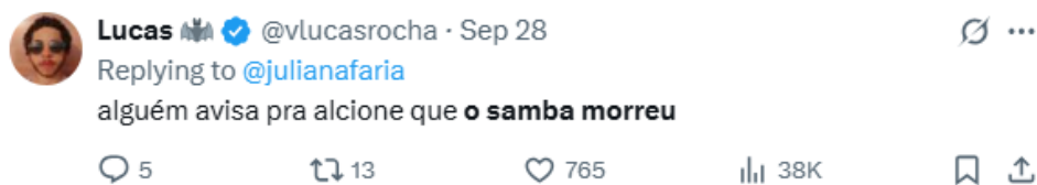
Figura 9: Post de um usuário do X