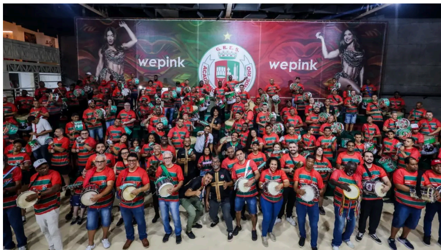
Figura 12: Bateria da Grande Rio em frente a um banner da wepink