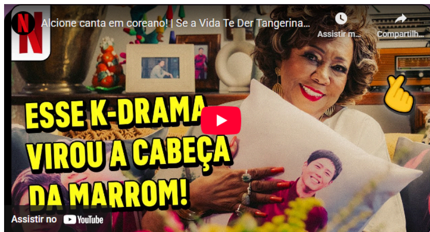
Figura 5: Capa do YouTube do vídeo promocional da Netflix com Alcione.