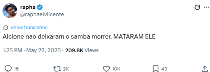
Figura 6: Post de um usuário do X