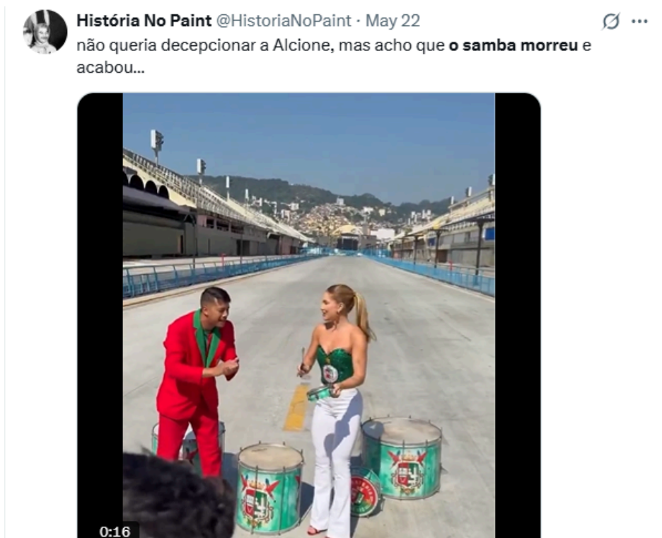
Figura 8: Post de um usuário do X