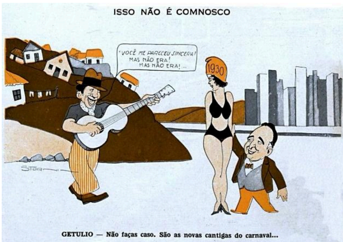
Figura 2: Charge Isso não é conosco