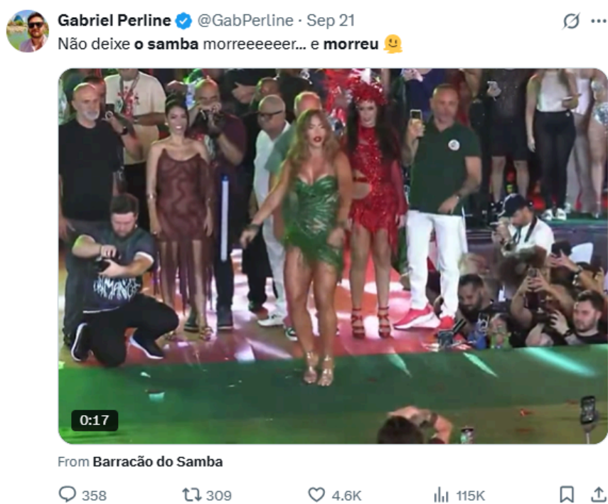
Figura 7: Post de um usuário do X