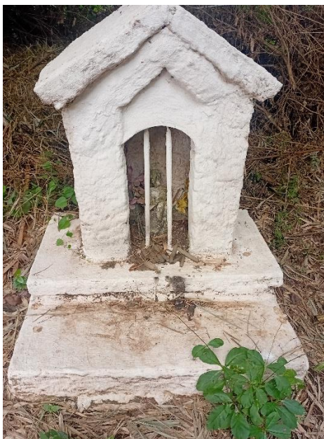
Imagem 1- Gruta de São João Batista