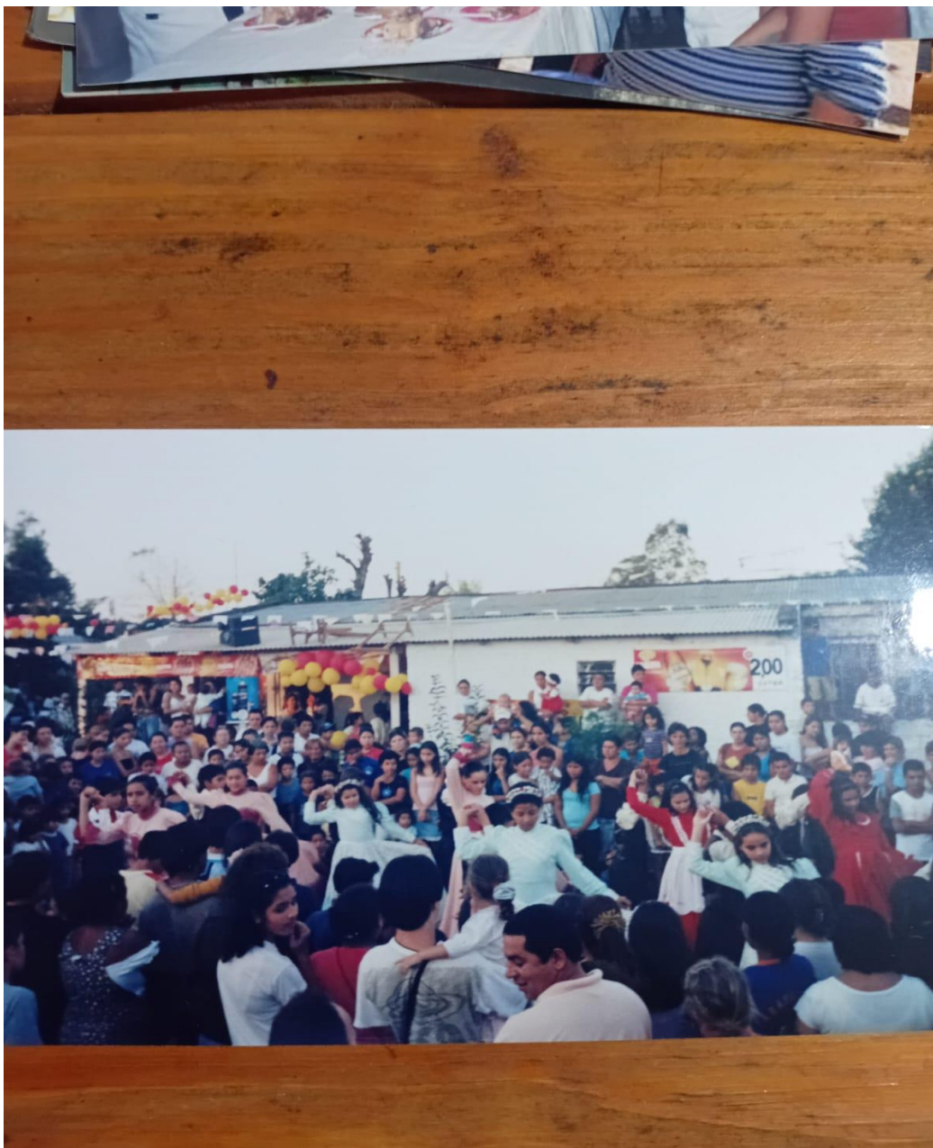
Anexo 3: Dança que envolvia a procissão em 1994.