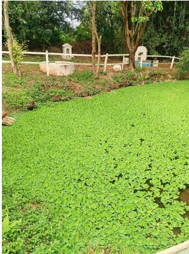
Imagem 4 – Lago no local histórico da Fonte São João Batista

Banhar o santo nas águas da fonte é uma tradição, os fiéis se emocionaram muito com a procissão, muitos receberam milagres em casos dados como perdidos. Depois de banhar o santo, os fiéis voltaram no mesmo trajeto, levando o santo para a gruta.