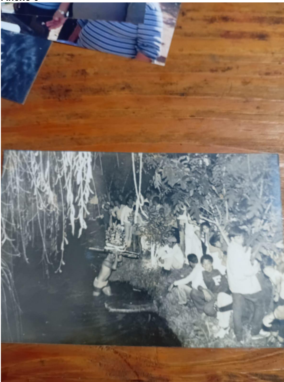
Anexo 6: Chegada da figura do Santo na Fonte São João Batista em 1975.