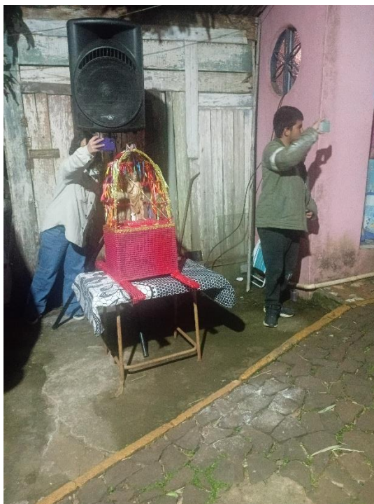
Imagem 3- Imagem do Santo São João Batista na procissão de 2025

A chegada à fonte aconteceu por volta das 20:30 horas, local onde a imagem do Santo foi banhada pelos fiéis, que ingressaram na fonte entoando cânticos e orações em homenagem à São João Batista. Ao chegarem em frente ao lago, um senhor coloca o santo nos seus ombros e atravessa a fonte.