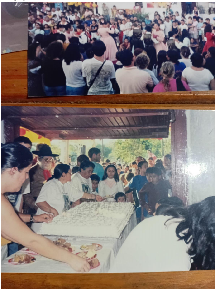
Anexo 4: Parte da comemoração relacionada à Mesa dos Inocentes, onde são oferecido doces principalmente as crianças carentes da região.