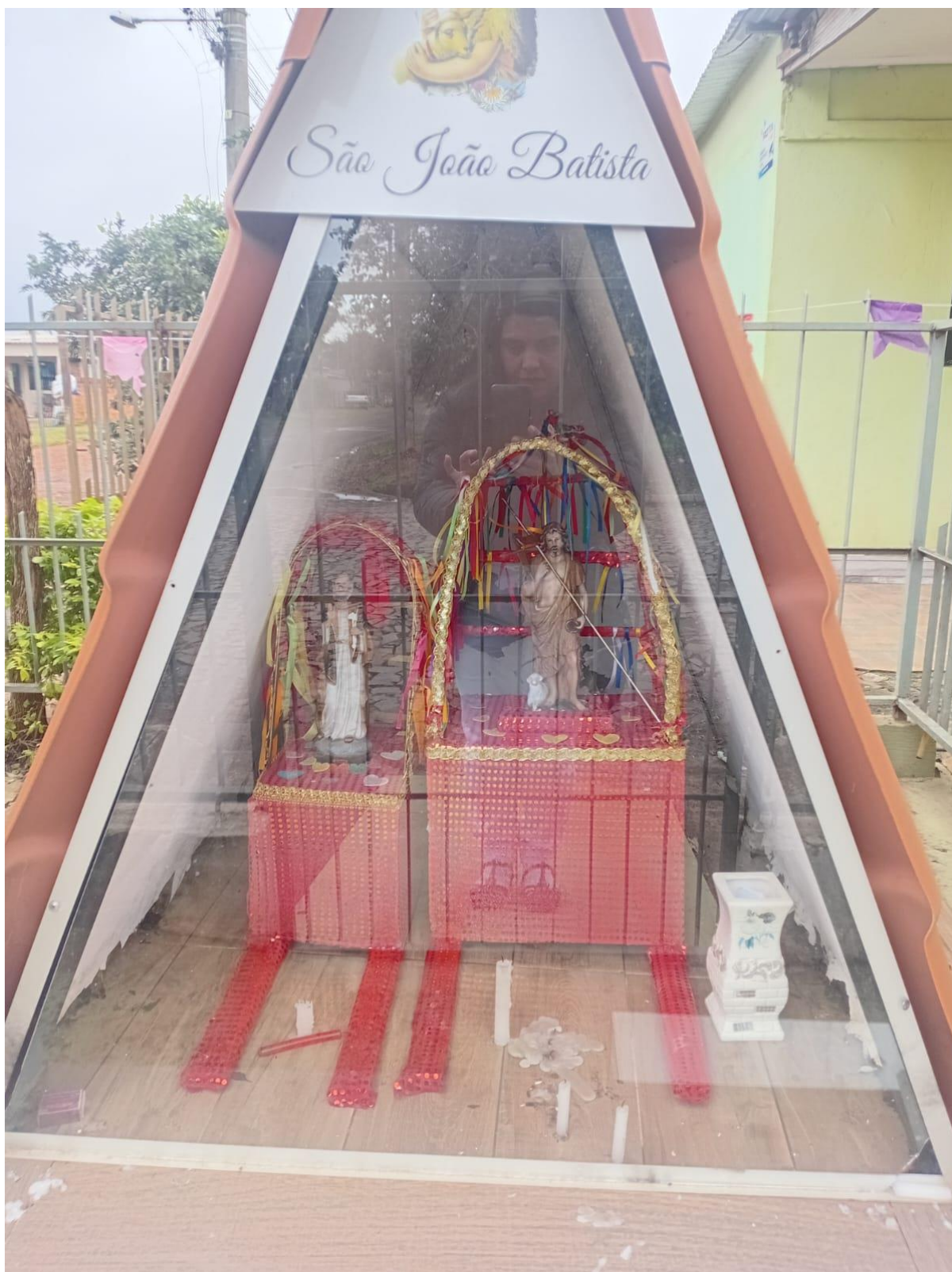
Anexo 5: Local onde descansa e reside o Santo que os devotos adoram.