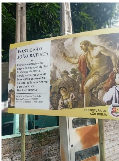
Imagem 2- Sinalização da Fonte de São João Batista

Deste local, os devotos carregaram a imagem do Santo São João Batista da gruta em uma procissão a pé, até o local da fonte de São João Batista com um caminhão de som. Havia um canto em cima do caminhão e uma ambulância estava acompanhando o percurso junto da Polícia Militar e alguns cavaleiros.