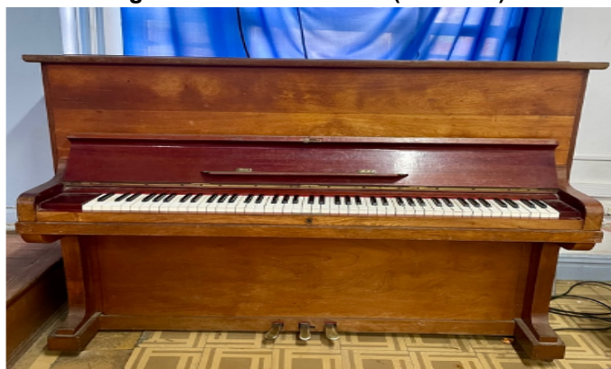
Figura 7: Piano acústico (Escola 2)

As escolas tinham aula de música no currículo. Então, pela experiência que eu tenho da época, eu acredito que seja um instrumento que veio pela mantenedora mesmo, não tenha sido doação. Eu acredito, não tenho essa informação com certeza. (Entrevista com a Coordenadora Pedagógica, Escola 2).