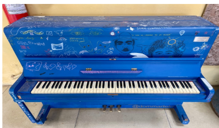
Figura 5: Piano colorido (Escola 1)

musicais, além dos pianos, fossem realocados para a instituição por um tempo ainda não determinado. Dessa forma, a professora levou dois pianos de armário para a escola, além de outros modelos digitais. Também foi perguntado se a entrevistada sabia como estes pianos foram adquiridos pelo projeto e, como resposta, ela comenta que todos foram através de doações: “Esses dois pianos armários que são doações, ali tu vai olhar no piano e tem a plaquinha, doação da família e tal. Aquele outro que está todo colorido foi doação também.” (Entrevista com a Diretora, Escola 1).