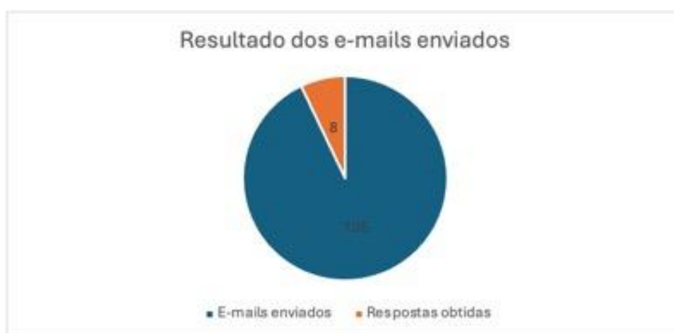
Figura 2: Gráfico de e-mails enviados

Contudo, mesmo com a prolongação do prazo de respostas via e-mail, apenas oito, de cento e cinco e-mail enviados, responderam. Sendo que, uma escola sinalizou que possuía o instrumento piano, mas após uma obra na instituição este sumiu; quatro responderam não possuir o instrumento; duas relataram deter um teclado e uma respondeu positivamente possuir um piano em suas dependências.