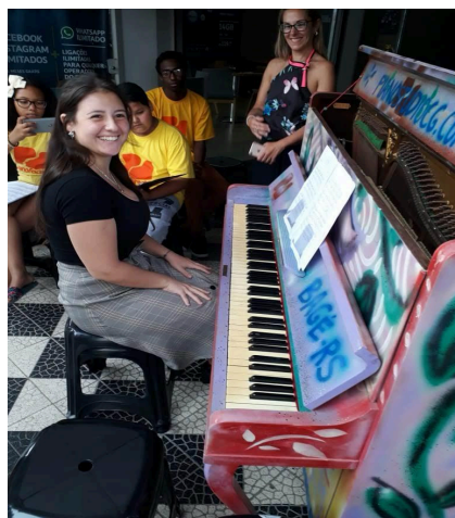
Figura 1 - Registro da participação do projeto de pianos nas ruas

fui observando e percebendo que ao invés de demonstrarem imediato interesse pelo piano, alguns participantes demonstraram insegurança e/ou ansiedade, muitas vezes ao ponto de nem querer tocá-lo. Essas reações me fizeram refletir acerca do “lugar” socialmente ocupado pelo instrumento e quanto este pode estimular ou inibir as possibilidades de contato das pessoas que o cercam.