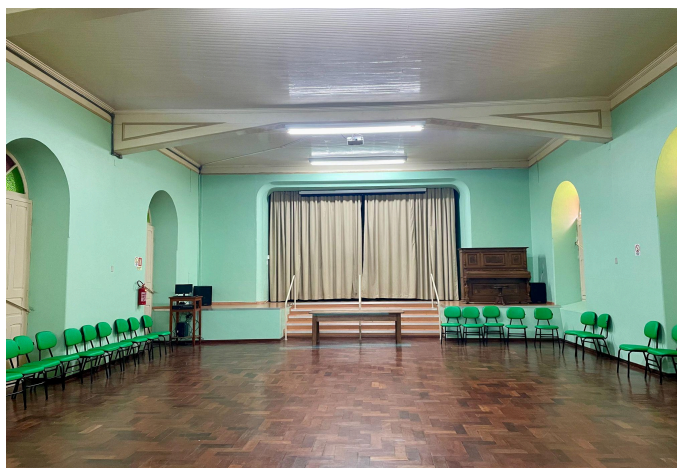
Figura 13: Salão Verde (Escola 3)