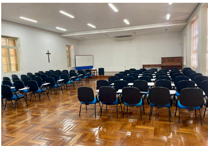
Figura 12: Salão Azul (Escola 3)

Na terceira instituição participante, a diretora revela que os pianos já haviam sido realocados e que, mesmo não tendo registro escrito sobre os fatos, “as irmãs antigas” compartilhavam que “havia as salas de músicas, a sala grande e as celinhas , que possibilitavam a separação dos pianos e aulas individuais do instrumento (Entrevista com a Diretora, Escola 3).