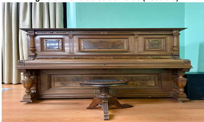
Figura 9: Piano do Salão Verde (Escola 3)

Após essa explicação, também perguntei à diretora se ela sabia de que maneira a educação musical era realizada na escola, se por meio de canto coral ou em formato instrumental. Neste caso, a diretora relatou que as aulas eram realizadas de ambas as maneiras, tanto no coral da escola, quanto em aulas particulares de piano.