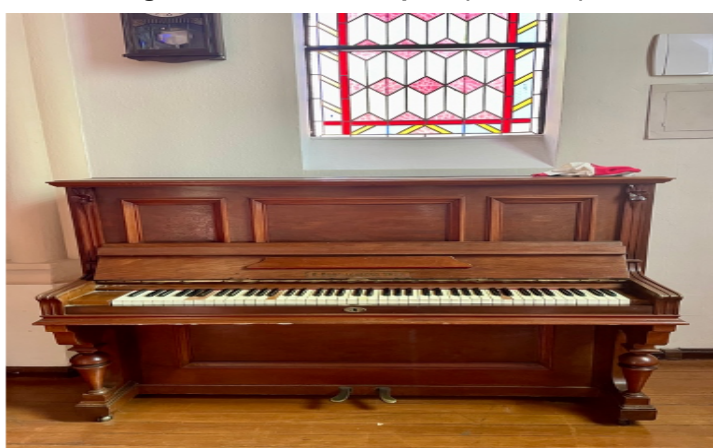
Figura 10: Piano da capela (Escola 3)