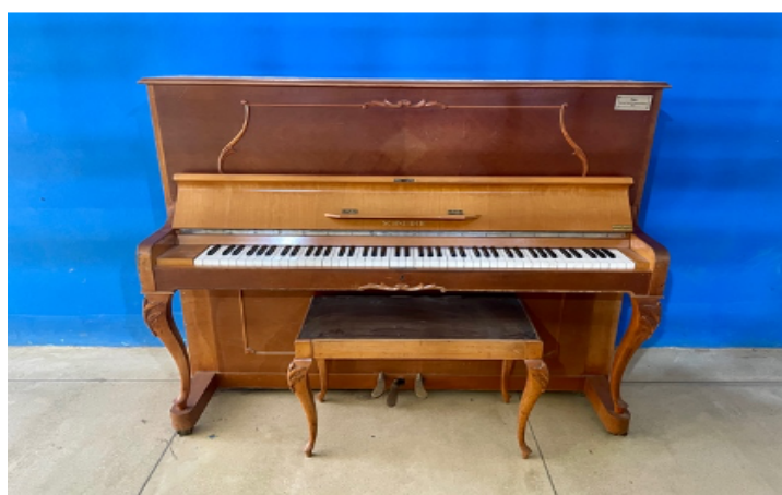
Figura 6: Piano acústico que não está pintado (Escola 1)