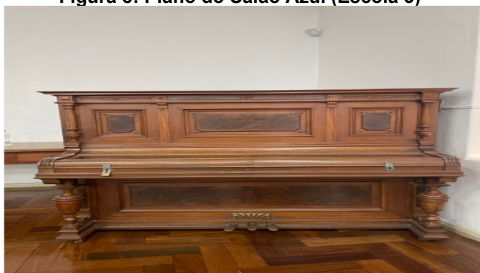
Figura 8: Piano do Salão Azul (Escola 3)

Na terceira entrevista, a diretora da Escola 3 deixou nas entrelinhas, de forma menos direta, que os pianos foram adquiridos pela própria instituição. Além disso, ela ressalta que, atualmente, a escola possui três pianos em sua estrutura, “um no salão verde, um no salão azul e um na capela”. Além disso, relatou que “antigamente o colégio tinha as irmãs musicistas” e “estas ministravam aulas de piano dentro da escola como uma atividade extraclasse”. (Entrevista com a Diretora, Escola 3).