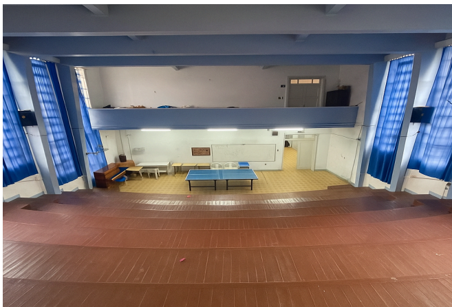
Figura 11: Auditório (Escola 2)

aconteciam as apresentações, e onde tem o mezanino”, a entrevistada reafirma a ideia de que o instrumento nunca foi realocado. (Entrevista com a Coordenadora Pedagógica, Escola 2).