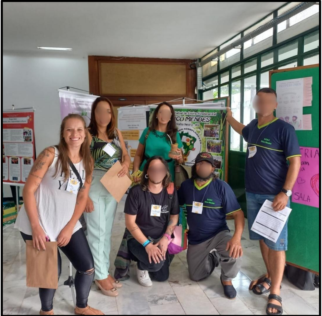
Figura 2 - Evento do CONANE, em Brasília, professora responsável pelo projeto com os demais docentes da 13ª coordenadoria que estavam apresentando o trabalho no evento.