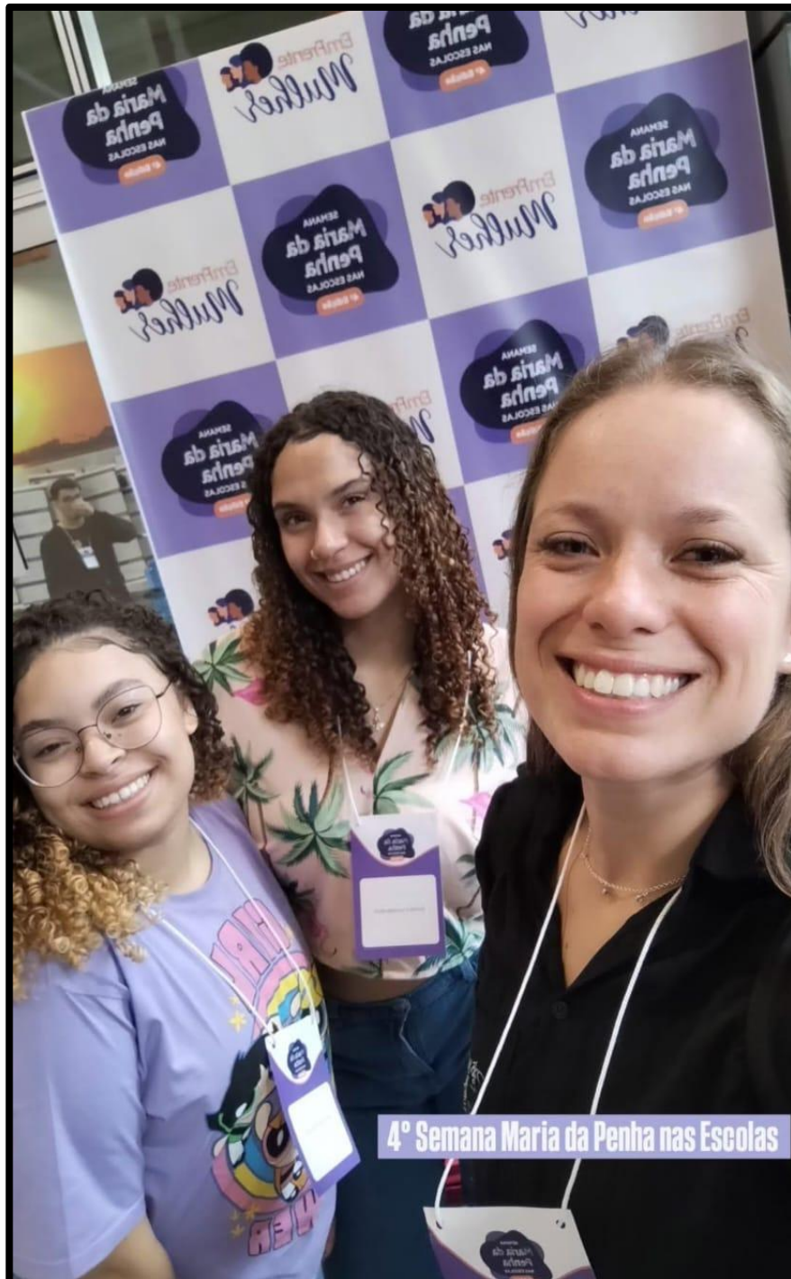
Figura 4 - Alunas e professora, apresentando um trabalho na 4ª Semana Maria da Penha nas Escolas.