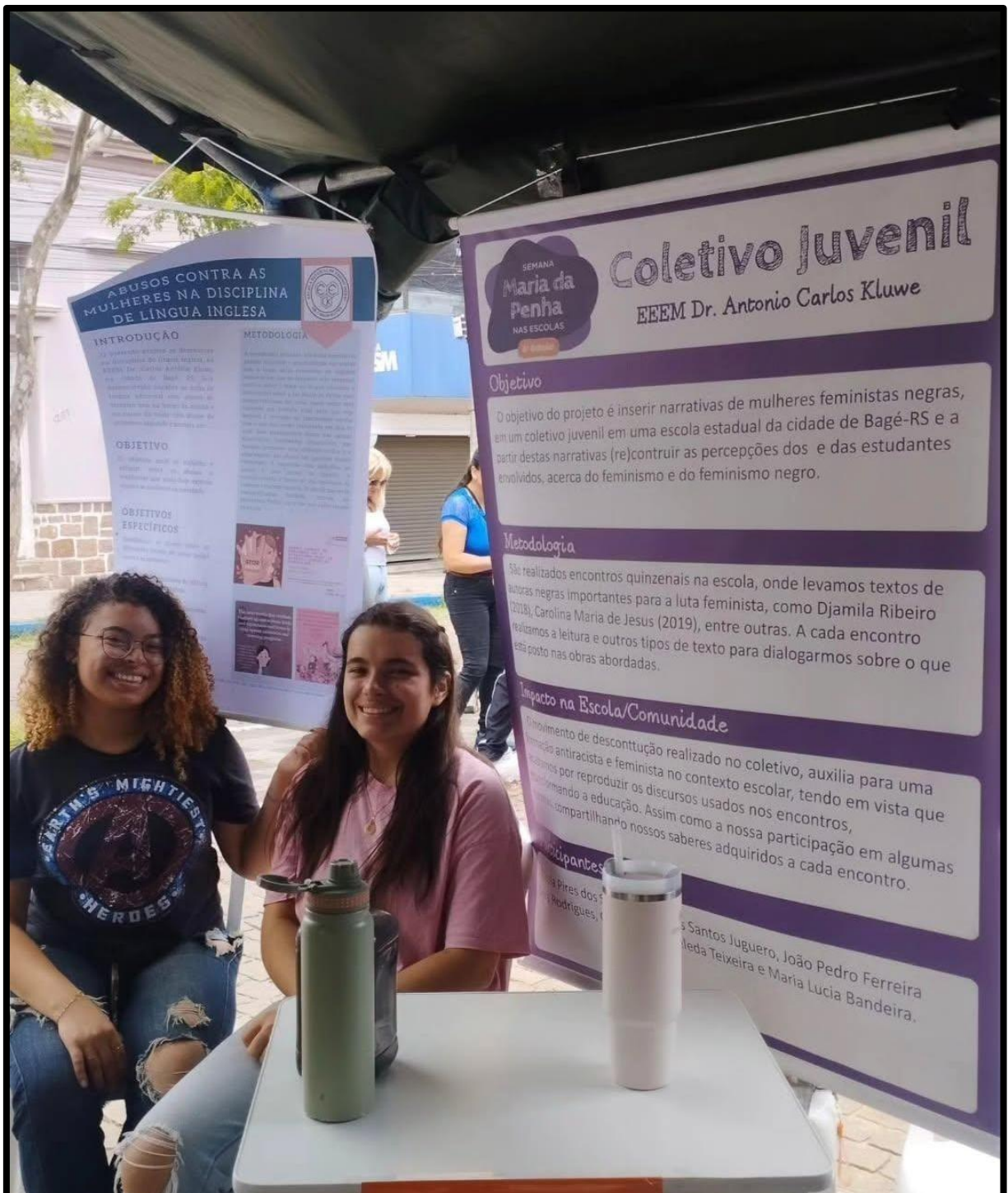
Figura 5 - Alunas integrantes do Coletivo no ano de 2024, apresentando o projeto no evento da 13ª Coordenadoria, na cidade de Bagé.