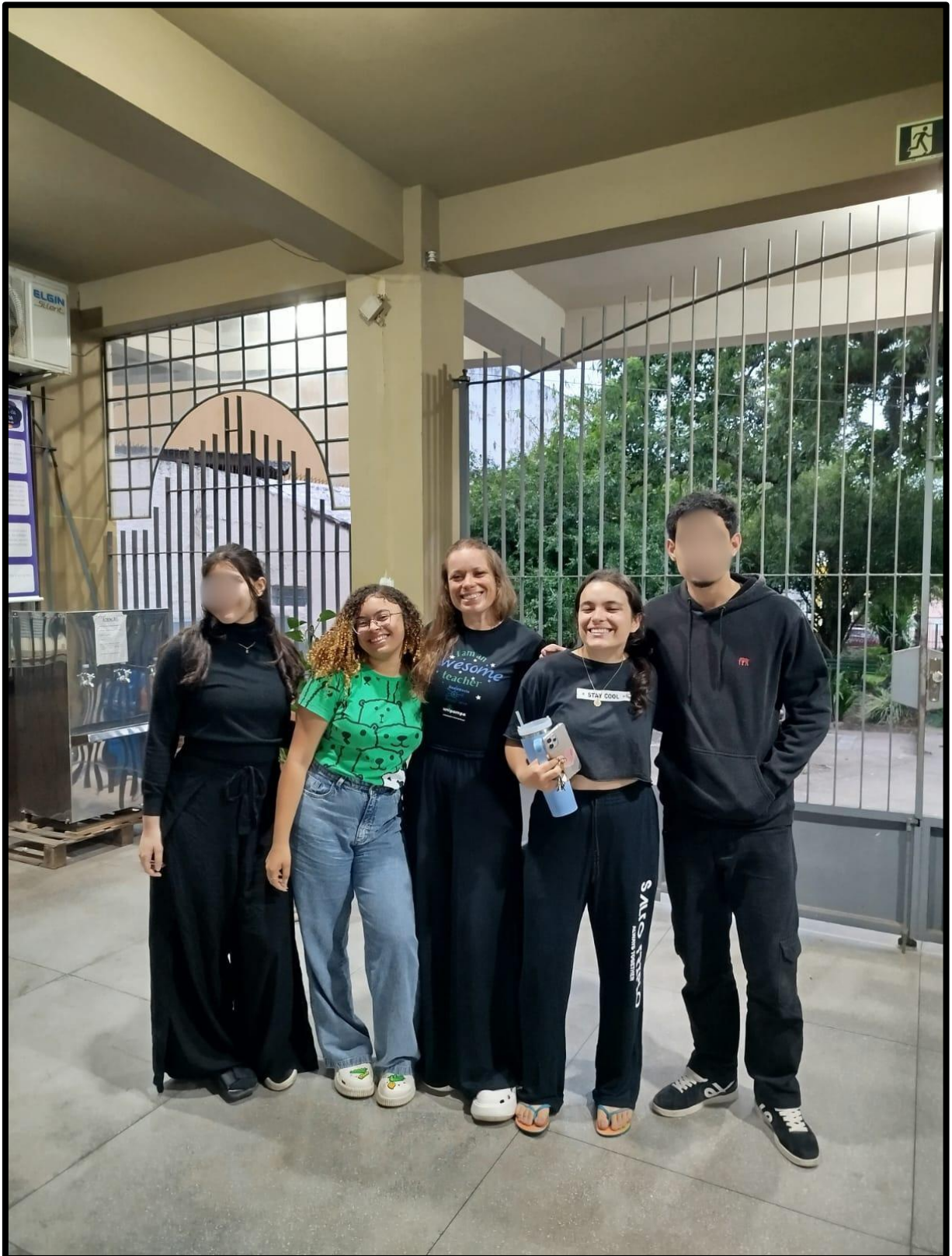
Figura 6 - Parte dos alunos integrantes do coletivo, após reunião.