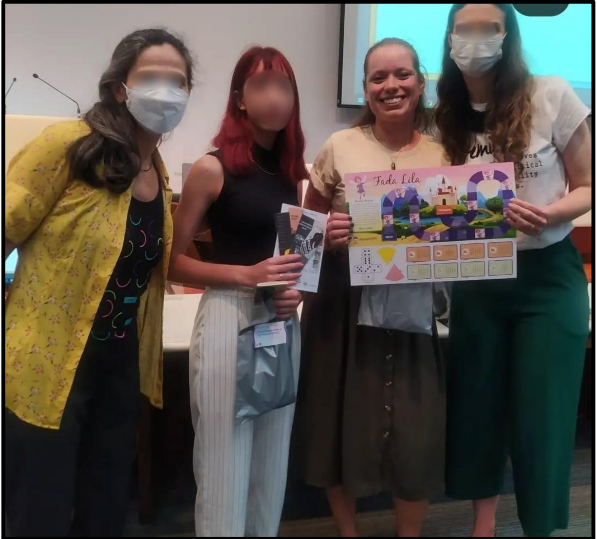
Figura 3 - Apresentação do primeiro coletivo, denominado Por nós , apresentando o seu trabalho na 2ª edição da Semana da Maria da Penha nas escolas. Primeiro ano que foi aberto a outras coordenadorias do estado, em 2022.