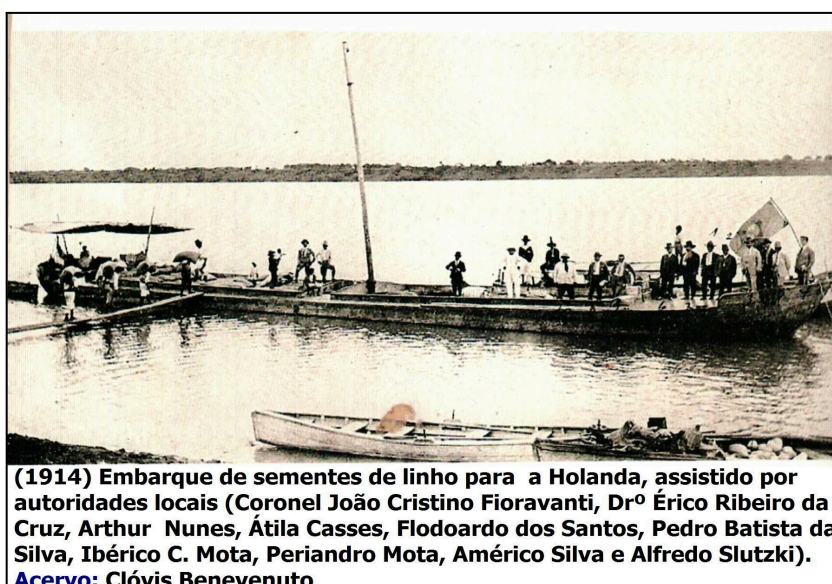
Figura 3: Transporte de sementes para o exterior no Rio Uruguai.

Portanto, a importância do Rio Uruguai para a economia de São Borja é multifacetada. Seu papel estratégico na integração regional e no comércio internacional (Figura 3), aliado ao incentivo ao turismo e à preservação cultural, mostra que o rio é um elemento fundamental tanto para o passado quanto para o futuro do desenvolvimento local.