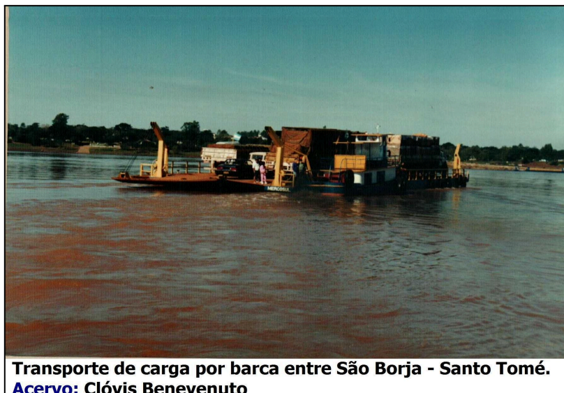
Figura 1: Rio Uruguai