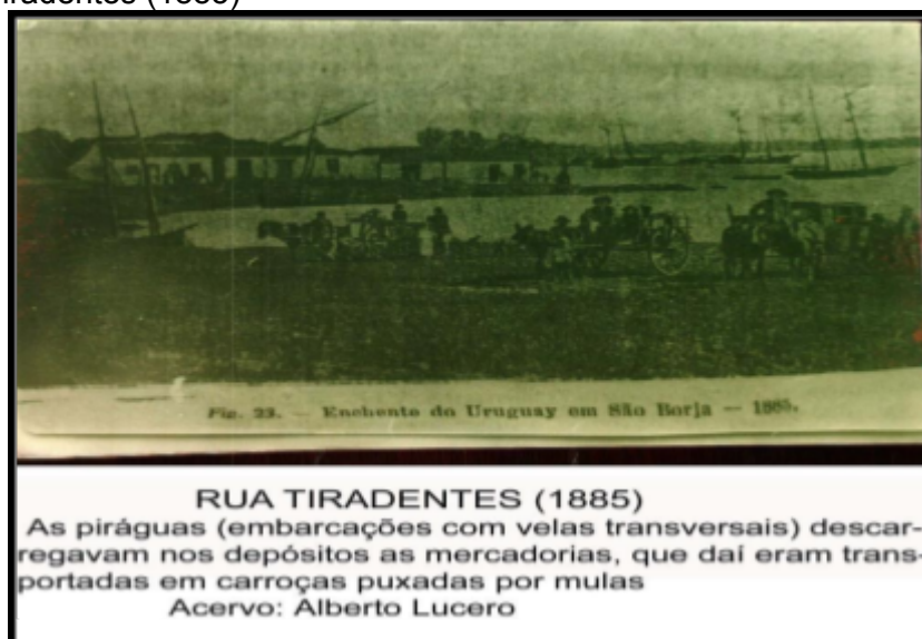
Figura 4: Rua Tiradentes (1885)