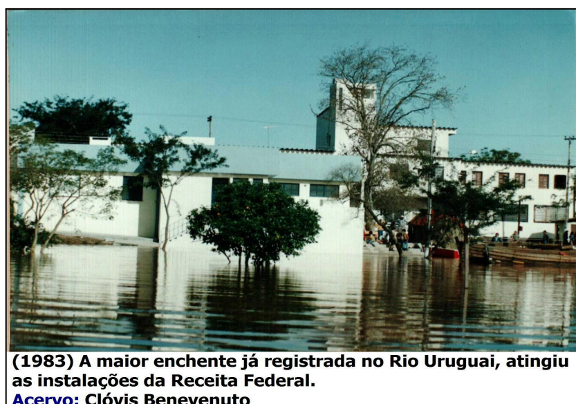
Figura 5: Enchente de 1983.

A problemática evidencia a importância de se adotar uma abordagem integrada no planejamento urbano e ambiental em áreas de fronteira e de grande valor hidrográfico. Conforme aponta Silva (2022), é necessário considerar as especificidades territoriais e socioculturais nas políticas de desenvolvimento regional, sob pena de perpetuar desigualdades e aprofundar os impactos negativos sobre populações vulneráveis.