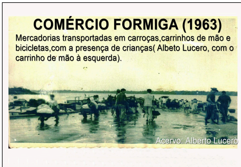
Figura 2: Comércio Formiga