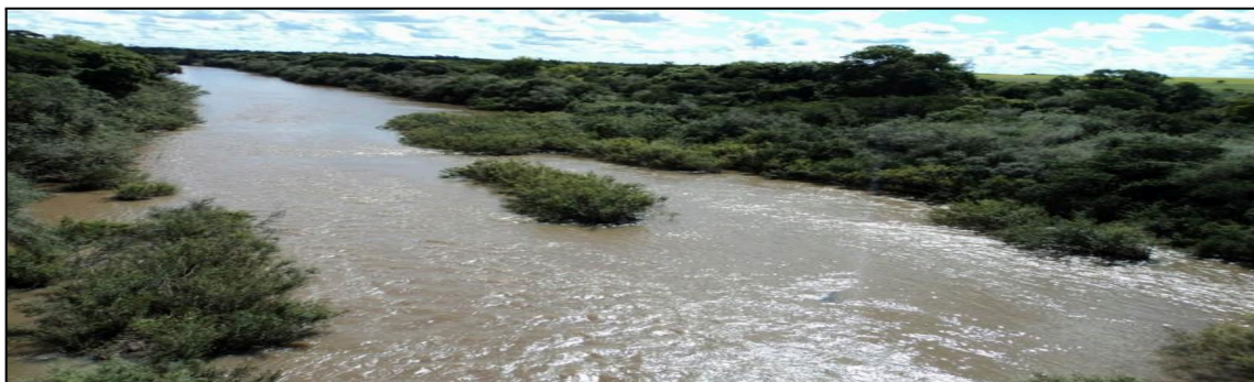
Figura 6: Bacia Hidrográfica do Rios Butuí – Icamaquã

FONTE: http://www.comiteibicui.com.br/bh_002.html https://sema.rs.gov.br/u110-bh-butui-icamaqua