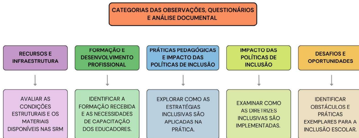
Figura 1: Esquema das categorias dos questionários e seus objetivos