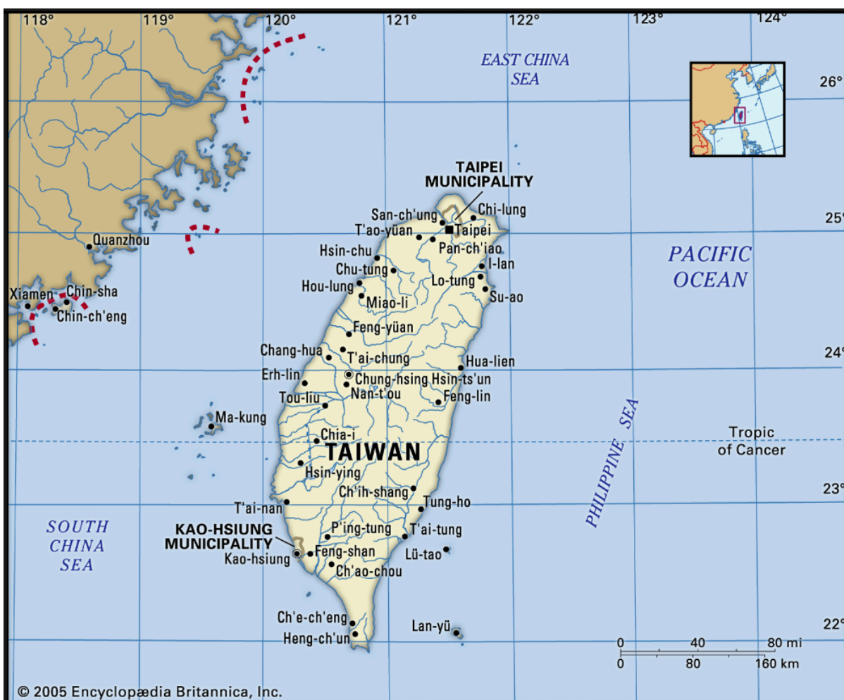
Figura 1- Taiwan