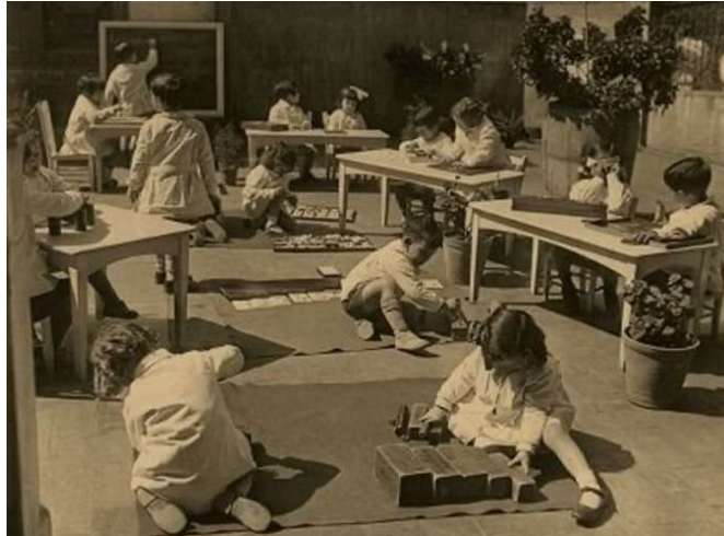
Figura: casa de Bambini

Em 1907, Montessori inaugurou a primeira Casa dei Bambini (Casa das Crianças), em um bairro operário de Roma. Esse espaço, pensado para atender crianças em situação de vulnerabilidade, para evitar tornou-se o laboratório onde a pedagoga pôde aplicar seus princípios, baseados no respeito ao ritmo individual, na autonomia e na liberdade com responsabilidade (LOPES; SILVA, 2019).