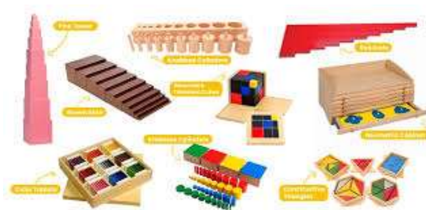
Figura: Matérias Montessori

A abordagem Montessori também se alinha com as ideias de Lev Vygotsky (1978) sobre o papel da interação social e da cultura no desenvolvimento. Embora Vygotsky não tenha se dedicado especificamente ao estudo dos materiais educativos, sua teoria sociointeracionista enfatiza a importância do ambiente e das ferramentas culturais na mediação da aprendizagem. Os materiais Montessori, ao serem utilizados em um ambiente social colaborativo, tornam-se ferramentas culturais que facilitam a aprendizagem e promovem a interação entre as crianças. Vygotsky (1978, p. 57) afirma que "o desenvolvimento humano ocorre em um contexto social e cultural, e é mediado por ferramentas e signos". Os materiais Montessori, nesse sentido, funcionam como essas ferramentas, proporcionando um ambiente de aprendizagem rico e estimulante. Ao utilizar os materiais, as crianças interagem com o mundo e com seus pares, compartilhando experiências e construindo o conhecimento de forma colaborativa.