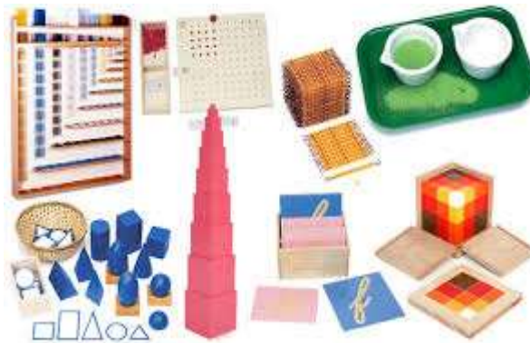
Figura: Matérias Montessori

A aprendizagem ativa consiste em um processo em que a criança se envolve diretamente com o ambiente, manipulando materiais, explorando situações reais e escolhendo suas atividades dentro de um ambiente preparado. Essa abordagem "aprender fazendo" estimula a curiosidade natural, a autonomia e o pensamento crítico.