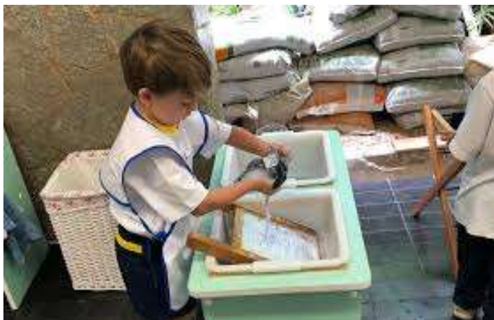
Figura: Matérias Montessori Vida Prática