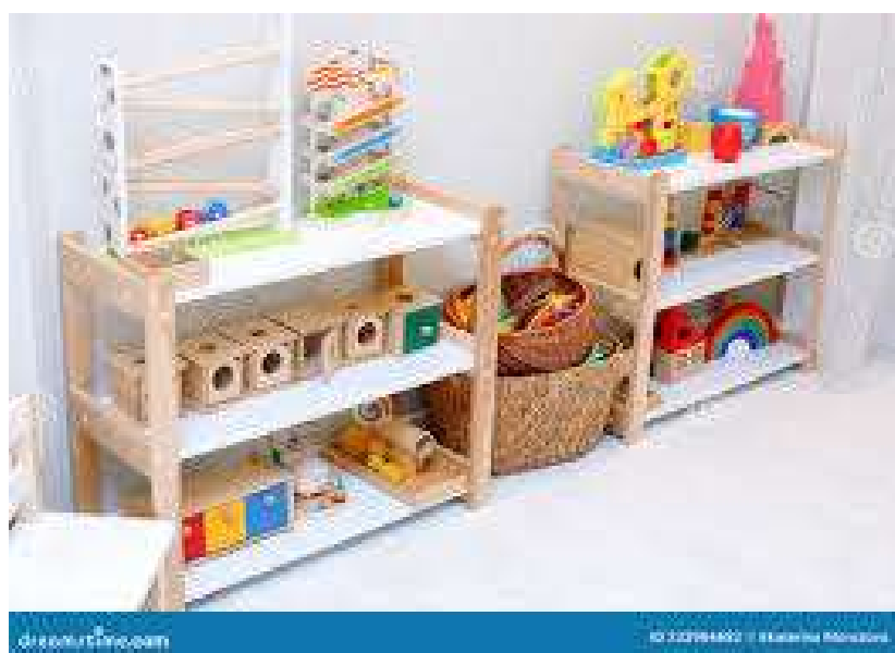
Figura: Espaço destinado a organização do material

A combinação entre materiais concretos, experiência sensorial e ambiente preparado, presente na pedagogia Montessori, oferece um caminho efetivo para o desenvolvimento infantil. Ao proporcionar um ambiente rico em estímulos, a pedagogia Montessori não apenas facilita a construção do conhecimento, mas também promove a autonomia, a confiança e a capacidade de aprender ao longo da vida.