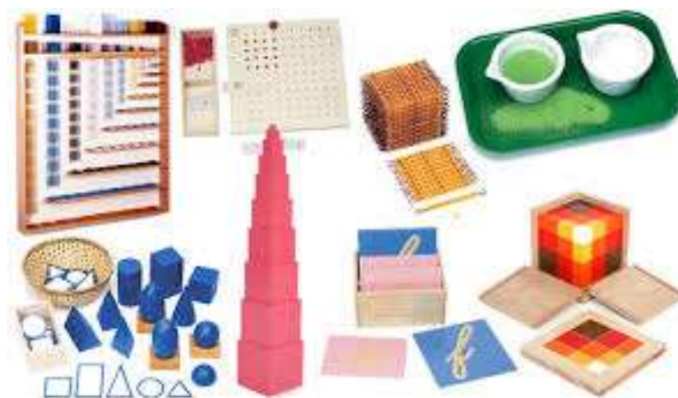
Figura: Matérias Montessori

classificação e raciocínio lógico. Essa manipulação concreta prepara o caminho para a abstração, conforme a criança avança em seu desenvolvimento cognitivo.