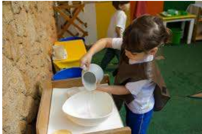
Figura: Explorar materiais diversos da vida cotidiana

O método Montessori valoriza experiências sensoriais ricas e variadas. Materiais como as letras de lixa, os sólidos geométricos e os cilindros de encaixe permitindo que a criança explore formas, cores, texturas e tamanhos, estimulando a percepção sensorial e a compreensão do mundo.