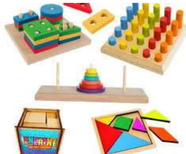
Figura: Matérias Montessori didático

Eles oferecem as condições para que a criança possa explorar, interagir e aprender de forma autônoma. Conforme a teoria montessoriana, o ambiente é o primeiro professor. O papel do educador é, portanto, multifacetado, combinando: Observação científica e escuta atenta; Orientação individualizada e discreta; E, organização e manutenção do ambiente preparado. Tudo isso é realizado com o foco inegociável no desenvolvimento integral e na manifestação da "criança normalizada".