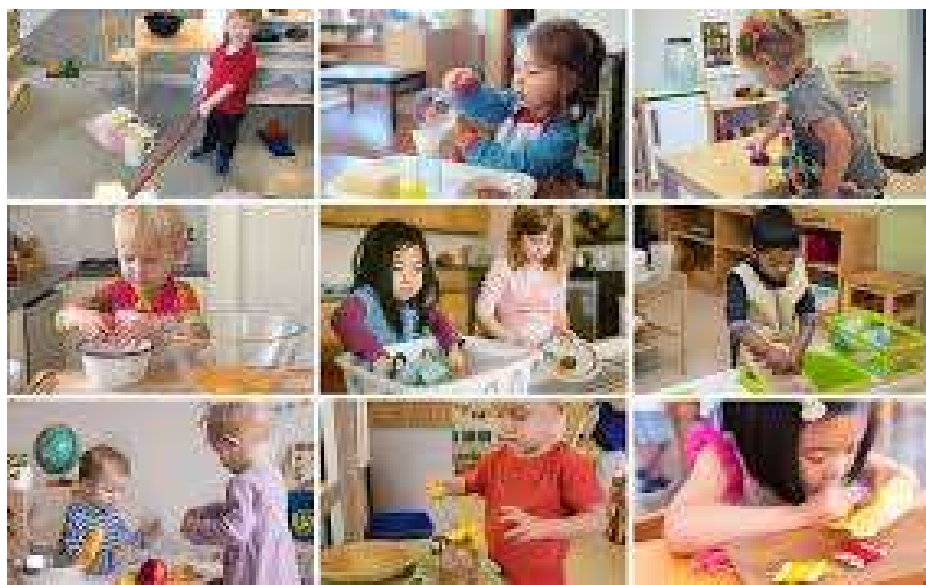
Figura: conexões sociais e senso de coletividade, espaço para explorar interesses

princípio defendido por Malaguzzi, da abordagem Reggio Emilia, ao afirmar que “nada sem alegria” deve marcar as experiências da infância. Dessa forma, é possível afirmar que a Pedagogia Montessoriana, ao articular ambiente, materiais, autonomia e papel do educador, oferece bases sólidas para práticas pedagógicas inovadoras e humanizadoras na Educação Infantil, reafirmando o direito das crianças a aprender de maneira significativa e ativa.