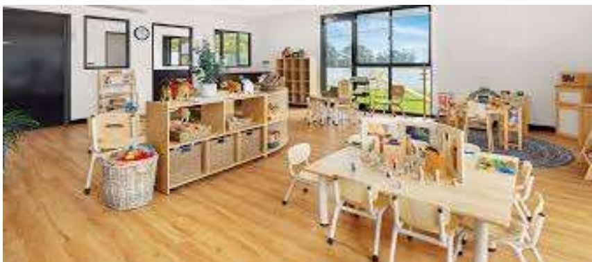
Figura: Ambiente preparado