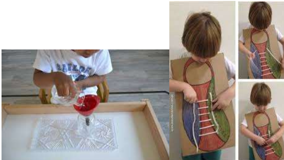
Figura: Despejar água, amarrar cordões