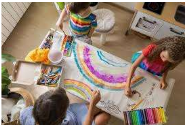
Figura: conexões sociais e senso de coletividade