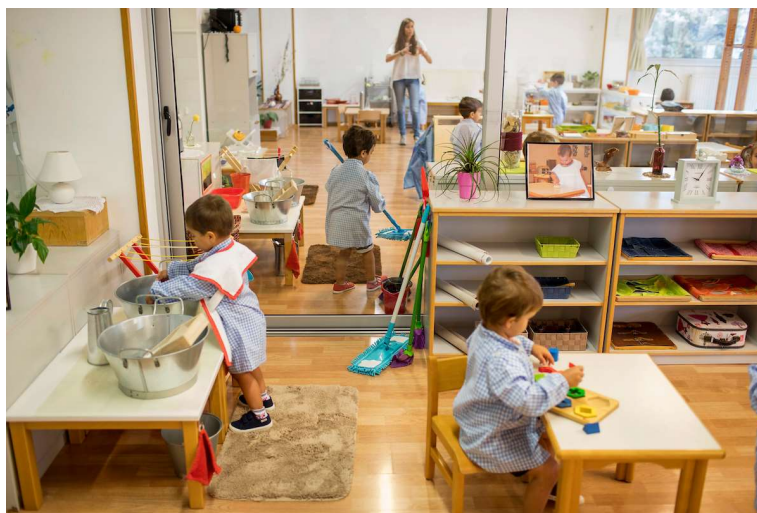
Figura: Ambiente preparado

Nesse sentido, o Ambiente Montessori como palco da ludicidade, como um "ambiente preparado" (Montessori, 1965), é rico em materiais cuidadosamente projetados, que convidam a criança a explorar e a aprender por meio dos sentidos. Esses materiais, como os sólidos geométricos, as torres rosa e marrom, e os materiais para as atividades de vida prática (transvasar, amarrar, abotoar), os quais são propositadamente lúdicos, incentivando a manipulação, a experimentação e a descoberta.