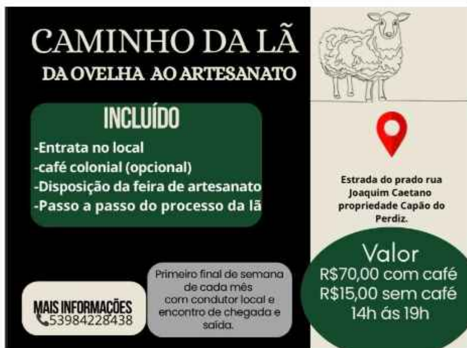
Figura 07 e 08: Folder frente e verso