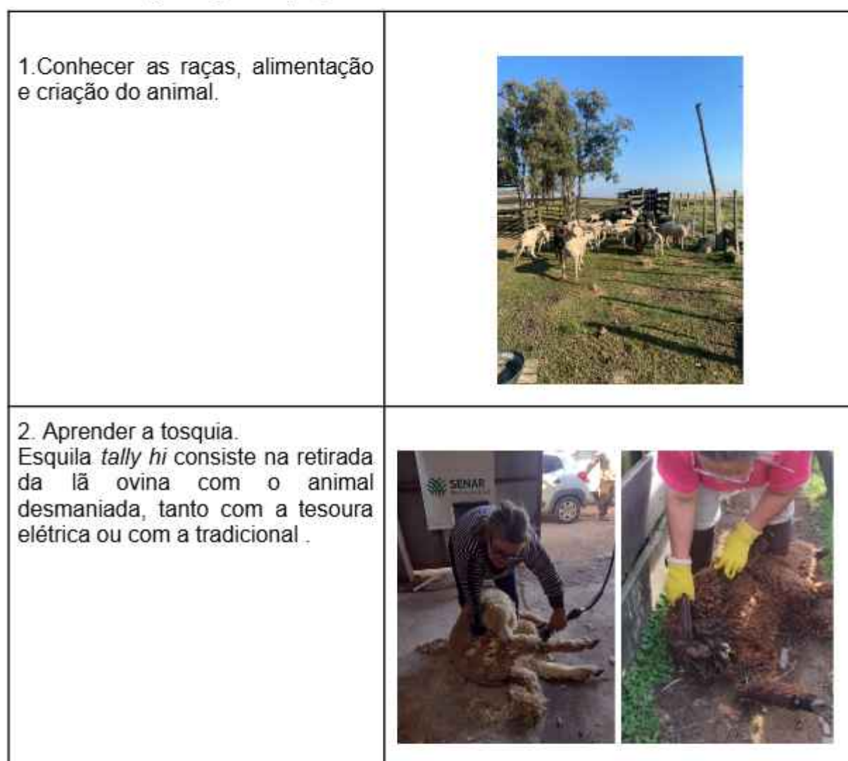
Quadro 1: Programação na propriedade

nesta propriedade. Atividades da propriedade: conhecer raças ovinas, alimentação, criação do animal, tosquia, lavagem da lã, cardação e fiação e tecelagem.