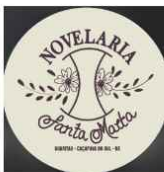
Figura 4: Logomarca Novelaria Santa Marta