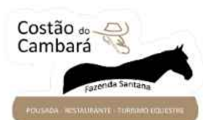
Figura 02: Logomarca Costão do Cambará: