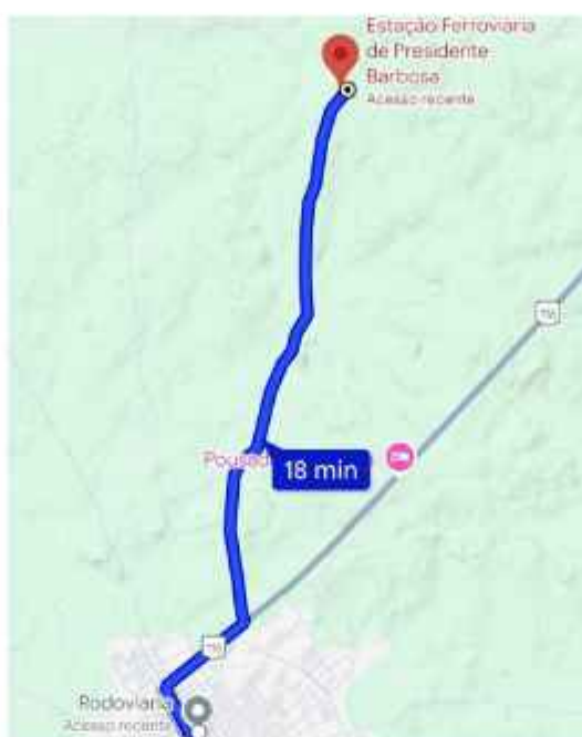
Figura 06: Mapa da Localização da Propriedade