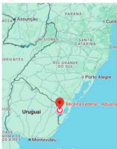
Figura 1: Mapa Localização de Jaguarão