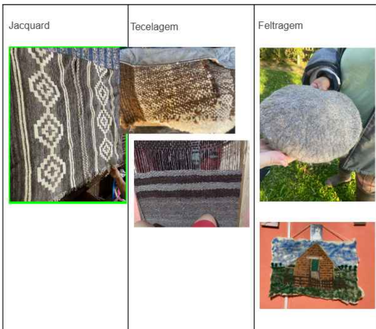
Figura 05: Quadro de apresentação de técnicas de artesanato em lã.