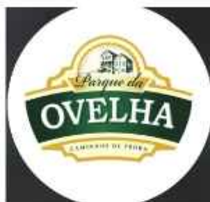
Figura 03: Logomarca Parque da Ovelha