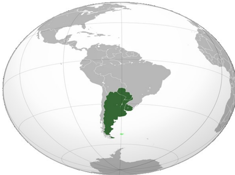
Figura 01: Mapa Atual da Região Platina.