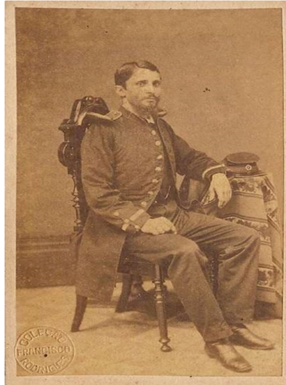
Figura 5: Soldado José Francisco Lacerda vulgo Chico Diabo