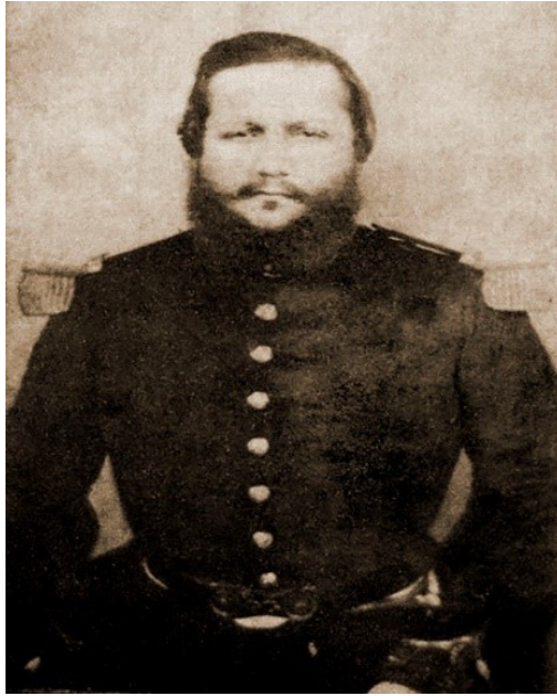
Figura 6: Última foto conhecida de Solano López, pelo fotógrafo Domenico Parodi, 1870.

Fonte: https://aventurasnahistoria.com.br