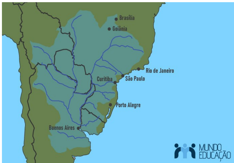
Figura 4: Mapa da Bacia Hidrográfica do Prata