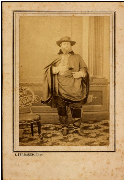
Figura 7: Imperador Dom Pedro II – no Rio Grande do Sul em 1865