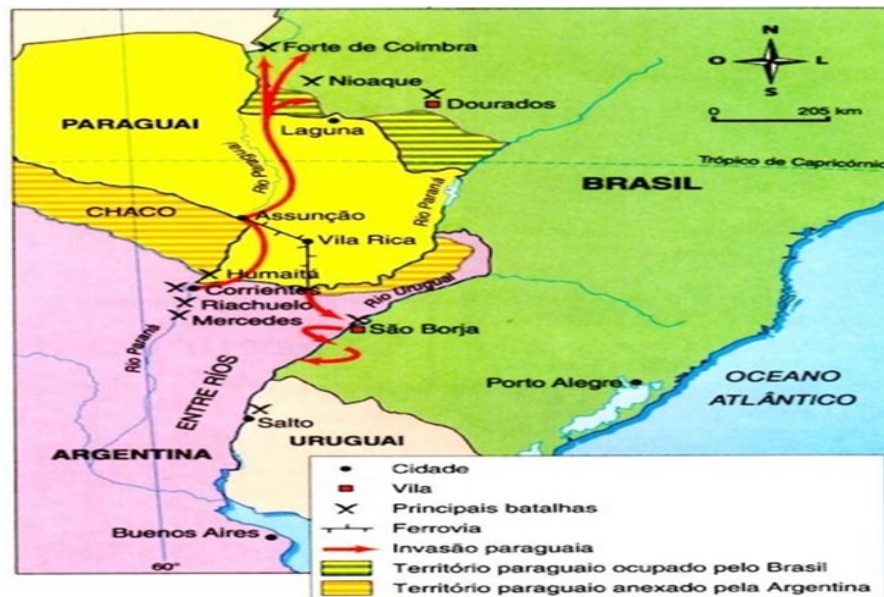
Figura 02: Mapa da Região Platina – Guerra da Tríplice Aliança contra o Paraguai.