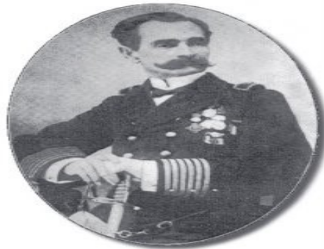
Figura 3: General brasileiro José Luiz Rodrigues da Silva