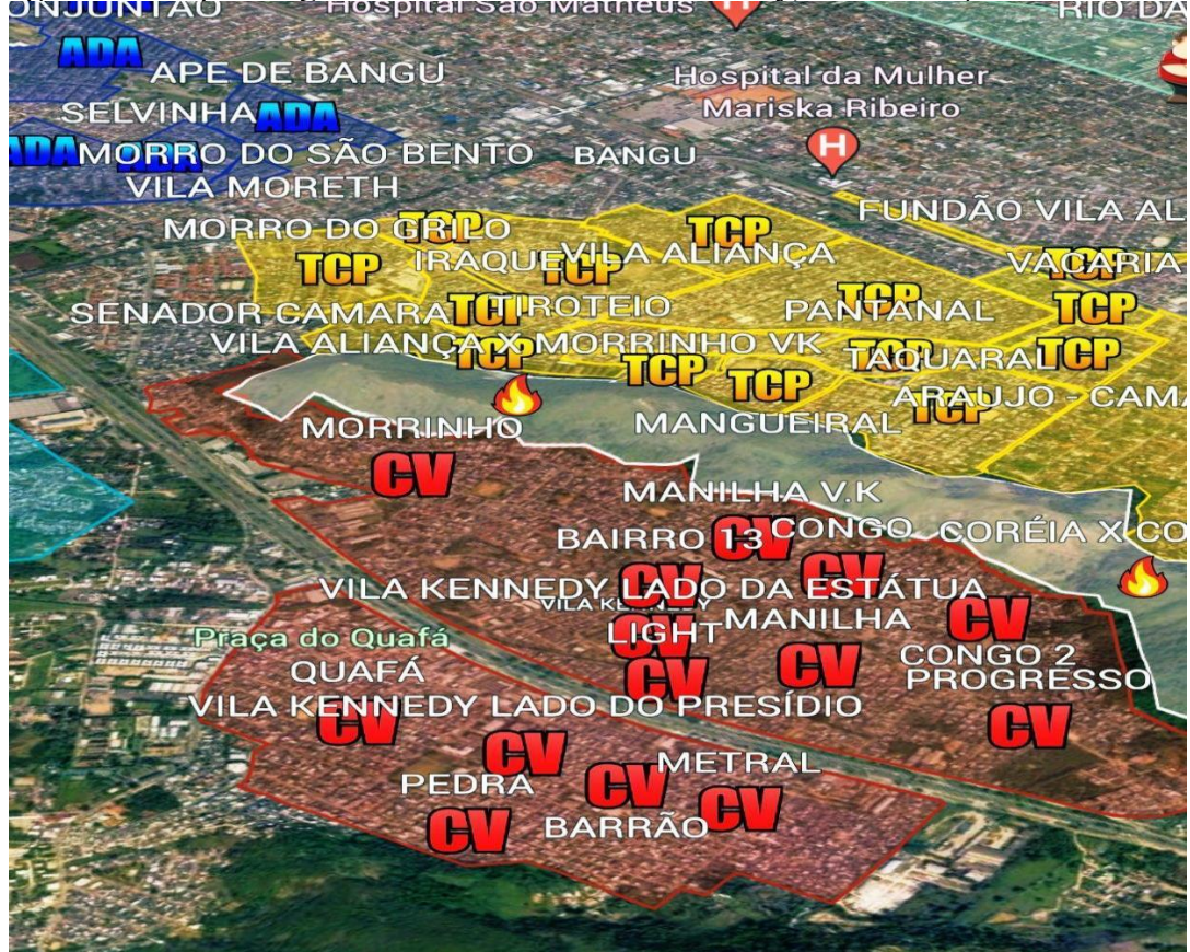
Figura 2 - Mapa Geográfico da Favela da Vila Kennedy, Vila Aliança e Vila Vintém

Conforme destaca Valladares (1978), o programa de remoção de favelas e reassentamento de famílias faveladas, fez com que o Estado realocasse a população pobre e desassistida da Zona Norte e do centro, para a Zona Oeste carioca, culminando em uma expansão desordenada e um desmatamento nunca visto anteriormente. A justificativa da Prefeitura do Rio de Janeiro (Rio de Janeiro, 2014) foi a expansão da malha urbana para a zona oeste em razão das áreas de planejamento 1, 2 e 3 (Centro, Zona Sul e Zona Norte respectivamente). Portanto, criou-se a área de planejamento 4 (Zona Oeste), diferentemente das áreas 1, 2 e 3 a ocupação e a preservação do solo ocorreu de maneira distinta, assim como a questão imobiliária que passou a servir como base para os Projetos das Companhias Habitacionais (COHAB) (Nicola, 2021).