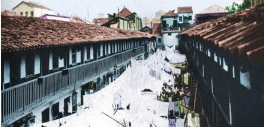
Figura 1 - Cortiço da Rua Visconde do Rio Branco (1906)