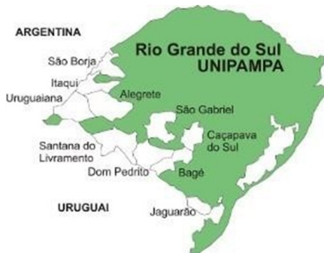
Figura 1 - Localização dos campi da Unipampa no RS