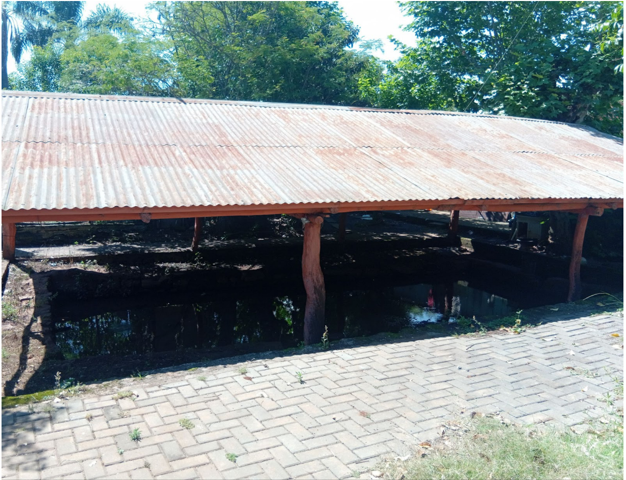
Figura 6. Imagem da fonte de São Pedro