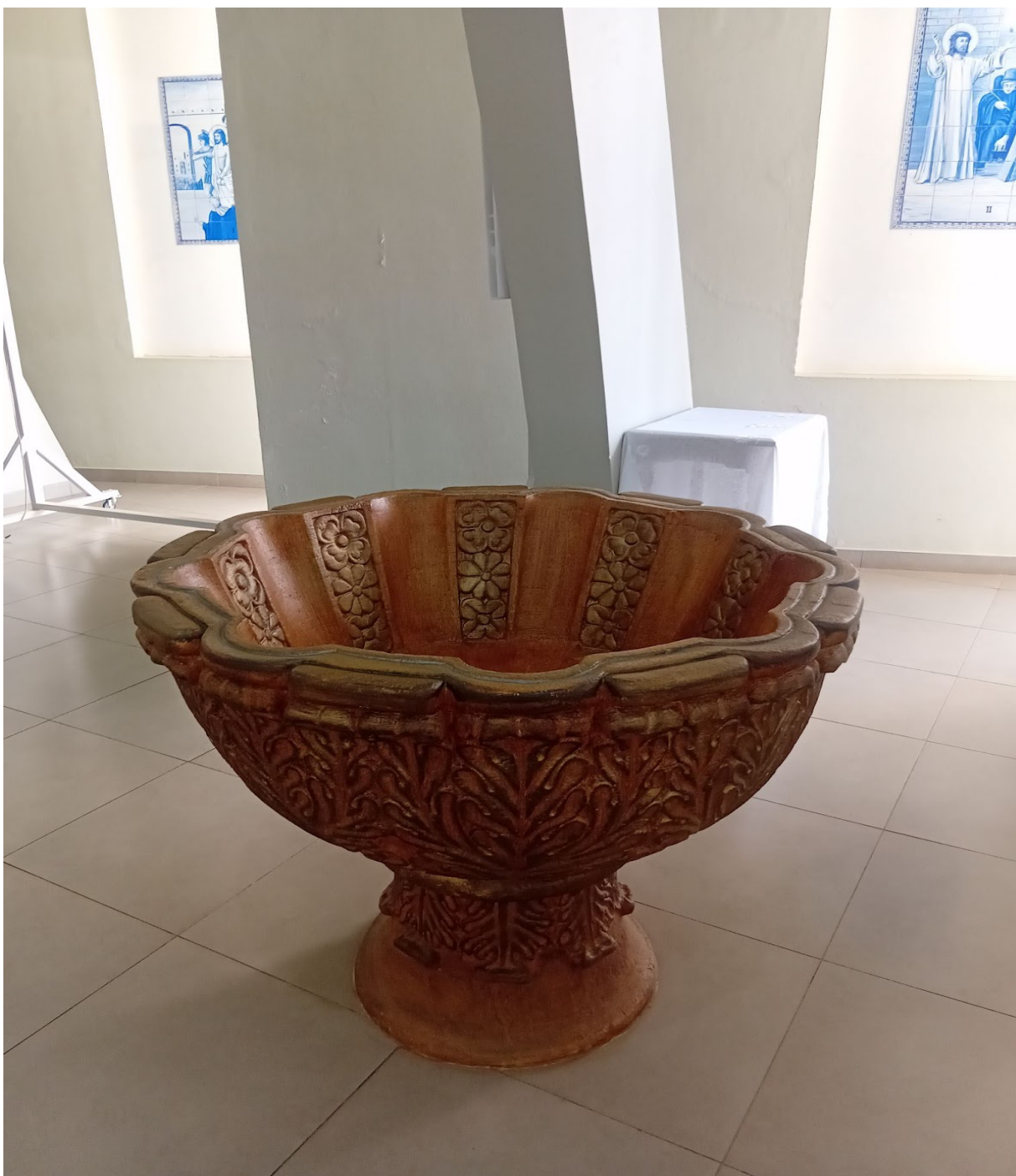
Figura 7. Imagem da pia batismal (Igreja Matriz de São Borja)

mantém vivo um elo entre a prática sacramental contemporânea e as raízes históricas que moldaram a formação espiritual da região.