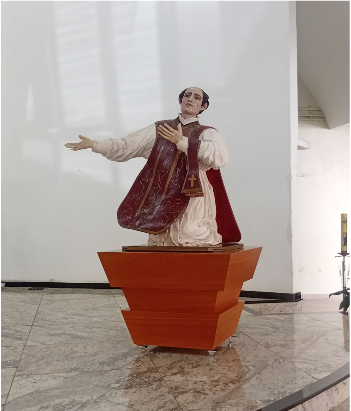
Figura 2. Imagem de São Francisco de Borja (Igreja Matriz de São Borja)

preserva um patrimônio material relevante, mas também sustenta um importante componente identitário para os moradores de São Borja.