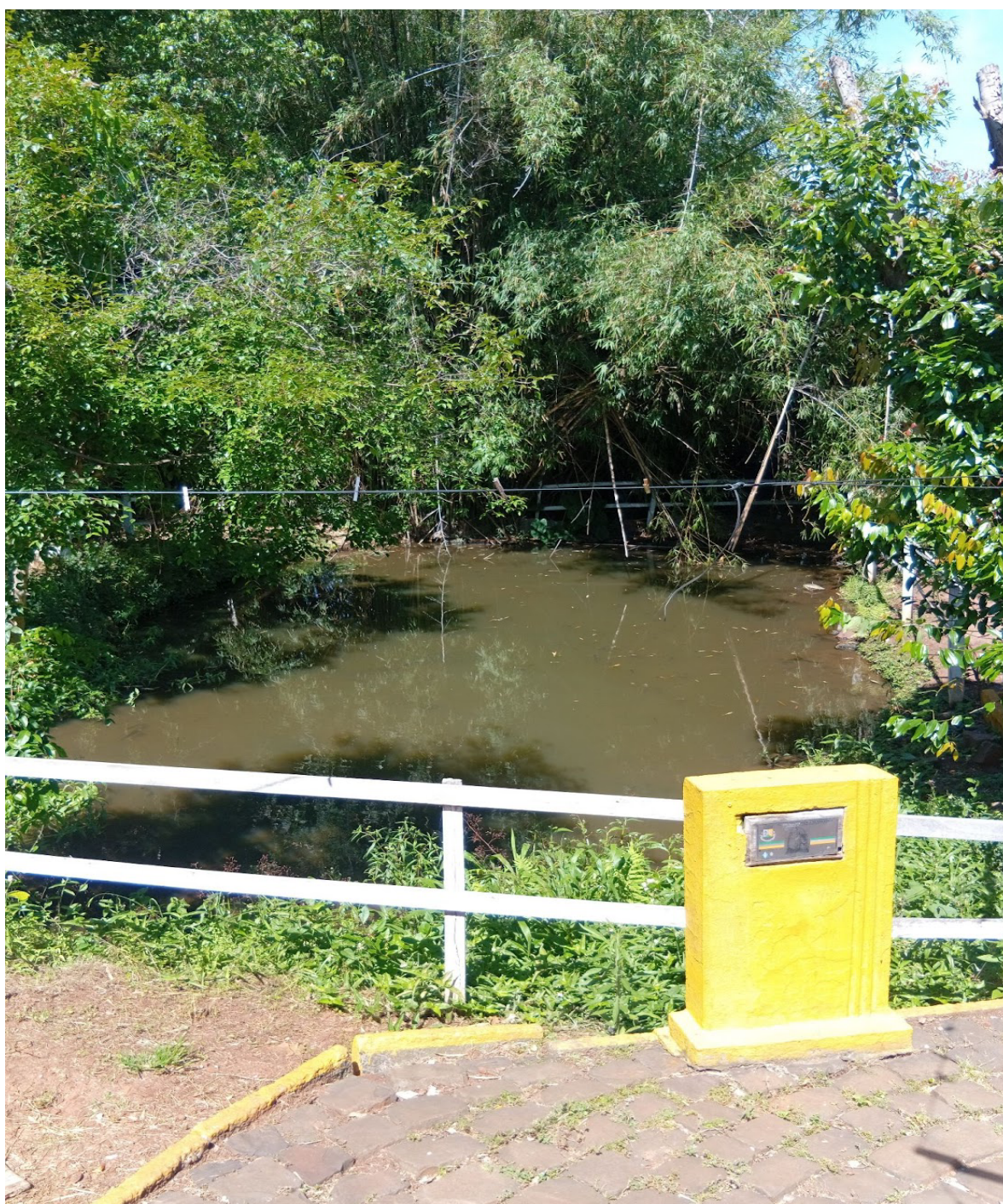
Figura 3. Imagem da fonte de São João Batista

As duas fontes de água remanescentes do período jesuítico, que revelam a engenhosidade das técnicas de abastecimento e o valor simbólico da água como elemento purificador.