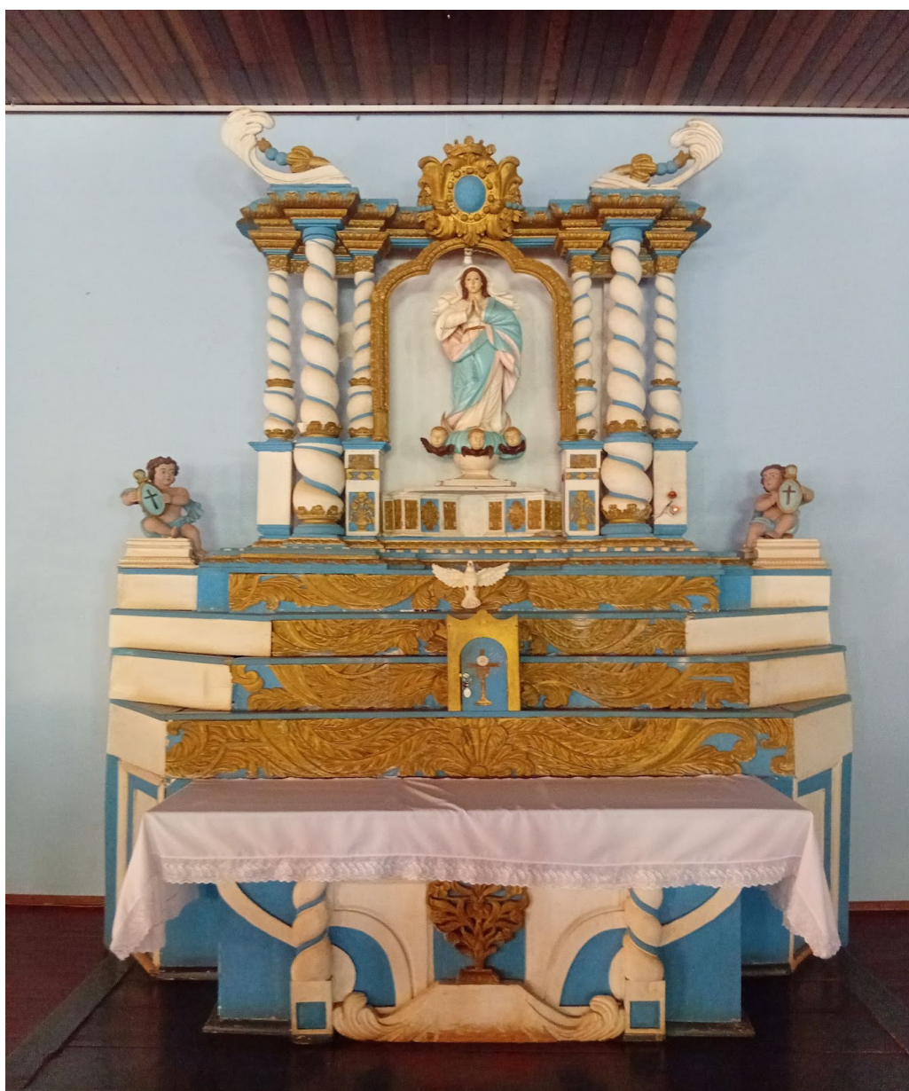
Figura 9. Altar da Igreja do Passo

Também se destaca o altar da Igreja do Passo, cuja estrutura e ornamentos seguem a estética do barroco missioneiro, revelando a síntese entre arte, fé e técnica que caracterizava o trabalho coletivo entre padres e guaranis.