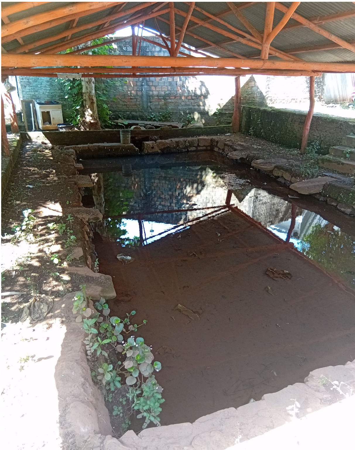
Figura 5. Imagem da fonte de São Pedro