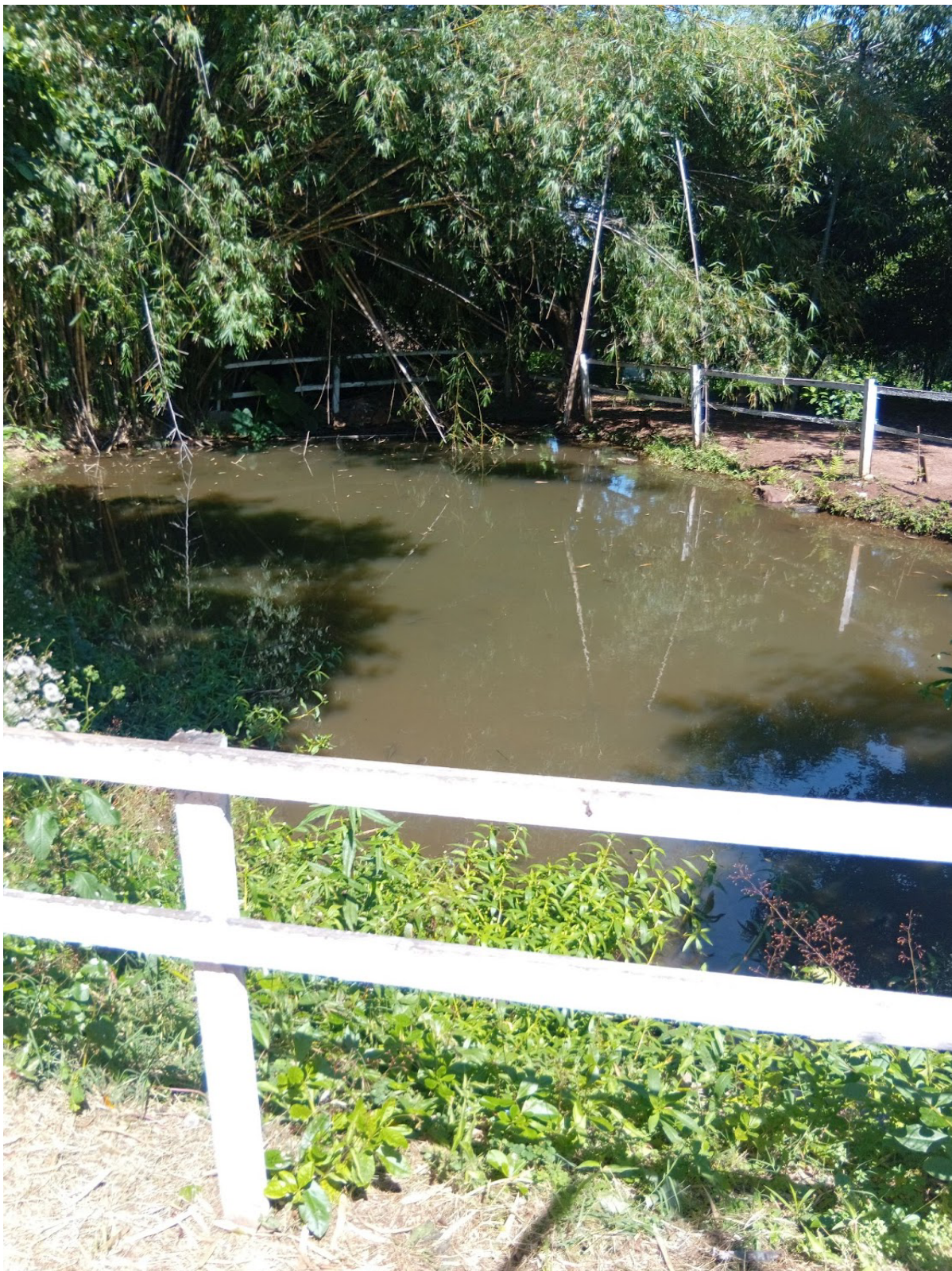
Figura 4. Imagem da fonte de São João Batista