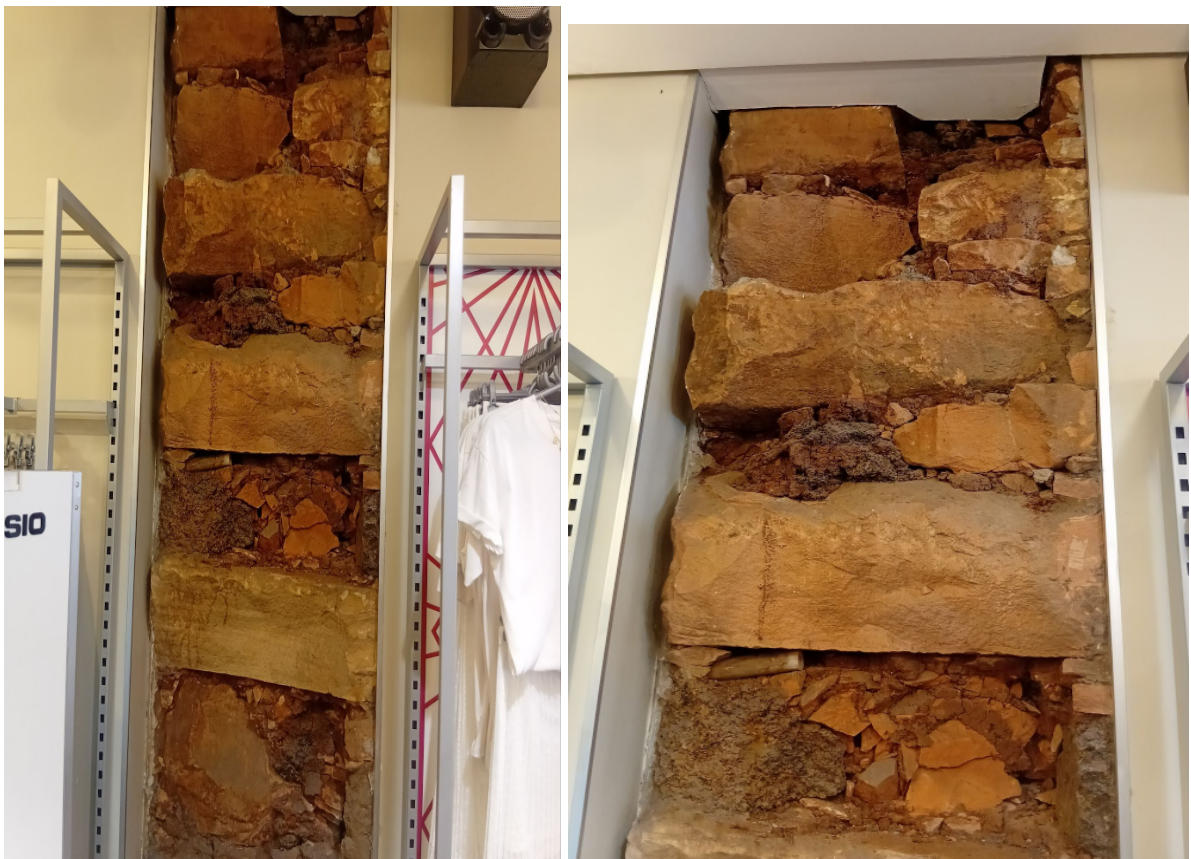
Figura 8. Construção jesuítica com pedra grés

Outros vestígios significativos encontram-se nas construções jesuíticas preservadas na área central da cidade, as quais Pinto (2015) identifica como remanescentes materiais da antiga redução de São Francisco de Borja. Esses elementos integram o conjunto do patrimônio missioneiro local e se articulam com o sítio arqueológico das Missões em São Borja, identificado pelo IPHAN como área de preservação onde se encontram estruturas, fragmentos e marcas da ocupação JESUÍTICO-GUARANI. Trata-se de um espaço que concentra evidências arqueológicas do período reducional, contribuindo para compreender a organização urbana, religiosa e produtiva da antiga redução e reforçando a importância histórica do território são borjense dentro do sistema dos Sete Povos. Como o prédio que abriga a loja Gangue, cujas fundações e paredes em pedra grés remetem à arquitetura das reduções.