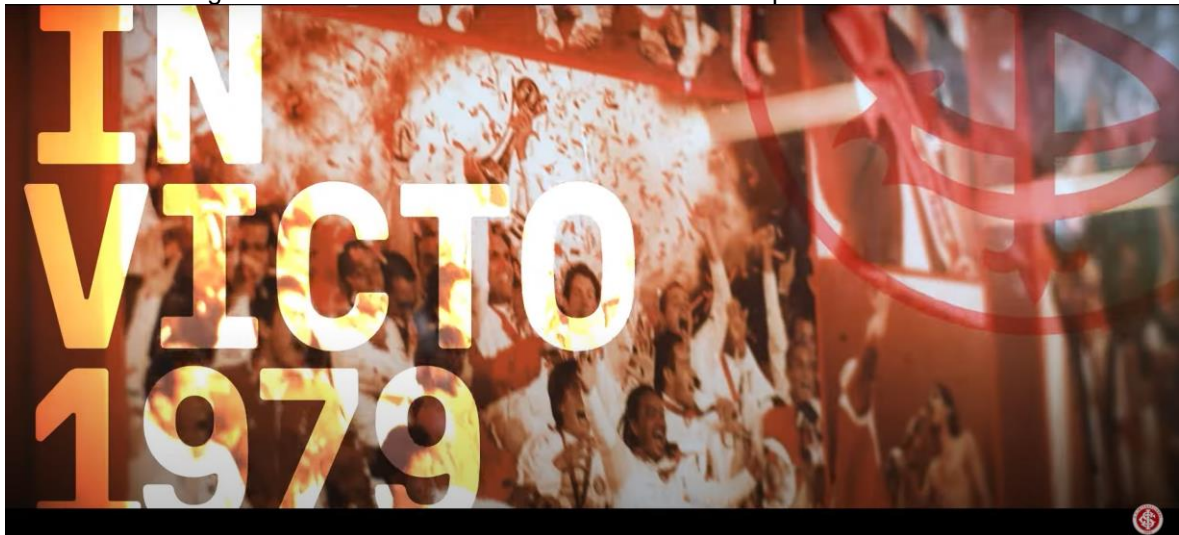
Figura 07 - Frame 1 do vídeo institucional da campanha “Vivo em Ti”

Como vemos, os frames utilizados nessa análise também se referem a esses momentos históricos protagonizados por time e torcida.