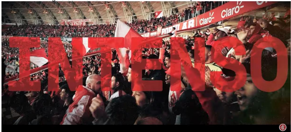
Figura 08 - Frame 2 do vídeo institucional da campanha "Vivo em Ti"

Para o autor, isso quer dizer que a memória não vai recuperar exatamente aquilo que aconteceu e/ou que foi dito, mas que vai trazer vestígios que funcionam como gatilhos para fazer lembrar, reconstruindo o passado no presente, como é enfatizado ao longo do vídeo. Sendo assim, a campanha publicitária busca resgatar no imaginário dos torcedores, principalmente dos mais antigos, uma glória que no futebol brasileiro, até hoje, nenhum outro clube conseguiu fazer. Com isso, a campanha busca reavivar sentimentos em cada torcedor que viveu aquela época e fazer com que os torcedores mais novos possam também se orgulhar desse feito, tão difícil de ser alcançado.