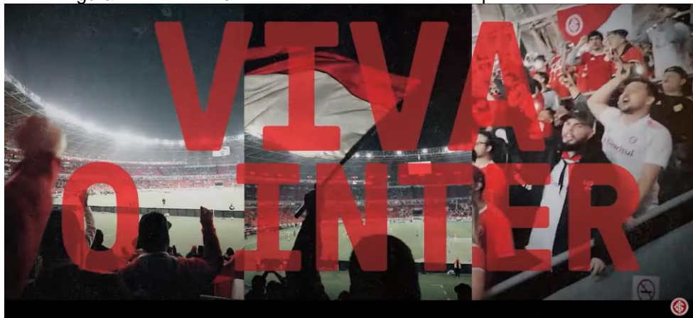
Figura 11 – Frame 5 do vídeo institucional da campanha “Vivo em Ti”

Além disso, é possível observar que essas imagens se entrelaçam com a ideia de pertencimento coletivo. O sentimento de “ser Inter” é representado por meio de um conjunto de elementos que remetem ao esforço coletivo, à persistência e à paixão, valores que compõem a subjetividade do torcedor e reforçam o posicionamento do clube. Esses elementos visuais atuam como marcas do funcionamento da memória, conforme concebemos neste trabalho. Desse modo, a campanha não apenas comunica, mas traz de volta sentidos já consolidados na trajetória do clube, atualizando-os em um novo contexto e reafirmando o vínculo emocional que sustenta a lealdade da torcida.