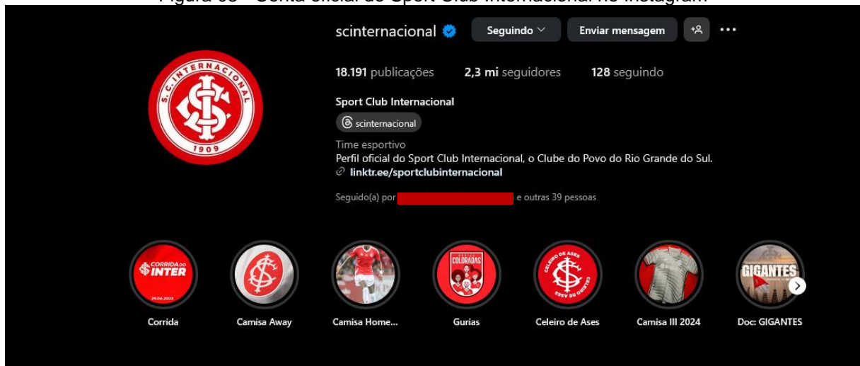
Figura 03 - Conta oficial do Sport Club Internacional no Instagram

Já no Instagram 5 , a conta oficial do clube chega a 2,3 milhões de seguidores e já possui mais de 18 mil postagens, demonstrando uma forte presença digital: