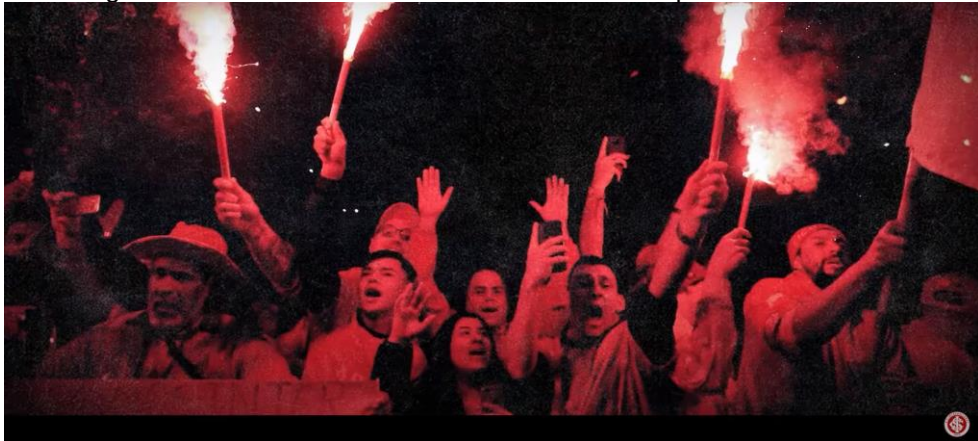
Figura 12 – Frame 6 do vídeo institucional da campanha “Vivo em Ti”