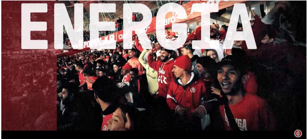
Figura 09 - Frame 3 do vídeo institucional da campanha "Vivo em Ti"