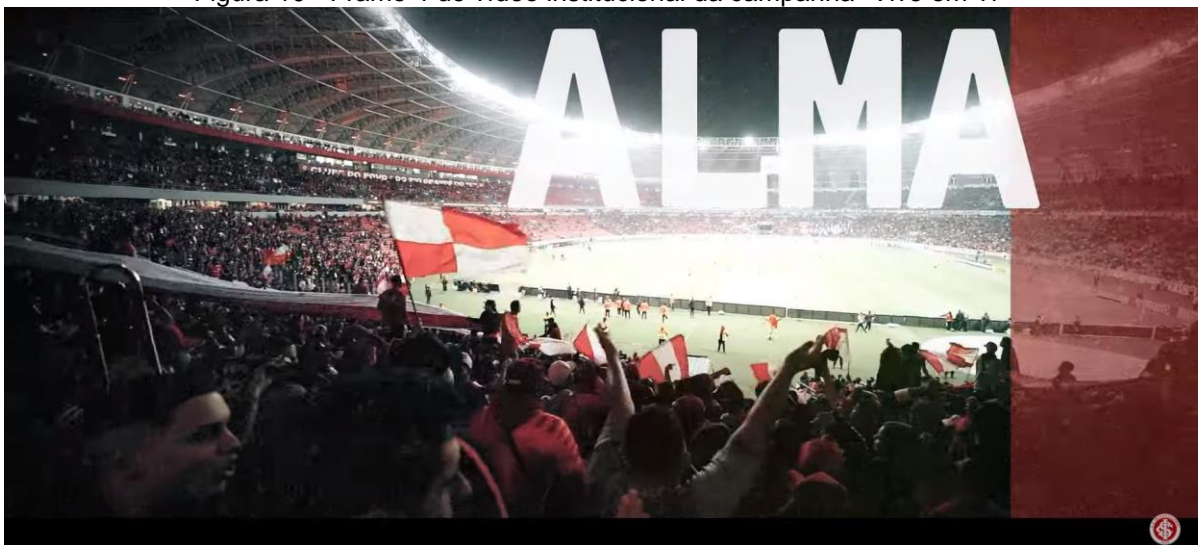
Figura 10 - Frame 4 do vídeo institucional da campanha "Vivo em Ti"