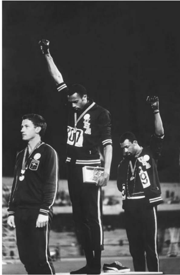
Figura 14 – Tommie Smith e John Carlos, medalhistas olímpicos em 1968, em manifestação histórica no pódio da disputa.